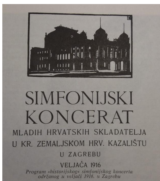
Slika br.1: Plakat koncerta u veljači

Veliku prekretnicu označava koncert mladih hrvatskih skladatelja u zgradi Hrvatskog narodnog kazališta 5.veljače 1916.godine. Orkestrom je ravnao dirigent Fridrik Rukavina, a izvodila su se djela tada ne tako poznatih skladatelja kao što su Krešimir Baranović, Božidar Širola, Franjo Dugan i Dora Pejačević, Svetislav Stančić i Antun Dobronić. Značenje tog koncerta odmah je prepoznato, skladatelji se služe novih tehnikama koje je tek trebalo predstaviti na hrvatskom umjetničkom području, a motivi su nacionalni, pa spoj naizgled nemogućeg, oduševljava publiku i kritiku.