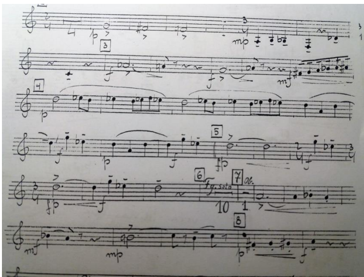
Slika br.7 Isječak iz broja 5.,

Skladateljski opus započinje snažnim utjecajem nacionalnog smjera, piše uglavnom instrumentalnu glazbu (kao što je Slavska rapsodija za orkestar, Prvi gudački kvartet i Concertino za gudački orkestar). Nakon prve izrazite nacionalne faze prelazi u potpunu suprotnost, dodekafoniju, atonalitet i glazbenu avangardu. Najuspješnije djelo mu je Kantata o čovjeku u kojem spaja povijest književnosti, filozofiju i glazbu na moderan način. Na komornom području Milo Cipra piše za gudačke kvartete, klavirska trija, ali ne zanemaruje ni duhače za koje piše Pet intermezza za dubrovačku komediju i Simetrije za duhački kvintet, Trio za obou klarinet i fagot, a u primjeru je isječak dionice roga iz djela Buđenje (Aubade) također za duhački kvintet.