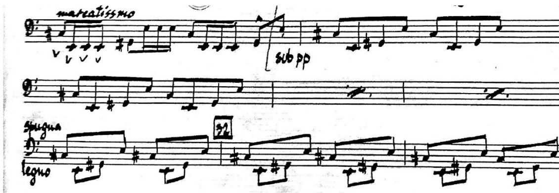
Slika 6 Solo dionica timpana

Smirenje drugog stavka dogodi se na samom njegovom kraju u kadenci timpana.