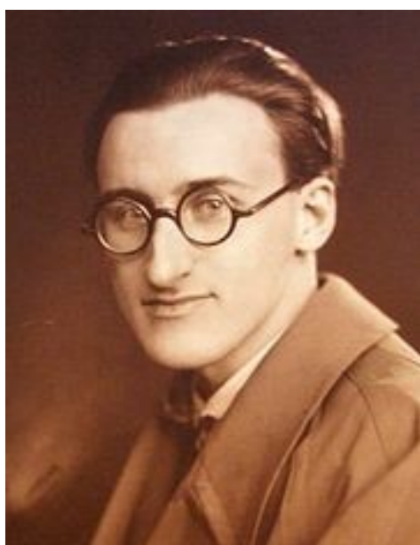
Slika 1 Boris Papandopulo kao mladi glazbenik

Boris Papandopulo (Honnef am Rhein [od 1960. Bad Honnef], Njemačka, 25. veljače 1906. - Zagreb, 16. listopada 1991.) potomak je ugledne obitelji Strozzi, koja je njegovala kazališnu i glazbenu umjetnost - sin operne pjevačice Maje Strozzi-Pečić i grčkog plemenitaša Konstantina Papandopula. Otac umire mlad pa se Papandopulova majka s malim Borisom iz Njemačke vraća u Zagreb u kojem Papandopulo provodi djetinjstvo, mladost te se istovremeno školuje. "Rođen, odrastao i odgojen u obitelji koja je oduvijek bila tijesno povezana s muzikom i kazalištem" 1 .