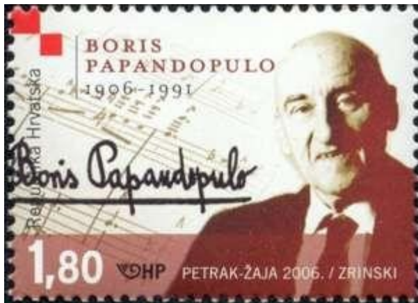
Slika 2 poštanska marka

Bio je redoviti član JAZU (današnja Hrvatska akademija znanosti i umjetnosti) od 1965, počasni član HGZ od 1977. Dobitnik je nagrada grada Zagreba 1961. i 1962., »Vladimir Nazor« 1963. (za kantatu Legende o drugu Titu ) i 1968. (za životno djelo), »Josip Štolcer Slavenski« 1970. i »Lovro pl. Matačić« 1990. Ostavština mu se od 2006. čuva u knjižnici Hrvatskoga glazbenog zavoda u Zagrebu. Njegovo ime nose osnovne glazbene škole u Kutini (od 1993.) i Splitu (od 1996.) te kvartet saksofona u Zagrebu (od 2013.). Hrvatsko društvo skladatelja utemeljilo je 1997. i po njemu nazvalo godišnju nagradu za autorsko stvaralaštvo na području ozbiljne glazbe. Portretne karikature načinili su mu J. Kljaković (oko 1925) i Klementina Požgaj-Schwarz (crtež ugljenom, Grafička zbirka NSK), a portretirali su ga i Truda Braun-Šaban (crtež ugljenom, 1945), J. Marinović (reljef, od 1996. u HNK u Zagrebu) te K. Kovačić (poprsje, od 2003. u Aleji hrvatskih skladatelja u Osoru; odljev od 2006. u zagrebačkom i splitskom HNK). Godine 2006. izdana je poštanska marka s njegovim likom (serija Hrvatska glazba).