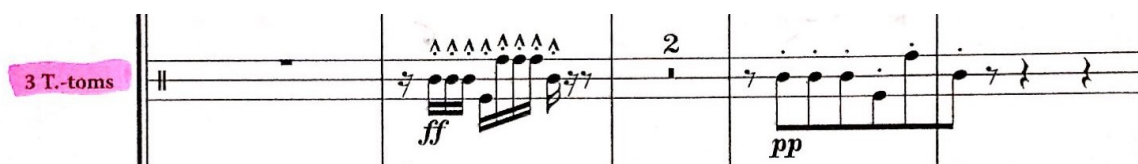
Slika 15 Madame Buffault - tomovi (melodija na temu iz Beethovenove V. simfonije)

Kada se opera Madame Buffault izvodila na Muzičkoj akademiji u Zagrebu imala sam priliku svirati dionicu tomova i tambura rullante, prilikom čega sam mogla primijetiti da Papandopulo puno pažnje polaže upravo dionici tomova. Ponekad ih koristi s naglaskom na ritmu, ponekad na melodiji. Zanimljivo je kako ih je iskoristio na mjestu gdje nailazimo na temu iz Beethovenove V. simfonije gdje melodiju preuzimaju upravo ti instrumenti. Tomovi se, uz glavne udaraljke kao što su timpani, mali bubanj, bas bubanj i činele; jako često pojavljuju u Papandopulovim orkestralnim djelima.