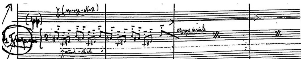
Slika 4 Papandopulov rukopis (iz partiture) - prva strana

Drugi stavak započinje šesterotaktnom temom gudača uz potporu malog bubnja, potom vodstvo preuzimaju truba i timpani uz pratnju gudača. Ponovni nastup teme nalazimo u prvim violinama da bi u broju 29 glavnu melodijsku i ritmičku ulogu preuzeli timpani. Za solista je ovo mjesto najteži dio stavka, jer je potrebno po dva takta intonirati molski sekstakord (E-Gis-cis-e), molski terc-kvartakord (G-B-c-es) te smanjeni septakord (F-As-ces-es). Solistička dionica zahtijeva dakle ugađanje sva četiri timpana bez pauza pri čemu je najveći izazov osmisliti rad nogu na pedalama takvim redosljedom koji će omogućiti dovoljno brzo ugađanje. Kraj stavka je također izvođački vrlo zanimljiv jer je Papandopulo opet pristupio timpanima kao potpuno melodijskom instrumentu. Uz to još koristi i dva različita zvuka, u jednoj ruci potrebno je svirati mekanom a u drugoj drvenom palicom. Nije potpuno sigurno na kojem točno mjestu je Papandopulo želio da se palica u lijevoj ruci okrene. U partituri je takvu uputu zapisao već u taktu broj 274, ali u solo dionici tek četiri takta kasnije. Kad sam solističku dionicu prepisivala u programu Sibelius ipak sam odabrala ovu drugu mogućnost jer mi se tako činilo zanimljivije zbog toga što u početku čujemo cijeli akord uobičajenim zvukom, da bi ga se kasnije obogatilo promjenom u boji zvuka.