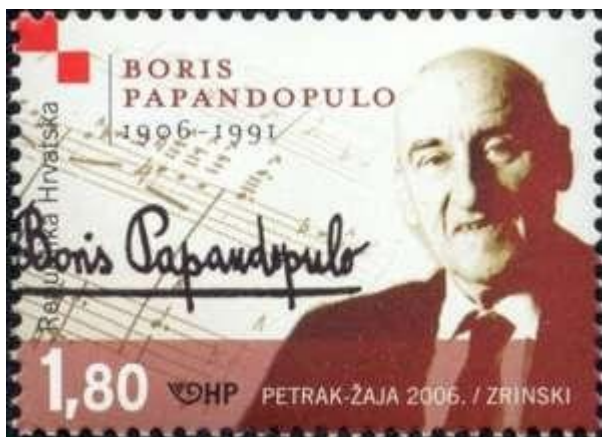
Slika 2 poštanska marka

Bio je redoviti član JAZU (današnja Hrvatska akademija znanosti i umjetnosti) od 1965, počasni član HGZ od 1977. Dobitnik je nagrada grada Zagreba 1961. i 1962., »Vladimir Nazor« 1963. (za kantatu Legende o drugu Titu ) i 1968. (za životno djelo), »Josip Štolcer Slavenski« 1970. i »Lovro pl. Matačić« 1990. Ostavština mu se od 2006. čuva u knjižnici Hrvatskoga glazbenog zavoda u Zagrebu. Njegovo ime nose osnovne glazbene škole u Kutini (od 1993.) i Splitu (od 1996.) te kvartet saksofona u Zagrebu (od 2013.). Hrvatsko društvo skladatelja utemeljilo je 1997. i po njemu nazvalo godišnju nagradu za autorsko stvaralaštvo na području ozbiljne glazbe. Portretne karikature načinili su mu J. Kljaković (oko 1925) i Klementina Požgaj-Schwarz (crtež ugljenom, Grafička zbirka NSK), a portretirali su ga i Truda Braun-Šaban (crtež ugljenom, 1945), J. Marinović (reljef, od 1996. u HNK u Zagrebu) te K. Kovačić (poprsje, od 2003. u Aleji hrvatskih skladatelja u Osoru; odljev od 2006. u zagrebačkom i splitskom HNK). Godine 2006. izdana je poštanska marka s njegovim likom (serija Hrvatska glazba).