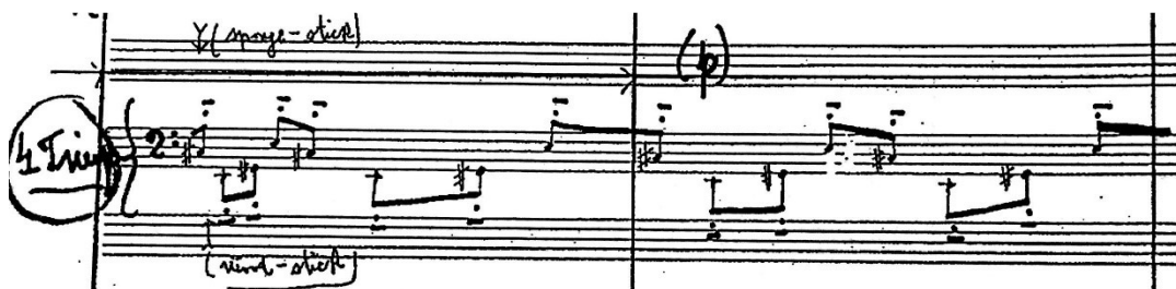
Slika 5 Papandopulov rukopis (iz partiture) - druga strana