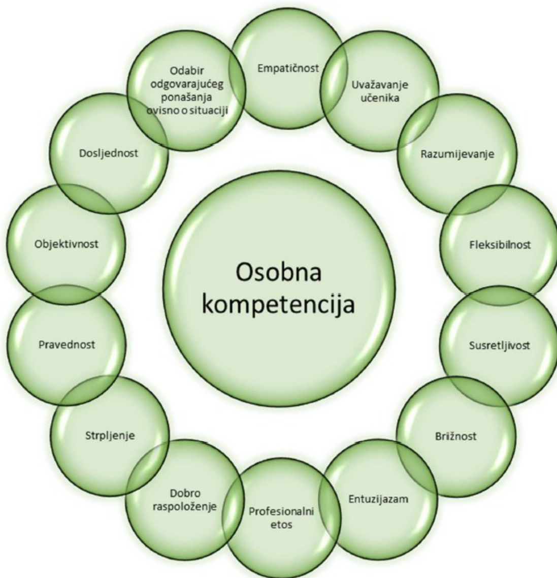
Slika 5.3.2.b Temeljni činitelji osobne kompetencije učitelja. 39