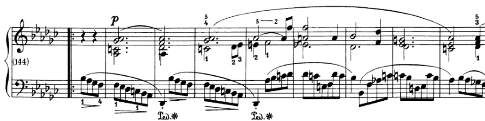
Slika 4.3.i. Središnji dio

Taktovi 91 i 92 služe kao proširenje i trebali bi biti odsvirani mirno i prigušeno. Sljedeća rečenica je zapisana u b-molu, atmosfera je mračnija, i stoga bi zvučno trebala biti odsvirana intenzivnije u odnosu na početnu. Sljedeća rečenica je ponovljena prva. Perioda koja slijedi unosi nakratko veseliju atmosferu na koju se nastavlja rečenica materijala a koja bi ovaj put mogla nastaviti taj karakter i biti odsvirana zanosnim i punim zvukom za razliku od prva dva puta. Sljedeća rečenica je opet molska, ovaj put u as-molu, te bi ovaj put mogla biti odsvirana sjetno i blago za razliku od prvog puta. Prijelazna rečenica (t.137-144) donosi novu energiju i svjetlinu i tako najavljuje novi materijal i središnji dio "B" dijela. Lijeva ruka iznosi zasebnu melodiju koja ima veliku ulogu u karakteru. Silazni nizovi tonova u prva četiri takta unose blagi nemir u poprilično mirno kretanje glasova desne ruke. Nemir se povećava u sljedećim taktovima kada melodijsko kretanje lijeve ruke ide naizmjenično gore, pa dolje, dok desna ruka to prati harmonijskom napetošću dominantni koje se rješavaju u tonike. Svi glasovi vode do zajedničkog dinamičkog vrhunca u t.149 nakon kojeg slijedi smirenje i završetak prve rečenice.