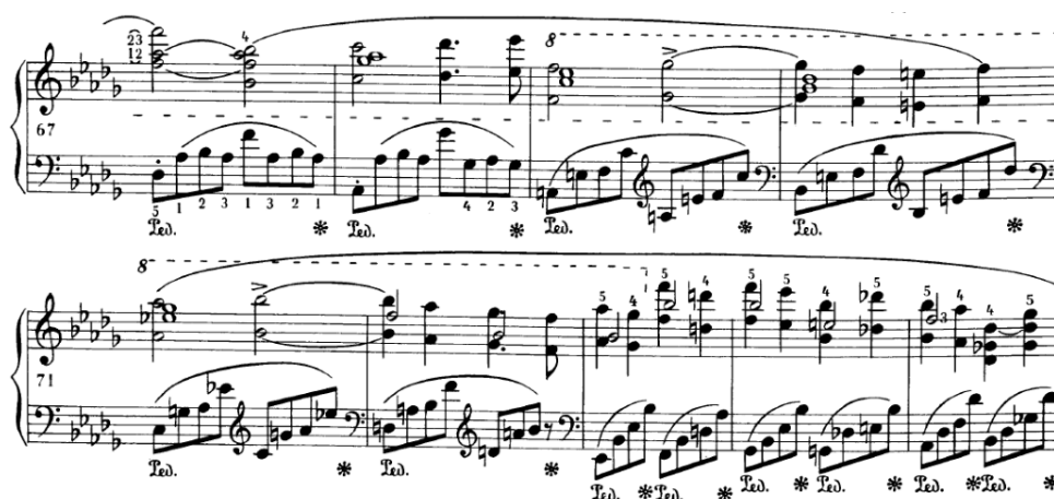
Slika 4.2.b. Legato oktave, desna ruka

Sličan tehnički problem je sviranje legato oktava u taktovima 65-79. U taktovima 65-72 legato se prilikom melodijskog pomaka od sekunde postiže supstitucijom 4. i 5. prsta, dok u donjem glasu palac kliže od tipke do tipke. Klizanje palca težak je tehnički zadatak i "zahtijeva pokretljivost, lakoću i fleksibilnost palca." Iznimno je bitno da se palac premjesti na drugu tipku u najkasnijem trenutku jer je time prekid između dva tona manje primjetan. Također prilikom sviranja zglob treba sudjelovati tako da se podiže i zamahuje neposredno prije nove oktave, a tonovi nastaju tijekom njegova spuštanja. 15