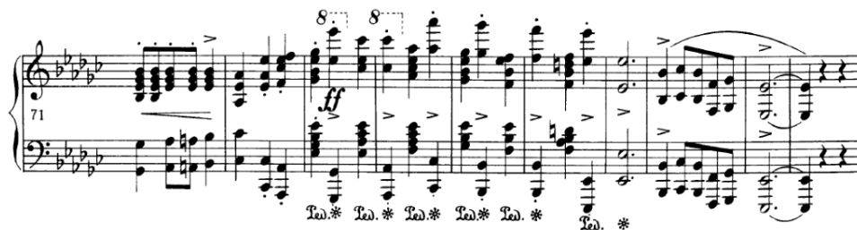
Slika 4.2.d. Skokovi u protupomaku

Posebno treba istaknuti i skokove na kraju "A" dijela i na samom kraju stavka. Istaknuti skokovi su teški zbog brzog tempa i zbog toga što lijeva i desna ruka skaču u protupomaku. Prema Zlataru, pri skoku potrebno je obratiti pozornost na 3 komponente: tonska predodžba, vizualna priprema, pokret ruke. Za postizanje tonske predodžbe potrebno je zamisliti željeni zvuk jer se tako dolazi do najadekvatnijeg pokreta, za vizualnu pripremu važno je imati percepciju klavijature, tj. osjećaj do kojeg točno mjesta ruka skače; i za posljednju komponentu potrebno je ostvariti pokret ruke u obliku luka koji je naravno manji u brzom tempu, kakav je ovdje slučaj, i biti jako blizu tipkama. 22