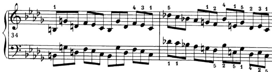
Slika 4.3.p. Vrhunac drugog dijela

U t.17 ljestvični nizovi kreću iz p dinamike u laganom crescendo do sljedećeg takta koji je već u mp dinamici. Sljedeći dvotakt prati istu dinamiku te se kreće u crescendo prema t.21 u kojem dolazi do intonativnog i dinamičkog spuštanja prije novog velikog crescenda u t.23 na uzlaznom nizu koji priprema nastup druge teme i prvi svijetli durski trenutak stavka. Taktovi 25 i 26 kreću se u decrescendu do ponovnog velikog crescenda u t.27, nakon kojeg se tema ponavlja za oktavu više. Sljedeći dvotakt unosi veliku napetost u melodijskoj kretnji koja počinje na drugoj dobi prvog takta te se ponavlja kroz obje dobe sljedećeg takta. Ona donosi crescendo koji vodi do sljedećeg dvotakta koji je ponovljen za m2 više. Vrhunac kretnji je na prvoj dobi u t.35 na noti des2-des1 koju je dozvoljeno odsvirati s tenutom .