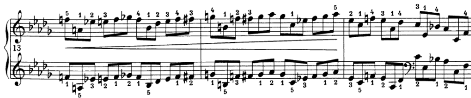
Slika 4.3.o. Jedini zapisani crescendo

dobama na krajevima dvotakta. Veliki crescendo u t.13 i 14 vodi do vrhunca u taktu 15 čija se dinamika sekventnim spuštanjem u sljedećem taktu utišava.