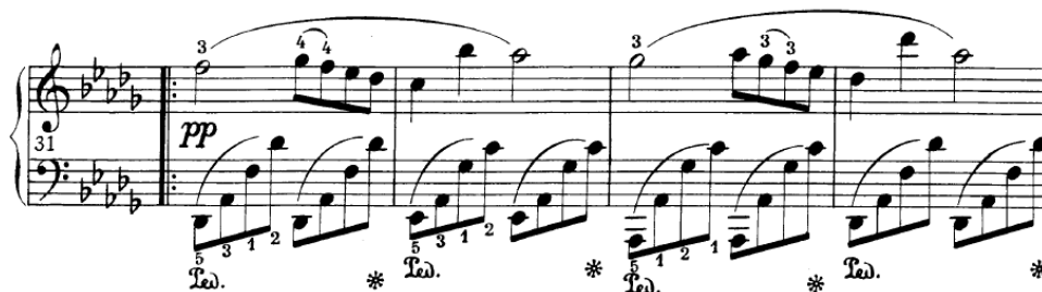
Slika 4.3.m. Početak "B" dijela

Drugi dio unosi potpuni kontrast u stavak. Moglo bi se reći da je Chopin ubacio nocturno unutar marša. Ovaj dio ne trpi preveliko muziciranje. Trebao bi se svirati jednostavno, bez agogičkih odstupanja. Najveća pozornost bi trebala biti na kvaliteti tona i njegovoj boji koja mora biti obla, baršunasta i mekana. Treba napomenuti kako postojanje boje klavirskog tona nije znanstveno dokazano, ali ona zasigurno postoji u "zvučnoj mašti izvođača i slušatelja." 34 Dinamički raspon trebao bi ostati u okvirima pp-mf . Chopinov klizni prstomet koji se pojavljuje u desnoj ruci daje do znanja na koji bi se način zvukovno trebale povezati te melodijske linije. Tonovi se trebaju prelijevati jedan u drugi. Isto vrijedi i za skokove u t.32 i t.34, gdje nema potrebe za isticanjem tih velikih intervalskih pomaka. Prvi dvotakt zapisan je u pp dinamici. U variranom dvotaktu nije potrebno pojačavati dinamiku nego bi najbolje bilo svirati ga svjetlijom bojom, iako se intonativno penje i po logici klavirske interpretacije bi se trebao svirati glasnije. Lijeva ruka treba biti svirana leggatissimo iznimno ujednačenim zvukom.