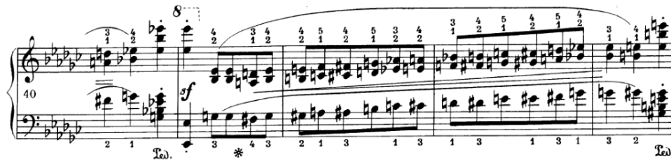
Slika 4.3.g. Kromatske kvarte i skokovi

i dvoglasni trebaju zvučati lagano i poletno i ne smiju biti svirani s osjećajem težine. Jedina iznimka su dvohvati i akordi obilježeni akcentom. Tempo ne treba biti prebrz, iako ga mnogi izvođači imaju. Drugi dio prvog dijela obilježen je uzlaznim ljestvicama u kvartama. Dvohvati u ljestvicama također trebaju biti odsvirani lagano leggero do svojih vrhunaca u t.41 i t.45. Prije sviranja akorada Es-dura i E-dura, nakon kojih slijedi skok, većina izvođača uzme kratak dah, to jest minimalno zakasne.