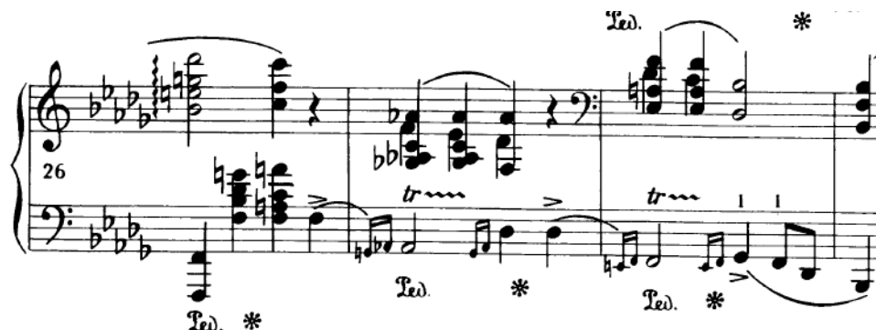
Slika 4.2.e. Trileri u lijevoj ruci

U prvom dijelu prvog dijela u t.11 i 12 desna ruka svira legato oktave. Iako su povezane na jednom pedalu u taktu, potrebno ih je također povezati i prstima zbog bolje tonske povezanosti koja je spominjana u prvom stavku. U drugom dijelu prvog dijela, u t.15 desna ruka svira naizmjenično legato akorde i oktave. U sljedećem taktu i lijeva i desna ruka sviraju legato akorde. Kao što je već rečeno, prilikom sviranja bitno je zadržati opušten zglob koji uz aktivne prste laganim zamahom ostvaruje legato . 24 U t.19 i 20 lijeva ruka izvodi trilere. Triler se izvodi različitim prstometima zavisno o situaciji, pa se tako "može izvoditi susjednim prstima te njihovim mijenjanjem ili 'preskakanjem'." 25 U ovom slučaju zapisan je prstomet susjednih prstiju, pomoću kojeg se ostvaruje iznimno brz i gust triler. Vježbati se može u sporijem tempu, prilikom kojega se izvježbavaju prsti i korištenje blage rotacije ručnog zgloba koja pomaže lakšem izvođenju. 26