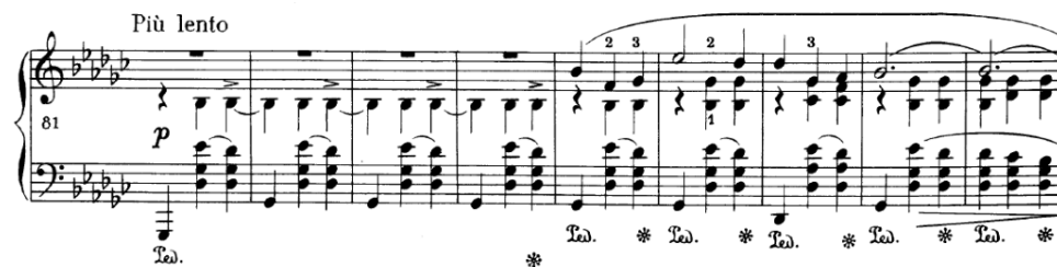
Slika 4.3.h. Uvod i prva rečenica "B" dijela

Taktovi 91 i 92 služe kao proširenje i trebali bi biti odsvirani mirno i prigušeno. Sljedeća rečenica je zapisana u b-molu, atmosfera je mračnija, i stoga bi zvučno trebala biti odsvirana intenzivnije u odnosu na početnu. Sljedeća rečenica je ponovljena prva. Perioda koja slijedi unosi nakratko veseliju atmosferu na koju se nastavlja rečenica materijala a koja bi ovaj put mogla nastaviti taj karakter i biti odsvirana zanosnim i punim zvukom za razliku od prva dva puta. Sljedeća rečenica je opet molska, ovaj put u as-molu, te bi ovaj put mogla biti odsvirana sjetno i blago za razliku od prvog puta. Prijelazna rečenica (t.137-144) donosi novu energiju i svjetlinu i tako najavljuje novi materijal i središnji dio "B" dijela. Lijeva ruka iznosi zasebnu melodiju koja ima veliku ulogu u karakteru. Silazni nizovi tonova u prva četiri takta unose blagi nemir u poprilično mirno kretanje glasova desne ruke. Nemir se povećava u sljedećim taktovima kada melodijsko kretanje lijeve ruke ide naizmjenično gore, pa dolje, dok desna ruka to prati harmonijskom napetošću dominantni koje se rješavaju u tonike. Svi glasovi vode do zajedničkog dinamičkog vrhunca u t.149 nakon kojeg slijedi smirenje i završetak prve rečenice.