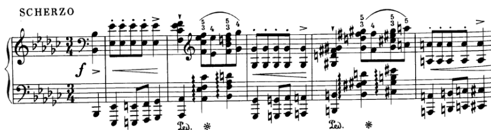
Slika 4.3.e. Prva rečenica

Stavak sadrži dva kontrastna dijela: vatreni scherzo A dijela te sentimentalnog valcera u B dijelu. Iako je na samom početku naznačena dinamička oznaka f , to ne treba shvatiti doslovno. Kako prva rečenica protiče u penjanju, dinamičkom i intonativnom, nakon predtakta oktave B-b koja je akcentirana, pijanisti najčešće u prvom taktu krenu iz dinamike piano zbog lakše gradacije koja slijedi. Ako bi se ova situacija mogla shematski opisati onda bi to bilo ovako: prvi dvotakt piano s crescendom u mf (t.1-2), drugi dvotakt kreće iz mp s crescendom u f (t.3-4), te rečenica koja kreće mf uz veliki crescendo prema svojem kraju u ff (t.5-8).