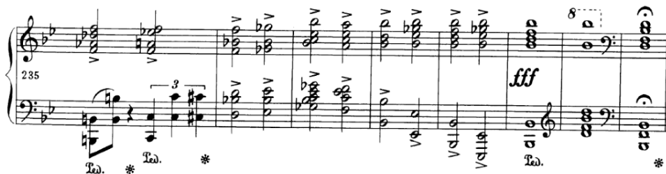
Slika 4.3.d. Završetak prvog stavka

U codi koja je zapisana nakon ff izvođač treba ekonomično rasporediti zvuk tako da se cijelom njenom dužinom zvuk kreće u crescendu do završnih akorada fff .