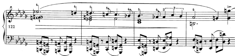
Slika 4.2.c. Legato oktave, lijeva ruka

Iznimno je važno izvježbavati legato oktave i ne povezivati ih isključivo pedalom, jer ako su one u konačnici povezane samo s pedalom, neće nastati ista kvaliteta zvuka kao kad su povezane prstima. 16 To bi naročito došlo do izražaja u provedbi u taktovima 122-125 kao i 130-133. Pedalizacija koja bi bila podređena postizanju legato oktava nije moguća, jer bi se time narušila melodijska linija zapisana u desnoj ruci.