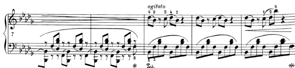
Slika 4.2.a. Široka rastvorba lijeve ruke

U taktovima 9-11 lijeva ruka svira rastvorbu b-mola, B-f(b-des1)-f . Izvođač se u ovom slučaju može služiti tehnikom rotacije tako da zamisli da je nota f os rotacije oko koje rotiraju peti prsti na noti B i palac i drugi prst u dvohvatu b-des1 .