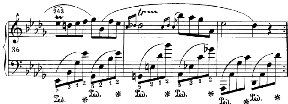
Slika 4.2.f. Praler i triler u desnoj ruci