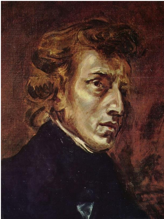
Ferdinand Victor Eugène Delacroix, Portrait de Chopin (1838)

Frédéric François Chopin ( Fryderyk Franciszek Chopin na poljskom) je prvi veliki poljski skladatelj i pijanist te jedna od najistaknutijih glazbenih ličnosti ranog romantizma u Poljskoj i Europi. Poseban je po tome što je gotovo cijeli svoj stvaralački opus posvetio jednom instrumentu: klaviru.