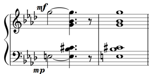
primjer 14: vježbanje izvođenja tona istodobno različitom dinamičkom nijansom

Htjela bih spomenuti kako sam riješila problem izvođenja istodobno tri ili četiri različite dinamičke nijanse, odnosno isticanja glasova po vertikali. Prvo sviram i držim notu iz akorda koji bih htjela izvesti najjasnije u dinamici koju želim svirati, onda kasnije dodajem ostale tonove u istoj dinamici u kojoj je prvi ton izveden u tom trenutku. Kada shvatim kolika težina i snaga je potrebna svakom prstu, istodobno maknem sve note i sviram akorde zajedno kako piše u notama. Osobito sam ovom vježbom riješila problematiku izvođenja druge teme. Uz ove vježbe potrebno je uvijek paziti da svi tonovi zvuče unutar zadane dinamike.