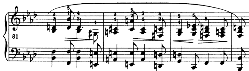
primjer 15: druga tema u t. 81-84

Druga tema sastoji se od punktiranih figura koja je prožeta karakterom barcarole .