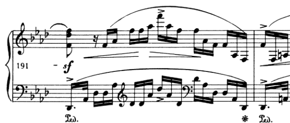
primjer 20: t. 191

Pauza vrlo često odvaja fraze, ali uvijek je potrebno razmisliti nije li u srednji fraze. Kod mnogih izvedbi pauza se žrtvuje na način da je se prekrije pedalom, bez razmišljanja, pogotovo kad se izvode skladbe romantizma. Bilo bi poželjno razmotriti značenje i funkciju pauze koje je odredio skladatelj.