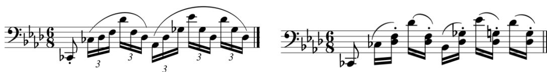
primjer 8: vježbanje pratnje po pozicijama (t. 181)

Rastovorba se treba razdijeliti po kretanjima ruke. Na primjeru (primjer 8), u ovom slučaju, svake tri šesnaestinke odsviraju se kao brza triola, a na zadnju šesnaestinku se zastane i opusti ruka. Radi učvršćivanja pozicija, trebalo bi rastvorbu prilikom vježbanja razdijeliti po ovim pozicijama: