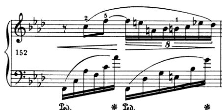
primjer 7: t. 152

Vježba koja je meni iznimno pomogla u opuštanju ruke je vježba u obliku arpeggia.