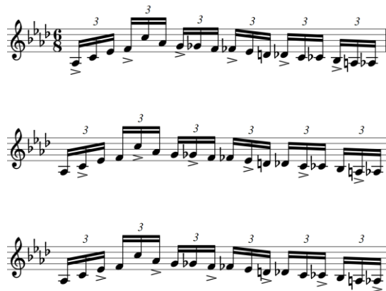
primjer 16: vježba za neovisnost prstiju

Pretpostavljam da mnogi učenici i studenti vježbaju pasaže različitim ritmovima kako bi sve šesnaestinke bile ujednačene. Preporučam ovu vježbu za neovisnost prstiju, na primjeru kromatike u taktu 167. (primjer 16);