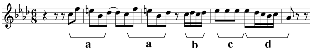
primjer 1: prva tema (t. 8-12)

Nakon uvoda, pojavljuje se prva tema koja je građena od periode (4 + 4) i proširenja (2 + 2 + 2). Tema je modulativnog karaktera, prva rečenica modulira u medijantni As-dur, a druga u b-mol u kojem se odvija i treća. Prva tema je sastavljena od četiri motiva;