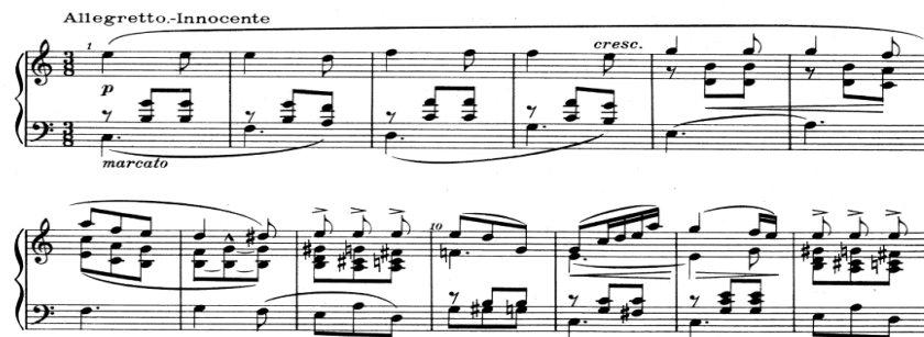
Slika 2 Notni zapis skladbe Nevinnost , taktovi 1-13