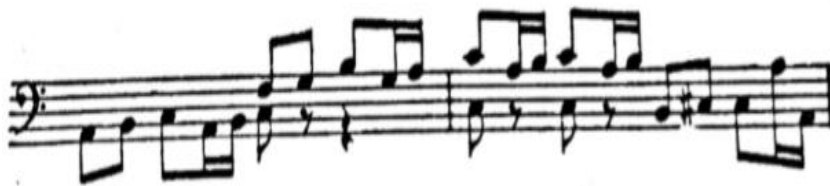
Slika 12 Notni zapis opere Viola, taktovi 364-365

Nakon pogoršanja zdravstvenoga stanja 1883. godine gubitak pamćenja utjecao je na Smetanin rad te nije bio u stanju dovršiti operu. Posljednju misao Smetana je skladao u siječnju 1884. godine nakon toga dana više nije skladao te je tako došao kraj njegove skladateljske karijere.