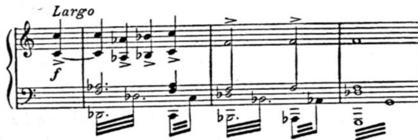
Slika 10 Notni zapis opere Tajna, taktovi 1-4