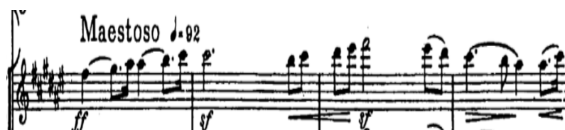
Slika 6 Notni zapis opere Dalibor, taktovi 541-544

Smetana uz pomoć glazbe ocrta karakter likova što je vidljivo u prikazu glavnoga lika Dalibora. Odmah na početku opere u tempu Largo maestoso u tonalitetu g-mola naznačuje tužnu sudbinu junaka dok se u tonalitetu Fis-dura u odsjeku Maestoso ocrta smirenost glavnog lika prilikom izlaska pred sud. Opera stilom i modernom orkestracijom ponovno teži Wagneru iako je radnja vrlo slična operi Fidelio zbog psihološkog prikaza likova. Skladba je u stilskome smislu bila vrlo moderna te je dugi niz godina bila neshvaćena i oko nje su se vodile razne polemike, no smatra se prekretnicom u prihvaćanju novoga modernoga stila u češkoj glazbi od kojega Smetana nije odustajao te je smatrao kako glazba mora težiti napretku i prihvaćanju novih suvremenih stilova.