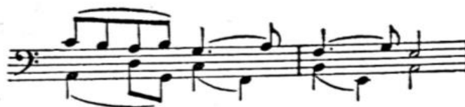
Slika 11 Motiv Kaline iz opere Tajna, taktovi 100-101