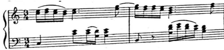
Slika 9 Motiv gubitka sluha iz opere Poljubac

Opera je komponiran kao jedna cjelina dok je podjela u dva čina dekoracijske, a ne glazbene funkcije. Uvertira uvodi u raspoloženje opere a sadržajno je jednaka finalu zboru. Smetanine tradicijske pjesme kao uspavanke Hajej můj andilku i pjesme Skřivánčí píseň donose operi nacionalne elemente no najveće postignuće je uspavanka Letěla bělouňka holubička koja je postigla veliki uspjeh te se danas smatra pučkom pjesmom. Uvertira je skladana od motiva iz opere a ostavlja dojam simfonijske strukture.