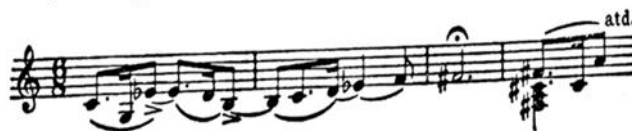
Slika 7 Primjer modulacije iz opere Libuše

(Libušina sudbina) nastale 1869. godine i klavirske skladbe Lístek do památníku u G-duru iz 1848. godine. Poznato je već kako se Smetana nije volio držati strogih harmonijskih pravila što u ovoj operi dolazi do izražaja u korištenju neakordičkih tonova ili modulacijama iz c-mola u fis- mol tako što melodija postupno dosegne ton fis te se zadrži na njemu toliko dugo da slušatelj zaboravi na prethodni tonalitet te od toga tona dalje nastavi melodiju u novom tonalitetu.