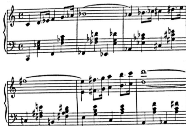
Slika 5 Prva verzija osnovnog motiva opere Dalibor , taktovi 16-21

Za vrijeme skladanja Prodane nevjeste i još uvijek neizvedene opere Braniboři v Čechách (Branibori u Češkoj) Smetana sklada svoju treću operu Dalibor . Libreto za operu u tri čina napisao je na njemačkom jeziku Josef Wenzig dok je za prijevod na češki jezik zaslužan Ervín Špindler. Osnovni motiv opere nastao je 13. svibnja 1863. godine svega dan ranije od dueta iz njegove prethodne opere.