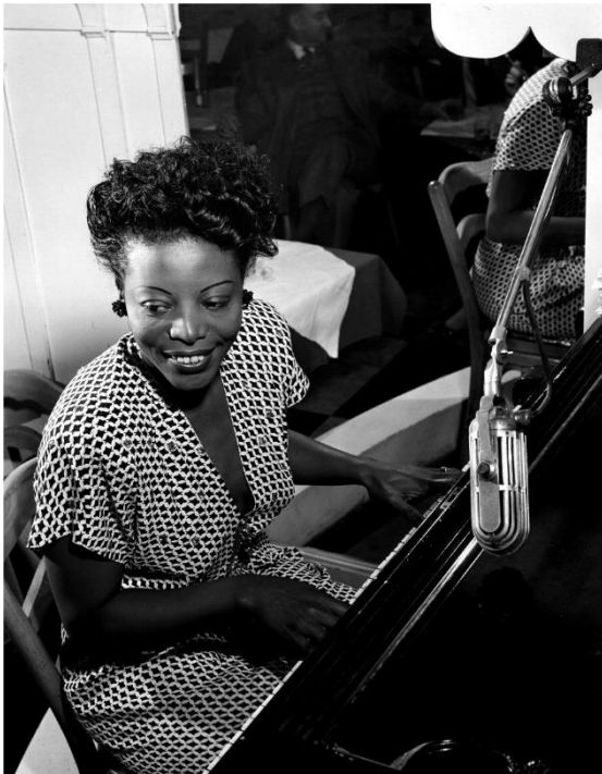
Mary Lou Williams

https://en.wikipedia.org/wiki/Mary_Lou_Williams