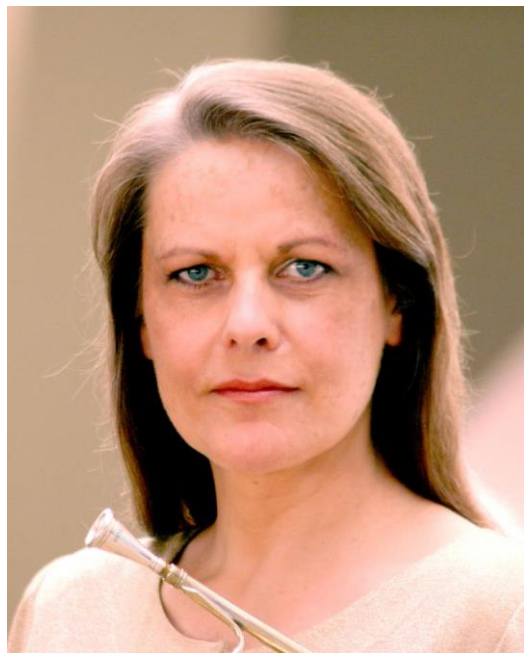
Slika 5 (Marie Luise Neunecker)

Marie Luise Neunecker, cijenjena zbog svog nesvakidašnjeg talenta i virtuoznosti, široko je priznata kao jedna od vodećih i najznačajnijih hornistica današnjice. Tijekom svog djelovanja uspjela je izgraditi uspješnu međunarodnu karijeru te je poznata kao jedna od najtraženijih solista i komornih glazbenika.