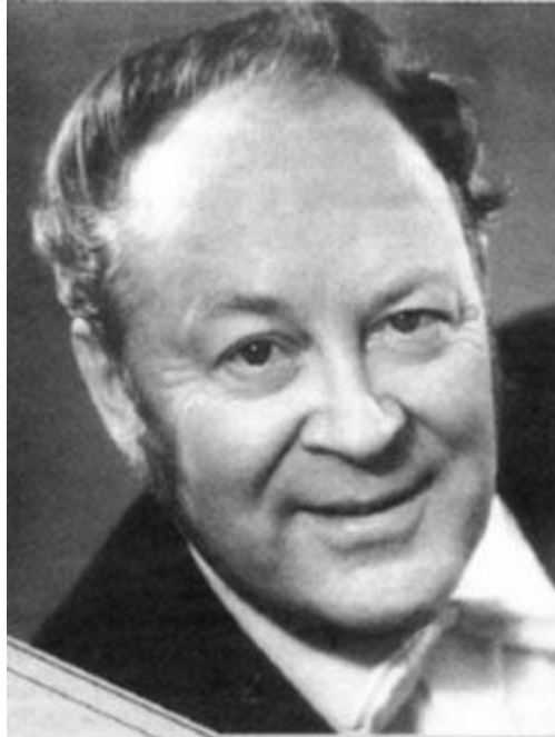
Slika 4 (Valery Polekh)

Valery Vladimirovič Polek bio je među vodećim sovjetskim hornistima i glazbenim pedagozima. Ostao je zapamćen kao jedan od glazbenika zaslužnih za razvoj sovjetskog orkestralnog i solističkog muziciranja, autor značajnih komada i etida za rog te vrsni interpretator hornističkih minijatura.