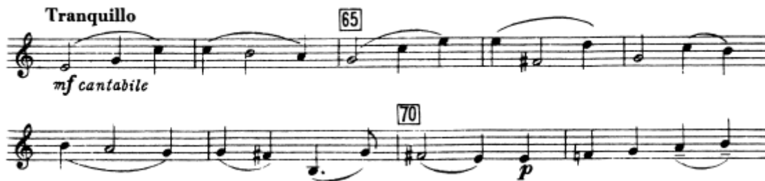
Notni primjer 2 (početak druge teme)

prve u drugu temu sonatnog oblika. Motiv uskoro preuzima fagot, a zatim i klarinet. Njihovo izmjenjivanje počinju oponašati flauta i violine. Violine na kraju smiruju uzburkani slijed modulacija na septimi F-dura dok duboki gudači uz zaostali marševski ugođaj s početka skladbe uvode slušatelja u drugu temu.