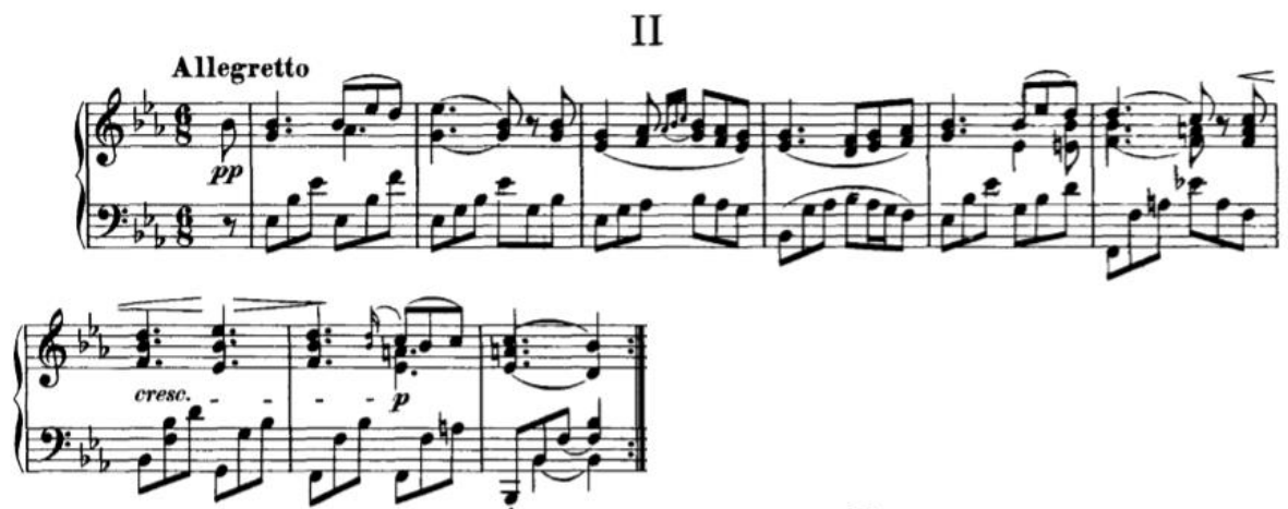
Slika 3.2.a, taktovi 1-9

Drugi klavirski komad pisan je u rondo formi, A-B-A-C-A . Možemo reći da je ovaj komad centar ovog ciklusa jer se karakterno posve razlikuje, donosi lirsku i osjećajnu dimenziju u kojoj Schubert slušatelju vjerojatno najiskrenije pokazuje sva svoja stanja i promjene. Stavak počinje cantabile Es-dur melodijom, koja unosi mir i sklad, no vrlo ubrzo se tu miješa c-mol, as-mol kao i h-mol dijelovi koji, svaki put kada nastupaju, šalju posve drugačiju poruku. A dio pisan je većinskim dijelom u p dinamici, što znači da je vladanje tonom ovdje poprilično delikatno. U lijevoj ruci je harmonijska pratnja u obliku rastavljenih akorada, dok je u desnoj glavna melodija u obliku terci i seksti. Iako je očito da treba naglasiti gornju liniju pošto je ona prirodno dominantnija, ne treba zaboraviti na drugi glas koji također ima bitnu ulogu. Štoviše, ako pogledamo dionicu desne ruke, dobijemo vrlo jasno zbarsko dvoglasje tj. mjestimično troglasje.