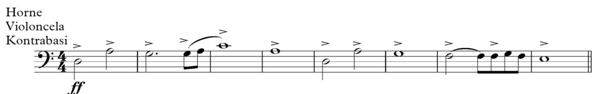
Primjer 9: Gondor u propadanju