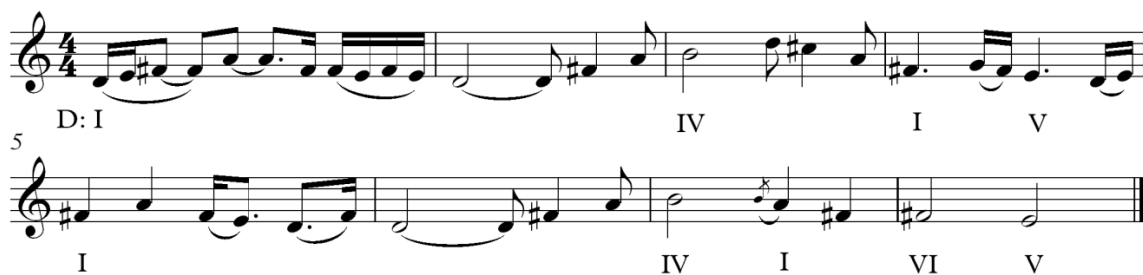
Primjer 5: Sjetna varijacija

Instrumentacija ne služi samo kao kulturni marker za keltsku tradiciju. Kada analiziramo temu Shirea u Pensive setting odmah primijetimo prisutnost pentatoničkih nijansi, iako tonovi cis 2 i g1 ukazuju na to da ne postoji čista pentatonika. Osnovna skala može se smatrati heksatoničkom, budući da je cis 2 relativno istaknuta nota unutar melodije, dok je g1 samo dio ukrasa. Često se škotske i irske melodije i pjesme oslanjaju na pentatoničke, ali i heksatoničke skale.