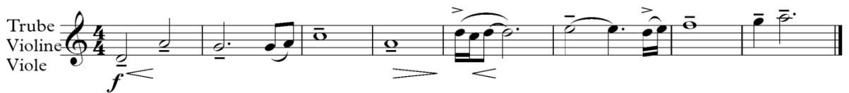
Primjer 10: Gondor u uspinjanju

Prva četiri takta su ista kao u originalnoj temi, dok sljedeća četiri uključuju motiv družine te postepeno uzlazno kretanje, što simbolizira pobjedu Gondora. Ova varijacija se razlikuje od Gondora u propadanju , gdje melodija silazi, što prikazuje propadanje kraljevstva.