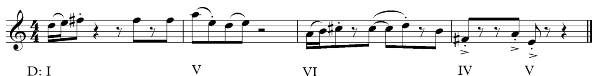
Primjer 6: Seoska varijacija

Seoska varijacija sastoji se od dva dvotakta, pri čemu svaki započinje prepoznatljivim motivom glavne teme, s time da se u drugom dijelu motiv pojavljuje za kvartu niže. Pauze u ovoj varijaciji stvaraju plesni, ritmički element i doprinose veselom ugođaju, dok se uz osnovne harmonije I, IV i V stupnja pojavljuje i VI stupanj, što dodatno obogaćuje harmonijsku strukturu.