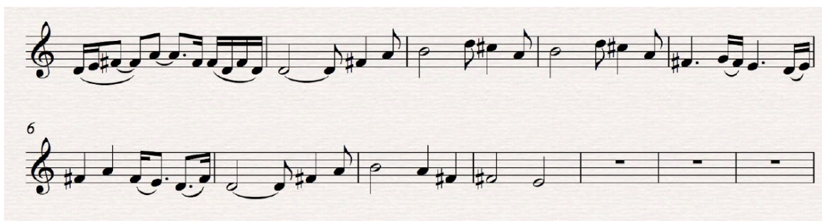
Primjer 4: U snovima

Tema, napisana u D-duru, sastoji se od dvije jednostavne rečenice, pri čemu prva završava na petom stupnju te čine periodu. Melodija se razvija prema vrhuncu, dok su harmonije jednostavne, s osnovnim akordima I, IV, V i III stupnja. Prvo ju izvode gudači, a kasnije im se pridružuje dječjački solo glas uz povremenu pratnju zbora