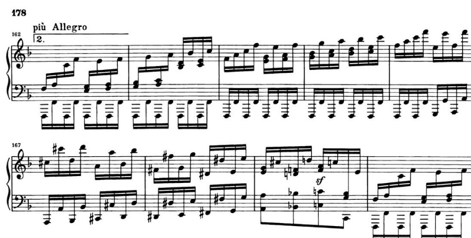
slika 4.3.2: početak code drugog stavka

šesnaestinke u akordima dominantnog septakorda i toničkog kvartsekstakorda na tonu c donje dionice nakon kojeg u osminkama dolazi motiv od tri tona des-h-c kojeg je ranije ocrtavala gornja dionica s gornjim glasom u taktu 137 i analogijski istim taktovima kasnije (ako gornju dionicu opet shvatimo kao latentno dvoglasje). Zatim dolaze četiri takta (2+2) sa skraćanim motivom s tri note na samo dvije. U taktovima 156-157 to su des-h, a u taktovima 158-159 c-h. Zadnja dva takta reprize čine dominantni sekundakord u F-duru s trilerom u donjoj dionici na tonu b nakon čega slijedi ponavljanje cijele provedbe i reprize ili coda . Taj triler na tonu b na sličan način pokušava pripremiti provedbu kao onaj iz takta 20.