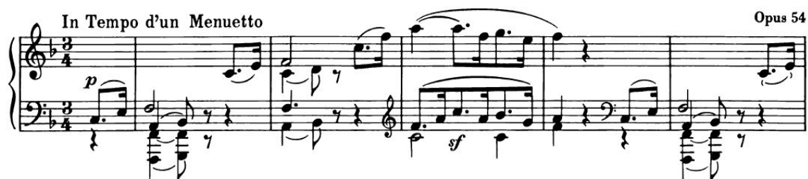
Slika 4.2.1: početak prvog stavka

Stavak započinje predtaktom u trajanju jedne četvrtinke s motivom punktiranog ritma u uzlaznom kretanju što predstavlja glavni motiv A dijela. Prvi A dio obuhvaća taktove 1-24.