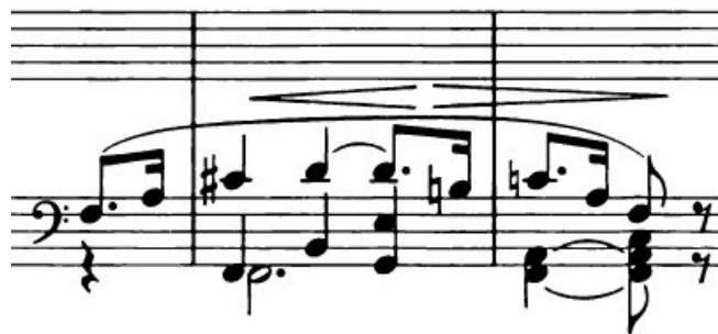
slika 4.2.2: taktovi 8-10

tadašnjem je klaviru najdublji ton bio upravo 1F). Također, s harmonijskog aspekta u predtaktu možemo zamisliti V. stupanj koji se na prvu dobu prvog takta riješi u I. stupanj. Zatim se svakim ponavljanjem tog motiva bas postepeno kreće uzlazno (f-g-a-b-c) i čini redom sljedeće harmonijske strukture: I - II7 - I6 - IV – V6/4-7 nakon čega slijedi savršena kadenca. Cijela je rečenica u F-duru bez ijednog ne pripadajućeg tona. Ta je rečenica zatim doslovno ponovljena.