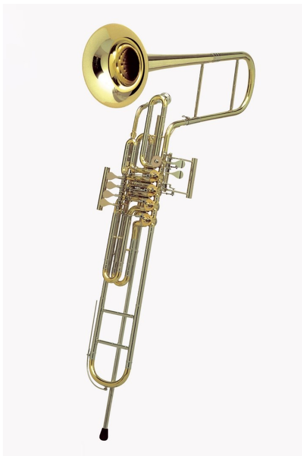
Slika 6: Moderni cimbasso

Cimbasso je instrument koji je označen kao najdublji instrument u Verdijevim skladbama. Cimbasso kojeg je zahtijevao Verdi u svojim ranim operama je vjerojatno bio ofikleida s ventilima, kakvu su u to vrijeme proizvodili Appariti Uhlmann (Meucci 2001). Današnja verzija tog instrumenta je cilindričnog oblika, napravljena od mjedi, ima 4 do 6 rotaciona ventila i zvono okrenuto prema naprijed. Ove osobine instrumenta bliže su instrumentima srodnim trombonu nego tubi, međutim cimbasso uvijek svira tubist zbog veličine usnika i prstomete koji su isti kao na koncertnoj F tubi. Uspoređujući sviranje tube i cimbassa , treba zaključiti da je sviranje cimbassa zahtjevnije, jer iako je intonacija na pedalnim tonovima korektna, u višem registru varira, a artikulacija nije čista kao na koncertnoj tubi.