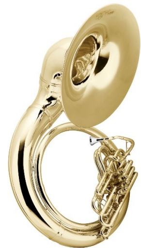
Slika 5: Moderni suzafon