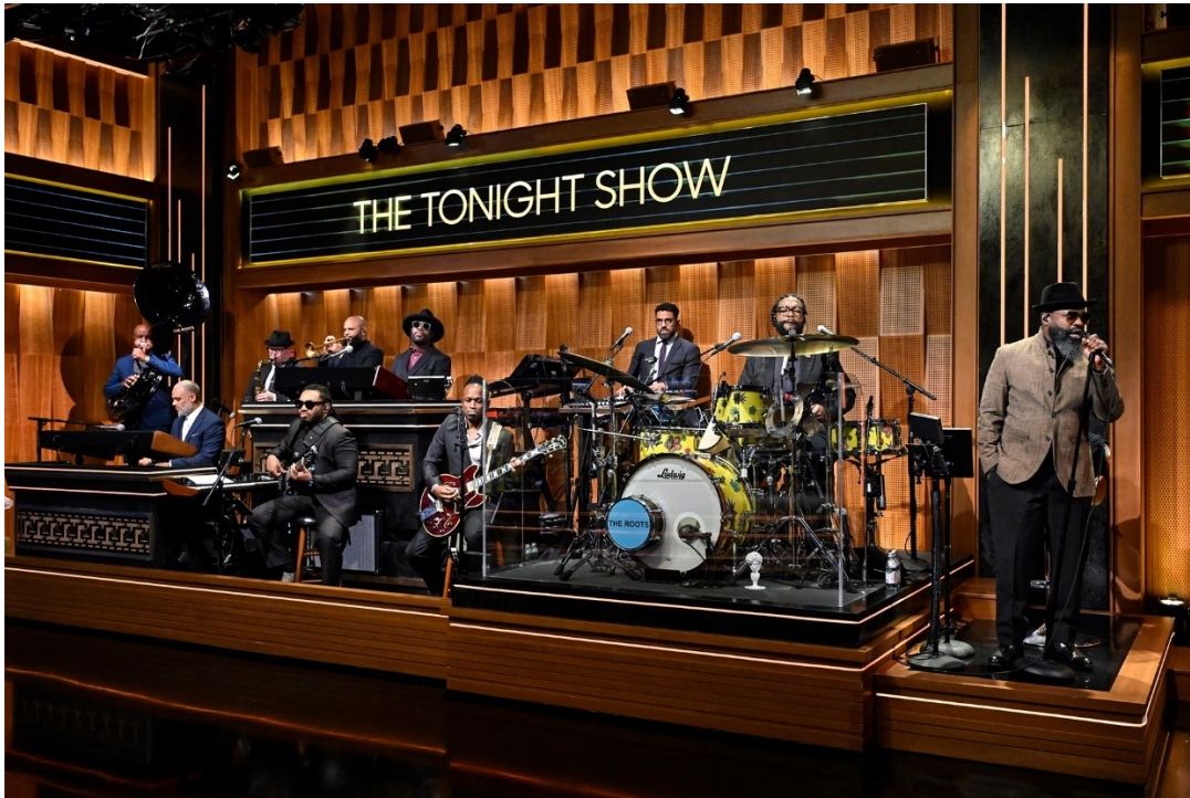
Slika 10: The Roots sastav u emisiji The Tonight Show Starring Jimmy Fallon

koji su uzeli oblik limene glazbe iz New Orleansa i na originalan način pretvorili u punk , hip-hop sastav. Većina bendova u kojem su mlađi svirači, održavaju svoju karijeru turnejama, dok tradicionalni bendovi sviraju na pogrebima i nekim manjim događajima (John Joyce 2024).