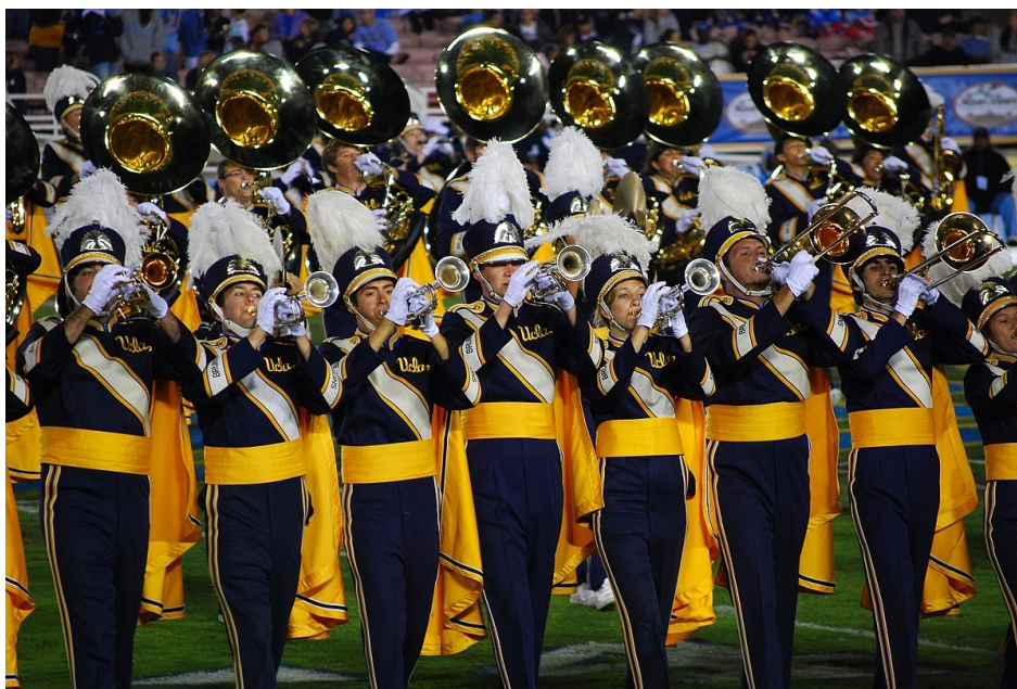
Slika 9: prikaz UCLA, Bruin Marching banda dok sviraju na nogometnom terenu