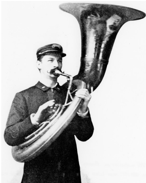
Slika 4: Prvi konstruirani suzafon sa zvonom okrenutim prema gore

mesinga, ali zbog velike težine, proizvođači su ga počeli izrađivati od stakloplastike. Većina modernih suzafona je po nazivu B, ali ugođena u C. Suzafon nije transponirajući instrument, kao ni tuba ako je dionica napisana u bas ključu. Iako ima ograničeni raspon u odnosu na tubu jer većina suzafona ima 3 ventila umjesto 4 zbog smanjenja težine instrumenta, generalno sviraju istu glazbu. Dakle, sve tube su ugođene u C, ali ima više vrsta tuba koje su dobile naziv prema tonu od kojeg počinje alikvotni niz, to su B, C, F i Es (P. E. Bierley 2001).