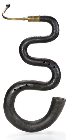
Slika 1: Serpent.

Razvoj tube pratio je instrumente kao što su truba i francuski rog, kada je početkom 19. stoljeća izumljen prototip ventila c. Sve do nastanka tube, basovska dionica limene sekcije je najčešće bio serpent ili ofikleida. Serpent je prvobitno izrađen od cijevi koničnog oblika, dugih otprilike 213 cm, s 6 rupa. U početku nije postojao jasan način držanja serpenta, ali Abbé Lunel je osmislio dijagonalni način držanja (Bevan, 1978).