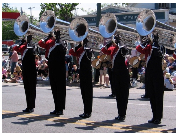
Slika 7: Članovi Brigadiers Drum & Bugle Corps sa marširajućim tubama

Marširajuća tuba ili contrabass bugle je preinaka i zamjena za koncertnu tubu koja se koristi u marching bandovima . Prvu marširajuću tubu je konstruirao Whaley Royce oko 1960. godine. Najčešće se koriste varijante B, C i G tube koje su također ugođene u C kao i sve tube. Konstrukcija marširajuće tube je slična koncertnoj tubi. Razlika je u tome što je na koncertnoj tubi cijev u koju se stavlja usnik zaokrenuta oko zvona instrumenta, a na marširajućoj tubi je ta cijev zaokrenuta prema dolje. Taj oblik omogućuje da se tuba postavlja na sviračevo lijevo ili desno rame, ovisno o konstrukciji tube (Pirtle 2010).