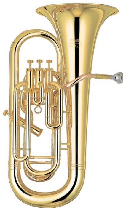
Slika 8: Eufonij

Od sola za eufonij s orkestrom ili nekim drugim sastavom, ističu se Koncert za eufonij i puhački orkestar od skladatelja Josepha Horovitza (1972) te Diran op .94 (1951) koncert za eufonij i gudački orkestar od skladatelja Alana Hovhanessa (Bevan, 2001).