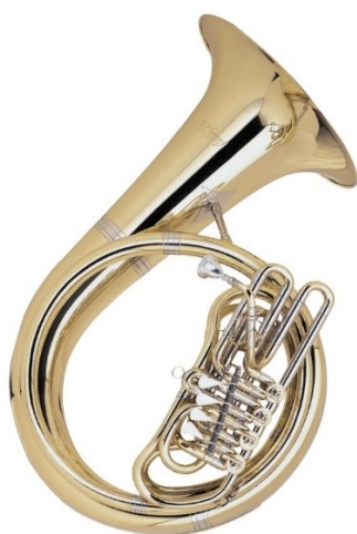
Slika 3: Moderni helikon marke Červený

Helikon ima zvono koje je usmjereno prema naprijed, a cijev okružuje tijelo svirača. Prolazi ispod desne ruke i oslanja se na lijevo rame. Stoga ga svirač može nositi dulje vrijeme, naročito kod marširanja. Instrument je konstruiran slično kao i suzafon, ali ima manje zvono. Helikon je proizveo Ignaz Stowasser u Beču 1845. godine. Od tad se počeo proizvoditi diljem Amerike i Europe (Bevan, 1978).