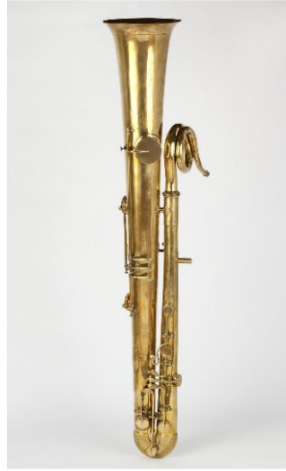
Slika 2: Ofikleida.

Tuba je među limenim puhačima najdublji instrument. Najnoviji je dodatak modernom simfonijskom orkestru. Odak u svojoj knjizi navodi da "Tuba pripada rodu rogova, s kojima se bolje stapa nego s trombonima" (1997, str. 165). Smatra se da je razlog tome što tuba i rog dijele slične karakteristike, kao što je upotreba ventila i duboki raspon instrumenta. Današnja tuba ima približno isti oblik kakav je imala prva tuba konstruirana 1835. godine u Berlinu. Wilhem Wieprecht i Johann Gottfried Moritz graditelji su instrumenata i zaslužni za prvu konstruiranu tubu. Tubisti najčešće postižu raspon od skoro 4 oktave i to od B2 do a1, međutim to nije strogo definirano. Ovisno o mogućnostima glazbenika, tuba može proizvesti dublje, a i više tonove (Bevan, 1978).