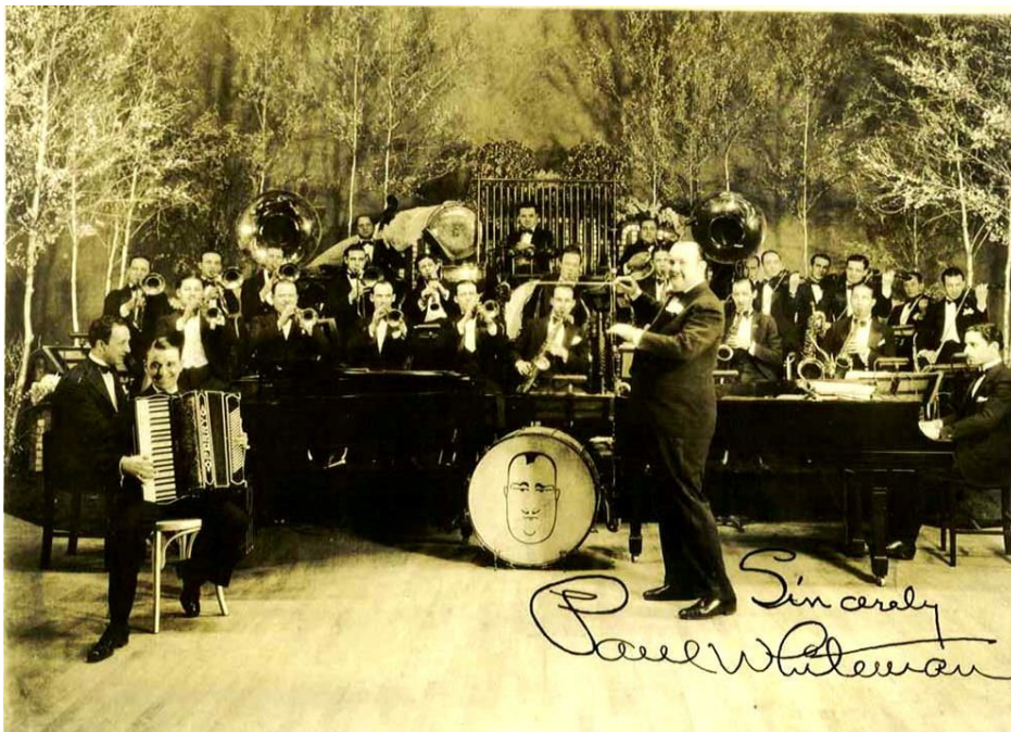
Slika 11: Paul Whiteman i njegov orkestar

Tuba je bila u standardnom sastavu jazz bendova sve do 1920-ih, kada je zamijenjena kontrabasom iako se ponekad koristio suzafon. 1949. godine Miles Davis je uključio tubu u studijska snimanja koja su kasnije izdana kao album Birth of the cool . Orkestar Paula Whitemana ima mnogo fotografija na kojima su dva suzafona smještena na oba kraja benda. Dionica tube je uglavnom bila ista kao i kod žičanog bas instrumenta. Tuba se počela tretirati kao instrument brass sekcije, a ne ritam sekcije, jer su tubisti bili sposobni odsvirati zahtjevnije stvari od jednostavne bas linije. Britanski jazz kompozitori kao što su Kenny Wheeler, Alan Cohen i Darrell Runswick su efektivno iskoristili tubu. Na početku Runswickove skladbe The generals of Islamabad , ritamska linija se svira na solo tubi te se kasnije pridružuju ostali instrumenti kada se ta linija ponavlja (Bevan, 1978).