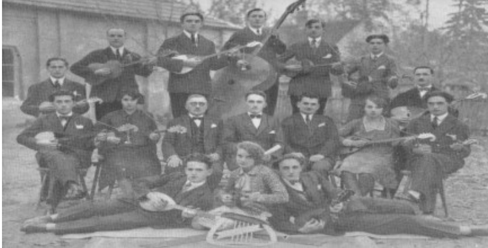
Slika 4: Tamburaška sekcija Slobode 1930. godine (Frntić, Santo, Ivanuša, 1955)

zbor mogao normalno funkcionirati (Frntić, Santo, Ivanuša, 1955: 107 – 113). Može se svakako reći da je tamburaški orkestar uz ostale sekcije društva ostvario svojim djelovanjem sjajne uspjehe i vrijedne zasluge.