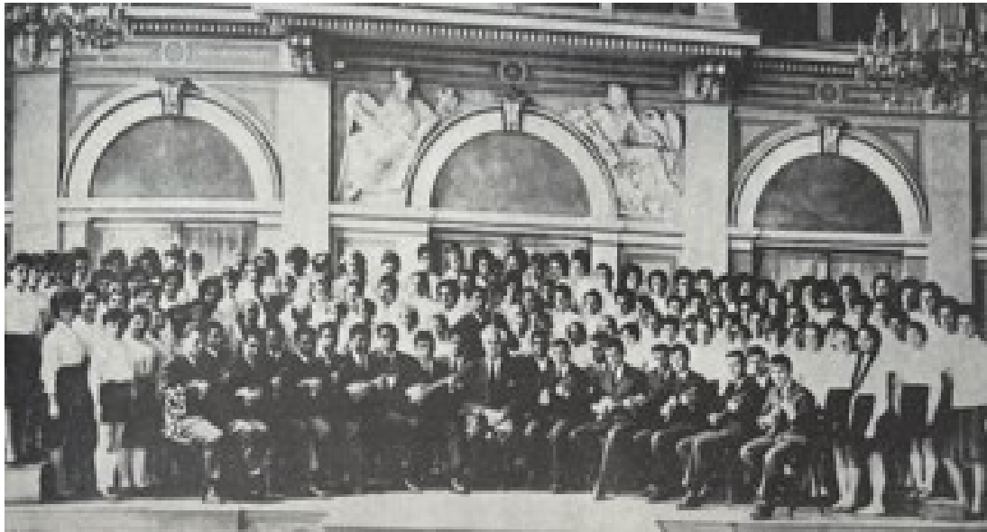
Slika 9: Dječji zbor i tamburaški orkestar Muzičke škole god. 1962./63. (Filić, 1972: 239)

Godine 1963. tamburaški orkestar imao je mnogo koncerata po različitim gradovima, to su: Ludbreg, Našice, Čakovec, Đurđenovac te naravno Varaždin. Skoro sav program koji su izvodili snimali su za Radio Zagreb. (Ferić, 2011: 185)