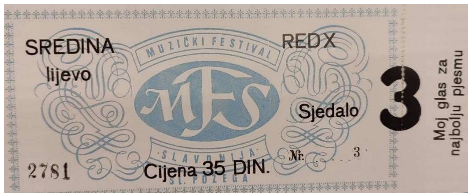
Slika 16: Ulaznica prvog „Muzičkog festivala Slavonije” 1969. godine

sadilo se cvijeće u parkovima, popravljala se javna rasvjeta i dječja igrališta. Sve navedeno, trebalo je dati novu sliku gradu. Na festivalu su sudjelovali umjetnici iz kulture od kojih je najviše interesa pobudilo gostovanje kazališta „Komedija”. Zanimljivo je da je postojao problem s prenoćištem pjevača i gostiju te Požeški list zbog toga objavljuje oglas i molbu građanima koji su u mogućnosti da na dane 12., 13. i 14. lipnja 1969. godine prime na prenoćište goste koji će doći na festival, a prema posebnim tarifama za takvu vrstu ugostiteljskih usluga predviđena je cijena po ležaju od 5 novih dinara. Pripreme za ovaj prvi festival bile su vrlo detaljne, cjelovite i najduže su trajale od svih ostalih godina organiziranja festivala. Tiskana je knjižica s notnim zapisima i riječima pojedinih pjesama te su izdane i gramofonske ploče koje su bile u prodaji.