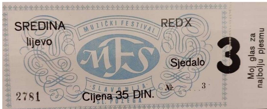
Slika 16: Ulaznica prvog „Muzičkog festivala Slavonije” 1969. godine

sadilo se cvijeće u parkovima, popravljala se javna rasvjeta i dječja igrališta. Sve navedeno, trebalo je dati novu sliku gradu. Na festivalu su sudjelovali umjetnici iz kulture od kojih je najviše interesa pobudilo gostovanje kazališta „Komedija”. Zanimljivo je da je postojao problem s prenoćištem pjevača i gostiju te Požeški list zbog toga objavljuje oglas i molbu građanima koji su u mogućnosti da na dane 12., 13. i 14. lipnja 1969. godine prime na prenoćište goste koji će doći na festival, a prema posebnim tarifama za takvu vrstu ugostiteljskih usluga predviđena je cijena po ležaju od 5 novih dinara. Pripreme za ovaj prvi festival bile su vrlo detaljne, cjelovite i najduže su trajale od svih ostalih godina organiziranja festivala. Tiskana je knjižica s notnim zapisima i riječima pojedinih pjesama te su izdane i gramofonske ploče koje su bile u prodaji.