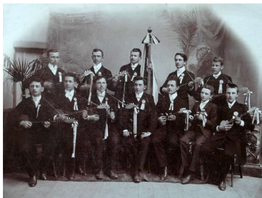
Slika 3: Tamburaški zbor „Osvit”