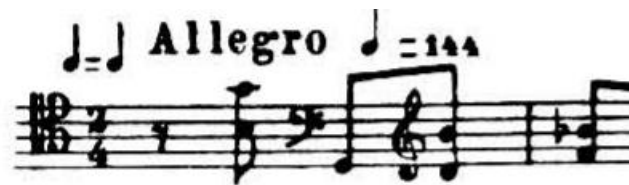
4.3.4. Motiv u kadenci s početka koncerta