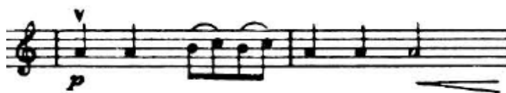
4.2.2. Tematski materijal B