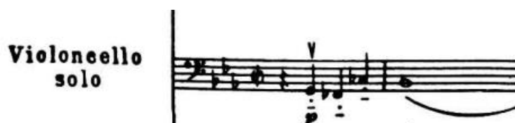
4.1.1. Četveronotni motiv u solo dionici

Koncert započinje prvim stavkom, Allegretto , koji iznosi prvi tematski materijal s jednostavnim i izravnim motivom od četiri note u solo dionici violončela, dok orkestar iznosi drugi motiv koji se sastoji od dvije osminke koje vode do jedne četvrtinke. Ovaj početak primjer je Šostakovičeve primijene trozvuka i kromatike. Dionica violončela solo započinje harmonijski nejasno. Enharmonijskom promjenom prve tri note mogu se analizirati kao trozvuk prvog stupnja e-mola, a zatim silaskom za pola tona na notu B i dionicom drvenih puhača koji iznose trozvuk prvog stupnja Es-dura u anapest ritmu (kratko-kratko-dugo) potvrđuje istoimeni tonalitet koncerta. Ovaj primjer neskladnosti između solista i orkestra prikazuje prikladnu glazbenu metaforu o borbi pojedinca protiv zahtjeva konformizma, upravo kako je i Šostakovič opstao i izdržao protiv Sovjetskog režima. U 13. taktu pojavljuje se motiv koji bi mogao biti shvaćen kao varijacija Šostakovičevog osobnog potpisa, DSCH motiva. Niz nota D-(e)S-C-H glazbeni je kriptogram skladateljevog imena, a ovdje su to četiri silazne note u transpoziciji na tetrakord As-G-F-E.