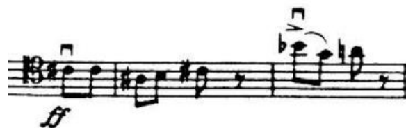
4.4.5. Motiv "Suliko" citiran u 4. stavku

Provedba u trajanju od čak 173 takta donosi novi materijal prvih 60 taktova, a zatim se spaja s drugim tematskim materijalom ovog stavka. Ponovno možemo uočiti citat prvog motiva skriven u novom materijalu, koji se u 192. razrađuje tako što ga međusobno preuzimaju dva fagota s dionicom violončela i kontrabasa, a dionica violončela solo istovremeno svira varijaciju drugog motiva iz 65. takta. Novi materijal provedbe ponovi se još jednom u violončelu solo, tek uz povremene umetke dva klarineta koji sada sviraju isti motiv koji je do maloprije bio u solo dionici. Za pripremu reprize Šostakovič modulira u Es-dur i u orkestar vraća materijal s početka prvog stavka. Za to vrijeme solo dionica, u ovom slučaju u ulozi pratnje, iznosi triolske dvohvate i potvrđuje toniku tonaliteta.