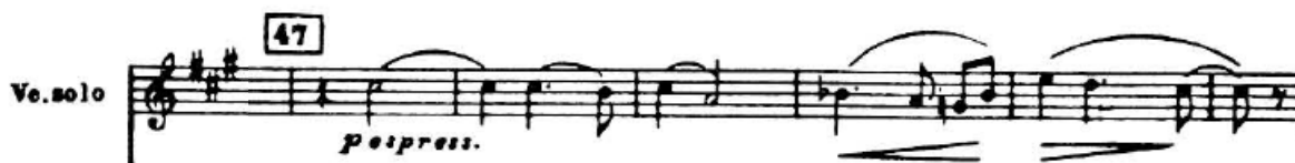
4.2.3. Tematski materijal C

U taktu 70. prvi puta se izlaže tematski materijal C u fis-molu. Dionica solo violončela sadrži melodiju koja gradi napetost tako što modulira u g-mol, a za to vrijeme gudači drže pedalni ton Fis. Ovdje se ponovno može povući paralela između Šostakovičeve primjene kromatskog neslaganja solista s orkestrom i skladateljeve borbe protiv Sovjetskog režima. Također, značajno je istaknuti Šostakovičevu prominentnu uporabu intervala male sekunde koji se pogotovo ističe u ovom stavku.