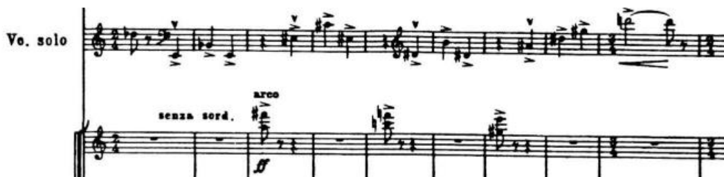
4.4.1. Prvih devet taktova 4. stavka

Prvih devet taktova preklapanja Cadenze i četvrtog stavka prikazuje utjecaj Druge bečke škole; četvrtinke u dionici violončela solo u kombinaciji s akordima u orkestru sadrže svih 11 tonova osim tona G, u čijem se istoimenom molu nastavlja tema finala. Violončelo solo arpeggiranim čistim kvartama (tehnikom koja je već korištena u prethodnim stavcima) dolazi do note D, ujedno i dominante g-mola. Nakon ovog uvoda slijedi prvi tematski materijal ekspozicije koji je karakteristično kromatski i sadrži skriveni motiv s početka koncerta. U tom materijalu na groteskni način citirana je gruzijska narodna pjesma Suliko , koja je navodno bila omlijena pjesma Josifa Staljina. 7 Ovo je zasigurno primjer skrivenog podrugivanja Šostakoviča prema svojem nekadašnjem tlačitelju. U 65. taktu pojavljuje se drugi tematski materijal u kojemu je također citiran prvi motiv prvog stavka, a traje do 111. takta gdje se ponovi početni glazbeni materijal u drvenim puhačima, što karakterizira ovaj stavak kao hibrid rondo i sonatnog oblika.