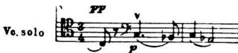
4.3.1. Tematski materijal C na početku kadence

Strukturalnom funkcijom ovaj stavak podsjeća na Šostakovičev Prvi koncert za violinu u a-molu, kako u oba djela nakon sporog stavka nastupa opsežna kadenca te ga spaja sa sljedećim, finalnim stavkom. Ovaj stavak gotovo je potpuno sastavljen od materijala koji se pojavljuju u prva dva stavka. U prvoj sekciji solo violončelo poigrava se s tematskim materijalima iz Moderata , tako što već na početku koristi prvi motiv iz tematskog materijala C, nakon kojeg nastupa prvi blok pizzicato akorda od četiri takta. Kasnije razrađuje motiv iz 89. takta drugog stavka, nakon kojeg ponovno slijedi blok od pet pizzicato akorda, vodeći do varijacije motiva koji se pojavljuje u 103. taktu prethodnog stavka.