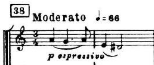
4.2.1. Tematski materijal A

Drugi stavak skladan je u ABACAB obliku, što je prikaz vrlo jasne formalne strukture koja se također može analizirati kao ternarni oblik (tema A kao ritornello ). 5 Smješten u tonalitetu a-mola, ovaj stavak udaljen je za tritonus od Es-dura Allegretta , što je pola tona razlike od inače tradicionalne subdominante drugog stavka. Za razliku od prominentnih drvenih puhača u prvom stavku, u Moderatu veći je fokus na dionice gudača, što pruža miran i mračni ugođaj stavka sve do 115. takta. Orkestralni uvod sastoji se od tematskog materijala A koji sadrži ritam karakterističan za sarabande ples; od tri dobe u taktu naglasak je na drugu. Tematski materijal A pojavljuje se samo kao orkestralni tutti i nikada u dionici violončela solo, koje iznosi tematski materijal B u 16. taktu. Materijal B dijatonski je i sadrži folklorne karakteristike.