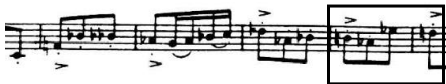
4.4.6. Novi materijal u provedbi sa sakrivenim prvim motivom

Provedba u trajanju od čak 173 takta donosi novi materijal prvih 60 taktova, a zatim se spaja s drugim tematskim materijalom ovog stavka. Ponovno možemo uočiti citat prvog motiva skriven u novom materijalu, koji se u 192. razrađuje tako što ga međusobno preuzimaju dva fagota s dionicom violončela i kontrabasa, a dionica violončela solo istovremeno svira varijaciju drugog motiva iz 65. takta. Novi materijal provedbe ponovi se još jednom u violončelu solo, tek uz povremene umetke dva klarineta koji sada sviraju isti motiv koji je do maloprije bio u solo dionici. Za pripremu reprize Šostakovič modulira u Es-dur i u orkestar vraća materijal s početka prvog stavka. Za to vrijeme solo dionica, u ovom slučaju u ulozi pratnje, iznosi triolske dvohvate i potvrđuje toniku tonaliteta.