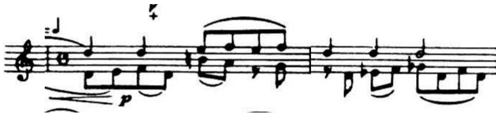
4.3.3. Tematski materijal B u dvohvatima

pojavljaju umetci gdje Šostakovič koristi interval male sekunde. U Più mosso dijelu skladatelj gradi kaotičnu i histeričnu energiju tako što koristi silazne i uzlazne ljestvice u tridesetdruginskom ritmu. Kulminacija ovog stavka preljeva se u uvod četvrtog stavka, Allegro con moto .