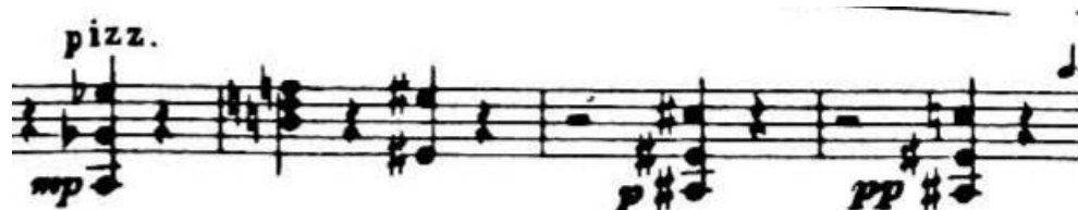
4.3.2. Blok pizzicato akorada

U 52. taktu pojavljuje se varijacija tematskog materijala B u dvohvatima gdje gornji glas iznosi melodiju, a donji služi kao pratnja koja u izvornom obliku pripada dionicama gudača. Zadnja pojava pizzicato akorda nastupa u 64. taktu i razdvaja prvu sekciju sa sljedećom, koja je pretežno u triolskom ritmu i konstantnom accelerandu . Dolazimo do promjene u karakteru, ali i promjene tempa od Allegretta , zatim Allegra i na kraju Più mosso dijela. Allegro dio kadence varira motiv sa samog početka koncerta pomoću korištenja dvohvata, a time dodatno gradi crescendo i gustoću materijala. Ponovno se