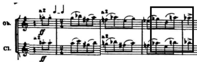
4.4.2. Prva tema 4. stavka sa skrivenim prvim motivom