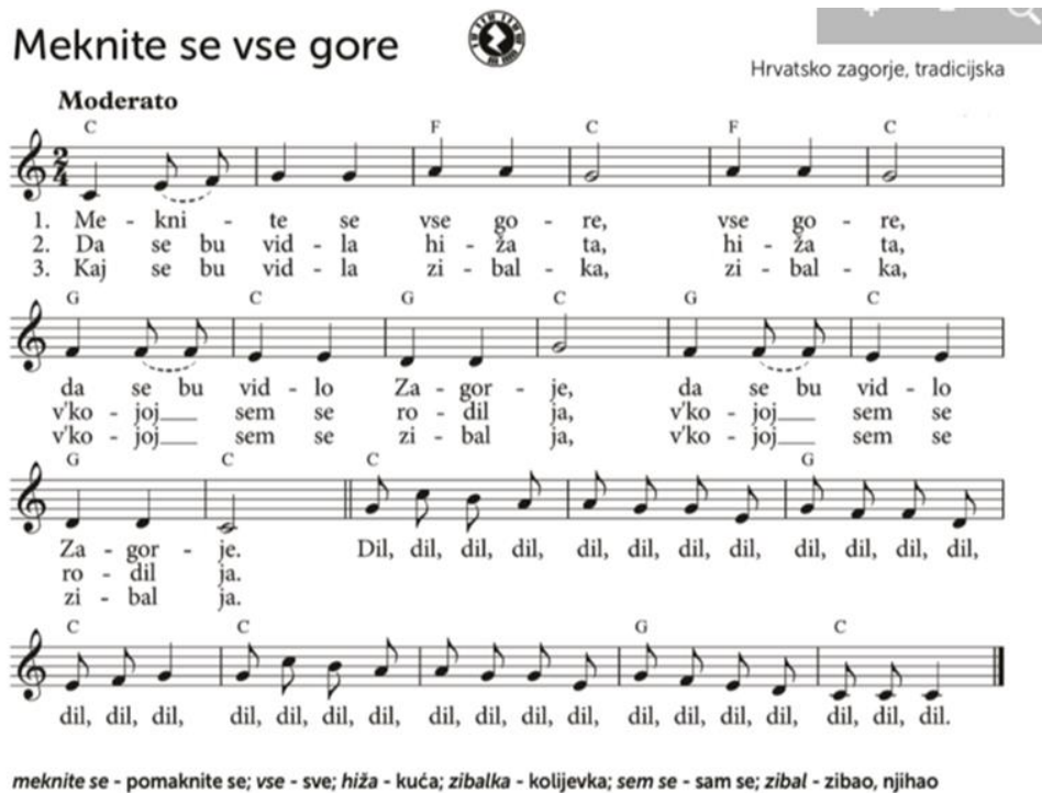
Slika 18. „Meknite se vse gore“

Uz ovu pjesmu moguće je uvježbavanje tradicijskog plesa iz Hrvatskog zagorja. Učenicima bi se predstavio folklorni ples te bi oni u nekoliko susreta naučili korake i koreografiju koju bi zatim mogli prezentirati u školi ili na nekoj drugoj kulturnoj manifestaciji. Bilo bi poželjno kada bi učenici imali mogućnost odjenuti narodne nošnje – u ovom slučaju iz Zagorja – i u njima otplesati uvježbani ples. Uz to, vjerujem da bi se mnogi učenici zainteresirali za tradicijsku glazbu te izrazili želju za sviranjem na tradicijskim glazbalima. U tu svrhu moguće je pokretanje „malih tamburaša“ koji bi funkcionirali kao izvannastavna aktivnost. Svrha te aktivnosti bila bi da učenici nauče svirati tamburice te da se postupno osnuje orkestar koji bi u budućnosti pratio ples i pjevanje tradicijskih pjesama. Vjerujem kako bi ta aktivnost bila dobro prihvaćena jer u svojoj sredini imam dobar primjer vrlo uspješnog funkcioniranja takve aktivnosti, zahvaljujući voditelju koji je zainteresiran da djeci prenese svoje znanje i vještine.