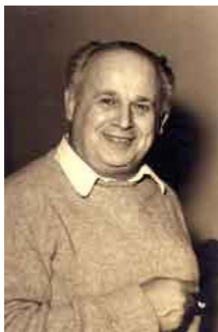
Slika 1.: Moshé Pinchas Feldenkrais

https://www.feldenkraissf.com/moshe-feldenkrais