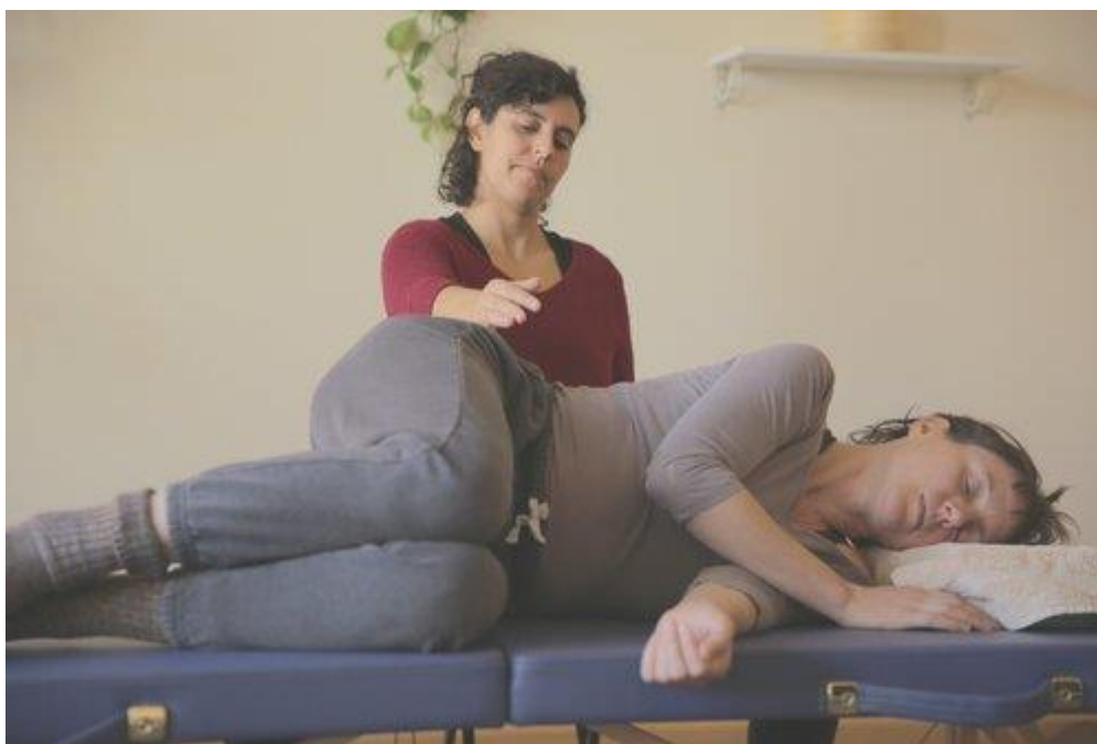
Slika 4.: Individualne lekcije Feldenkrais metode

Individualne lekcije, odnosno funkcionalne integracije manualni su kontakt između učenika i učitelja, kojim se učenik što preciznije navodi na bolje razumijevanje trenutačnog obrasca pokreta. Traju između 30 i 60 minuta. Učitelji prilagođavaju, odnosno individualiziraju vježbe radi učinkovitijeg usmjeravanja na željene funkcionalne ciljeve učenika u skladu s principima i tehnikama Feldenkrais metode. Osnovne funkcije ove tehnike su stvaranje osjećaja sigurnosti i podrške u svim dijelovima tijela, te ispravno pozicioniranje dijelova tijela kako bi se smanjio napor u mišićima, a time i njihova kontraktilnost.