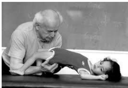
Slika 3.: Primjena Feldenkrais metode

https://feldenkrais-education.com/en/moshe-feldenkrais-biography/