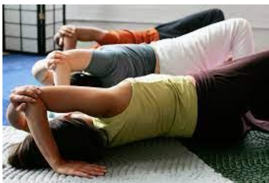
Slika 3.: Grupne lekcije Feldenkrais metode

Grupne lekcije, odnosno svjesnost kroz pokret vođena su verbalna istraživanja koja traju između 45 i 60 minuta. Tijekom lekcije osobe ne oponašaju osobu pokraj sebe ni ne pokušavaju dostići određeni cilj, već vježbaju svojim tempom. U grupnim lekcijama ne primjenjuje se manualni kontakt, već se verbalnim putem nastoji pomoći učenicima kako bi osvijestili ono što trenutačno čine, poboljšali sposobnost perceptualnog razlikovanja i istražili različite načine djelovanja, što rezultira osobnim napretkom. Vrlo rijetko učitelj pokazuje pokret, odnosno pokazuje ga samo radi detaljnijeg pojašnjenja uputa ili sigurnosti učenika. Učitelj ne navodi sveukupni obrazac određenog pokreta kako bi učenik mogao sâm istraživati i pronalaziti vlastite i odgovarajuće mogućnosti djelovanja. Naglasak je na povećanoj svijesti sudionika i polaganim kretnjama tijekom kojih učenici mogu opaziti što osjećaju, misle, rade i doživljavaju. Time uče kako izbjeći nepotreban napor pri određenoj aktivnosti ili druge neučinkovite navike, a istovremeno pronaći udobnost i učinkovitost. Iako su pokreti u pravilu blagi i spori, u određenim se slučajevima u lekcijama mogu koristiti brži i zahtjevniji pokreti.