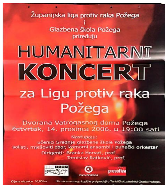
Slika 4: Plakat Humanitarnog koncerta za Ligu protiv raka Požega

Posebnu tradiciju predstavlja koncert koji Glazbena škola Požega škola priređuje u suradnji sa Županijskom ligom protiv raka Požega. Svake godine u mjesecu prosincu, od kada je srednja glazbena škola osnovana, svi umjetnički talenti se mobiliziraju kako bi stvorili što kvalitetniji glazbeni program u čast ovako plemenitom cilju. Svaki učenik, bilo solistički ili u ansamblima, barem jednom tijekom školovanja nastupio je na ovom zajedničkom projektu i dao svoj doprinos. Kako bi se predstavili najbolji solisti i ansambli, programski koncept koncerata mijenjao se tijekom godina. Velik broj posjetitelja i njihovo zanimanje za promicanje ove humanitarne ideje predstavlja snažan poticaj za mlade glazbenike da svojim umijećem i glazbenim izvedbama doprinesu poboljšanju okoline u kojoj žive.