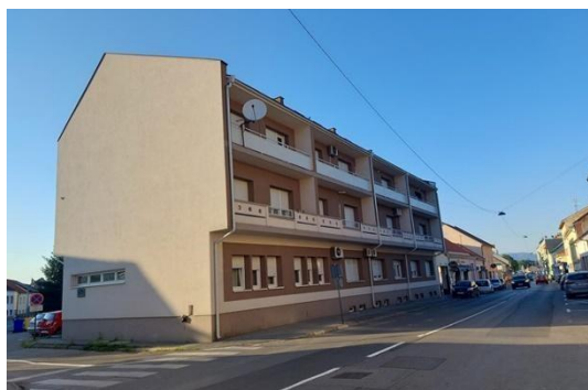
Slika 6: Stara lokacija Glazbene škole Požega, ulica Stjepana Radića 3, izvor: https://plusportal.hr/politika/uprivasamouprava/grad_daje_dva_prostora_na_koristenje_te_jos_njih_19_u_zakup-23273 (datum pristupa 21. svibnja 2023.)

1970. godine, kada je Glazbena škola Požega počela s radom, nije imala vlastiti prostor za izvođenje nastave. Zbog toga su godinama radili u neprimjerenim uvjetima u zgradi Narodnog sveučilišta, Đačkom domu i hotelu Požeška gora . Konačno, 1980. godine, preselili su se u zgradu Gimnazije. Međutim 1991. godine, preselili su se u privremeni prostor u prizemlju stambene zgrade u ulici Stjepana Radića 3. Taj privremeni prostor postao je stalna adresa sljedeće dvadeset i dvije godine. Održavanje proba zborova i orkestra bio je poseban problem zbog nedostatka prostora, pa su se često koristili prostori gradskih društava, poput Vijenca i Gradske glazbe Trenkovi panduri , a kasnije i prostori nove zgrade Gimnazije u Požegi.