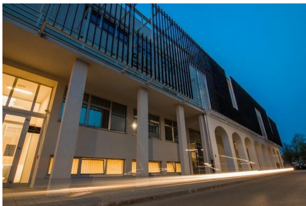
Slika 7: vanjski izgled nove zgrade Glazbene škole Požega