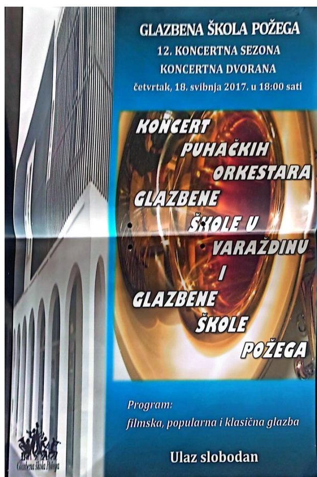
Slika 2: Plakat Koncert puhačkih orkestara Glazbene škole u Varaždinu i Glazbene škole Požega

To je prvi put u povijesti škole da je osnovan orkestar ovoga tipa. Ono što je zanimljivo jest da puhački orkestar čine učenici svih uzrasta i instrumenata koji pohađaju Odjel za puhače i udaraljke, uključujući učenike od trećeg razreda osnovne škole pa sve do četvrtog razreda srednje škole. Prvi njegov dirigent bio je Tomislav Ratković do 2008., nakon čega orkestar preuzima Ivan Luladžić. Orkestar sudjeluje na mnogim koncertima koji se održavaju u sklopu škole, kao i na raznim gostovanjima s drugim glazbenim školama u drugim gradovima (Bjelovar, Zagreb i Varaždin). Jedan od zapaženijih nastupa bio je godine 2019. kada je orkestar nastupio na Humanitarnom koncertu za Ligu protiv raka zajedno s poznatim hrvatskim tenorom Ivom Gamulinom.