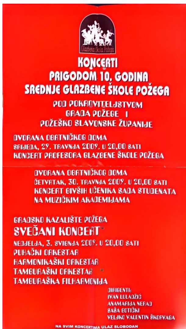
Slika 5: Plakat koncerta prigodom 10. godina Srednje Glazbene škole Požega

U danima koji prethode proslavi Dana grada učenici i nastavnici Glazbene škole organiziraju niz koncerata za svoje sugrađane i posjetitelje Požege. Među najatraktivnijim događajima u tom razdoblju koncert je profesora na kojem nastavnici svoju publiku oduševljavaju sjajnim nastupima, bilo kao solisti ili u raznim komornim kombinacijama, kao dio pjevačkih ili instrumentalnih ansambala. Ova tradicija započela je 2006. godine u dvorani nekadašnjeg Vatrogasnog doma, a održava se gotovo svake godine. Glazbena škola Požega može se pohvaliti mladim i dinamičnim nastavničkim kolektivom koji obiluje svježim idejama i velikim potencijalom.