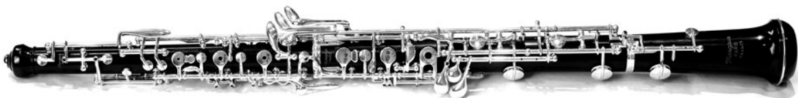
Slika 1: Suvremena oboa

Količina mehanike koja se danas nalazi na instrumentu, uz suvremene tehničke i tonske zahtjeve, dodatno je otežala samo puhanje zraka, iako je olakšala mogućnost izvođenja tehničkih bravura. Oboa je prikladna za duge, pjevne melodije zbog nevelike količine zraka koju troši i tehnike cirkularnog disanja (istovremeno udisanje i ispuštanje zraka). Brzi, artikulirani pasaži, kao i dvostruka/trostruka artikulacija, ne odgovaraju najbolje prirodi instrumenta, pogotovo u niskom registru. Kroz povijest glazbe, oboa je prisutna u svim stilovima, a značajniju je ulogu imala u baroku i romantizmu. Također se koristi u popularnoj i filmskoj glazbi, dok u jazzu nije baš zastupljena. Srodni instrumenti su oboa d'amore i engleski rog, a rjeđe se koriste bas oboa i musette .