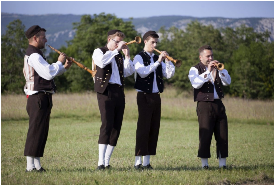
Slika 14: Članovi KUD-a "Ivan Fonović Zlatela" Kršan sviraju sopile