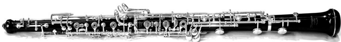
Slika 1: Suvremena oboa

Količina mehanike koja se danas nalazi na instrumentu, uz suvremene tehničke i tonske zahtjeve, dodatno je otežala samo puhanje zraka, iako je olakšala mogućnost izvođenja tehničkih bravura. Oboa je prikladna za duge, pjevne melodije zbog nevelike količine zraka koju troši i tehnike cirkularnog disanja (istovremeno udisanje i ispuštanje zraka). Brzi, artikulirani pasaži, kao i dvostruka/trostruka artikulacija, ne odgovaraju najbolje prirodi instrumenta, pogotovo u niskom registru. Kroz povijest glazbe, oboa je prisutna u svim stilovima, a značajniju je ulogu imala u baroku i romantizmu. Također se koristi u popularnoj i filmskoj glazbi, dok u jazzu nije baš zastupljena. Srodni instrumenti su oboa d'amore i engleski rog, a rjeđe se koriste bas oboa i musette .