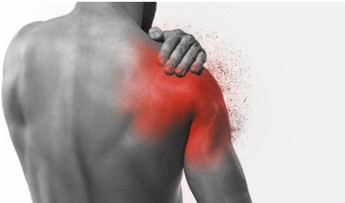
Slika 1: Bolovi u ramenu

U zaključku, tegobe s ramenom mogu biti ozbiljan problem za violiniste i druge glazbenike, ali ih je moguće spriječiti pravilnom njegom tijela i tehnika sviranja. Važno je imati svijest o pravilnom položaju tijela, zagrijavanju prije sviranja i prepoznavanju simptoma tegoba s ramenom kako bi se na vrijeme moglo intervenirati i izbjeći ozbiljnije posljedice. Ako violinist primijeti bilo kakvu bol ili napetost u ramenima, važno je prestati svirati i potražiti savjet stručnjaka kako bi se izbjegle ozbiljnije tegobe.