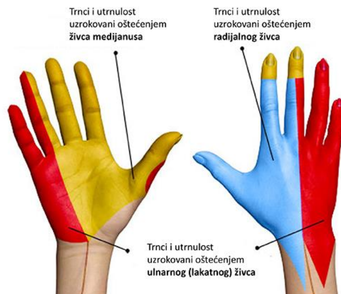
Slika 2: Dio kožnog pokrivača (dermatom) šake inerviran osjetilnim nitima ulnarnog živca, označen plavom bojom.

Fizikalna terapija uključuje vježbe koje poboljšavaju raspon pokreta i jačaju mišiće koji podržavaju ruku. Također se može koristiti elektrostimulacija ili masaža kako bi se smanjila upala i bol u području kubitalnog kanala. Lijekovi su također mogućnost liječenja. Protuupalni lijekovi ili kortikosteroidi mogu se koristiti za smanjenje upale i boli u području kubitalnog kanala. U težim slučajevima, kirurško liječenje može biti potrebno za oslobađanje stegnutog živca. Postupak se naziva kubitalna tunnelna dekompresija, a obično se izvodi pod općom anestezijom.