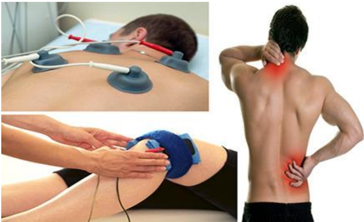
Slika 5: Fizikalna terapija

Terapija laserom je oblik terapije koji koristi snopove svjetlosti visokog intenziteta, poznate kao laser, za liječenje raznih medicinskih stanja. Provodi se pomoću uređaja koji emitiraju laserske zrake usmjerene prema zahvaćenom dijelu tijela. Ovi laserski zraci prodiru u tkivo i uzrokuju kemijske promjene u stanicama, što može poboljšati protok krvi, smanjiti upalu i bol te potaknuti regeneraciju tkiva.