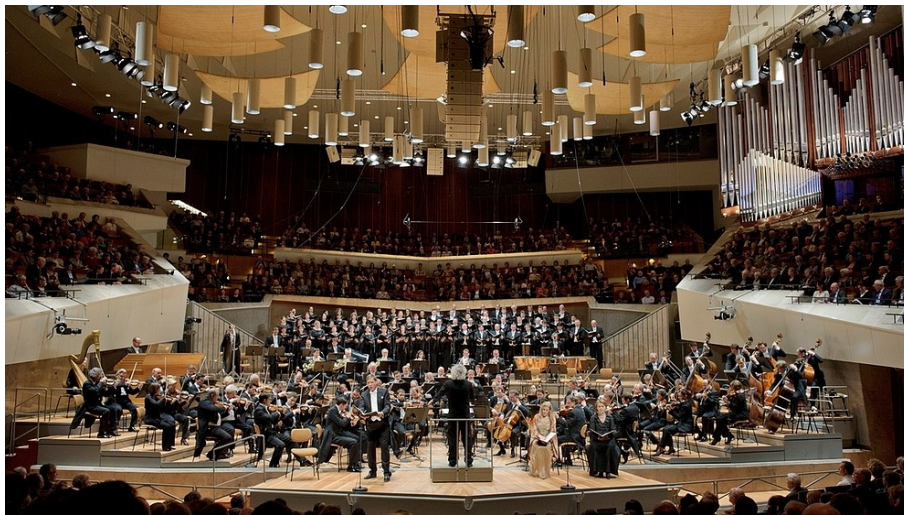
(Velika dvorana Berlinske filharmonije)

Kako su studijske snimke vremenom postajale sve kvalitetnije u tehničkom i izvedbenom smislu publika je taj nivo izvedbe očekivala i na samim koncertima pa su se tako sve više počele izdavati snimke koncertnih izvedbi. Samim tim su se i moderne koncertne dvorane počele projektirati ne bi li zadovoljile uvjete za studijsko snimanje. Primjer jednog takvog modernog arhitektonskog remek-djela je poznata dvorana Berlinske filharmonije ( Berlin Philharmonie, arhitekt Hans Scharoun, otvorena 1963. ) za čiju je izgradnju inicijativa sredinom 50-ih godina prošlog stoljeća potekla od jednog od najvećih i najkarizmatičnijih dirigenata 20. stoljeća Herberta von Karajana. Revolucionarni koncept te dvorane je bio u tome da se dirigent nalazi u samom središtu dvorane dok nitko u publici koja okružuje izvođače od njih ne sjedi dalje od 33 metra. 13 Akustika je takva da se u velikom simfonijskom orkestru glazbenik osjeća kao u komornom ansamblu, a publika ima dojam da može gotovo dotaknuti izvođače. 14