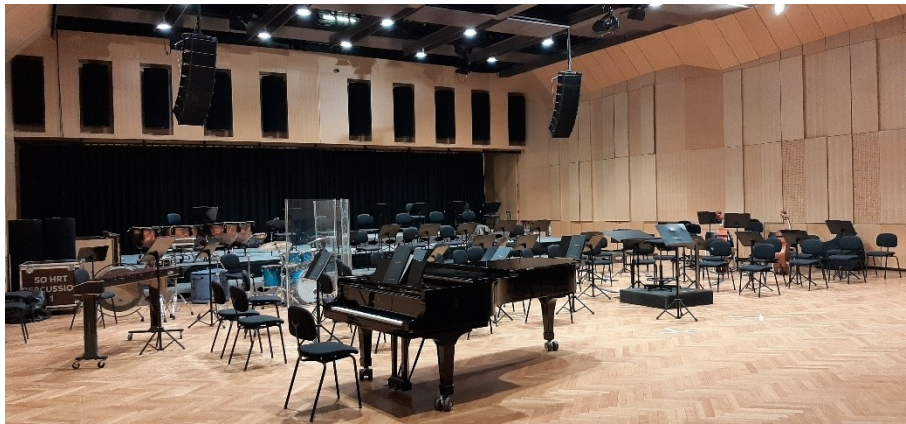
(Dvorana, Studio Bajsić, HRT)

Snimanje koncertne izvedbe je oduvijek bio izazov kako za izvođače tako i za producente i ton-majstore (ako se radi o video snimanju i za režisere) jer se odvija u realnom vremenu i prostoru, bez mogućnosti ponavljanja, popravljanja ili manipulacije. I mada su takve snimke za publiku interesantnije, vjernije i autentičnije, mnogo je više izdanja studijski snimljene glazbe. To je prvenstveno zato jer je u studiju lakše kontrolirati većinu parametara. Tako se od početka razvoja tehnologije snimanja i reproduciranja zvuka počeo razvijati i glazbeni studio kao prostor kontroliranih uvjeta za snimanje zvuka.