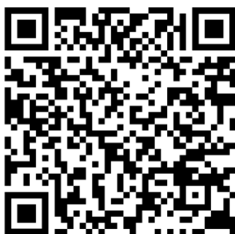
Slika 4. QR kod koji vodi na snimku emisije Simon & Garfunkel: Bookends 34

Već spomenuta osobna povezanost s Radijem Student stvorila je priliku za radijsku emisiju, izrađenu u svrhu ispitivanja mogućnosti pedagoške primjene albuma Bookends u poučavanju i učenju glazbe. Emisija Simon & Garfunkel: Bookends emitirana je 4. veljače 2023. godine u 16 sati na Radiju Student. Rad s mladima objašnjen u petom poglavlju rada polazna je točka za ovu pedagošku primjenu i istraživanje. Prethodno stečeno iskustvo i znanje produkcije emisija na Radiju Student služili su kao stabilna baza za tijek emisije i pisanje sinopsisa (Prilog 2). Emisija je unaprijed snimljena u studijskim prostorima Radija Student te tehnički obrađena uz pomoć kolege Jurja Rebernjaka. Snimka emisije nalazi se na stranici Mixcloud, streaming servisu čija je česta uporaba arhiviranje radijskih snimki. Do emisije se može doći preko QR koda (Slika 4).