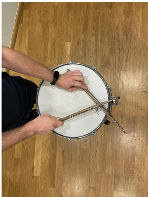
Slika 22. Palica o palicu.