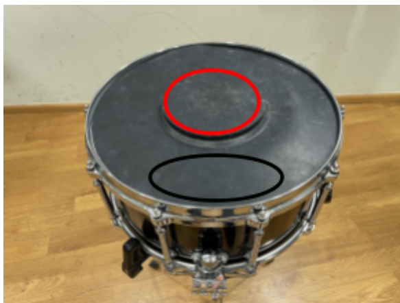
Slika 8. Crvena - centar; Bijela - prostor od centra do ruba.

Nakon toga slijedi dio na gumi za vježbanje koja se mora prije početka izvedbe nalaziti na malom bubnju. Za cijeli taj dio preporučuje se vježbanje rudimenata na gumi za vježbanje. Uzimaju se motivi iz tog dijela i prilagođavaju se za zagrijavanje, poboljšanje tehnike i sl. Najviše pažnje mora se obratiti na dva različita zvuka na gumi, a to su dio bliže obruču bubnja i sam centar. Moraju se čuti razlike između ta dva zvuka, ali oni moraju biti ujednačeni ( vidi slika 8 ).