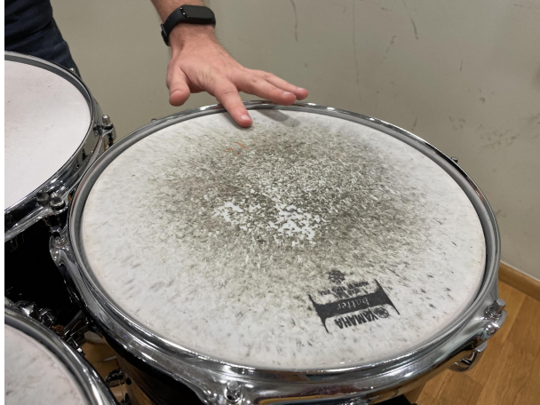
Slika 21. Rimshot.

Uz to, mora se razumjeti i broj predudara koji je zapisan. U 114. taktu se prvi puta javljaju tridesetdruginke svirane prstima. Da bi se odsviralo točno, potrebno posvetiti vrijeme za pronalaženje sebi odgovarajućeg prstometeta te vrijeme za vježbanje istog. Ostatak materijala sa prstima može se posložiti prstometom, kao da se svira sa palicama. Na kraju drugog stavka javlja se materijal kao i na početku, što bi se moglo nazvati reprizom te se preporučuje i korištenje svih prije spomenutih savjeta.