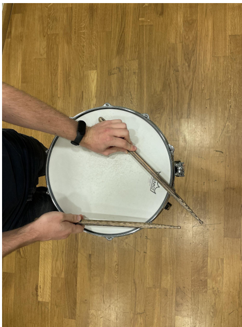
Slika 23. Palica o rub bubnja.