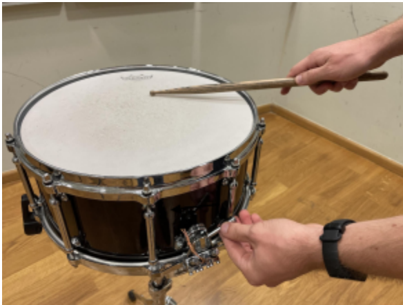
Slika 6. Smjer uključivanja mrežice bubnja.

Slika 5. U notnom zapisu stranica 5, red 5, takt 4.