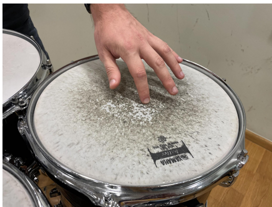
Slika 19. Centar toma.

U pitanju muzikalnosti, najbitnije je osjećaj 3/4 mjere, a zatim dinamike koje su ovdje uglavnom tihe. Nadalje, od slova A do D većinom se sastoji od glasa koji drži ostinato i solo dionice. To bi već trebalo biti poznato od skladbe Kim . Uz to, najbitnije je poštivati zadane dinamike svake dionice. Posebno treba paziti na metlicu koju se mora uzeti u lijevu ruku u trećem taktu slova A. Od tada pa nadalje treba pronaći ravnotežu u dinamici između metlice i drvene palice za mali bubanj. U slovu B koriste se obje metlice te se moraju razumjeti različite boje zvukova jer je jedna metlica na malom bubnju, a druga na tomu. Od slova C pa do reprize početka drugog stavka, zadani materijal se svira prstima. Mora se čuti razlika između tri boje, a to su centar toma, rub i rimshot ( vidi slika 19, 20, 21 ).