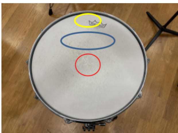
Slika 2. Žuta - rub; Plava - prostor između ruba i centra; Crvena - centar

Sa ovim dolazimo i do treće bitne stavke Intrade a i cijele suite a to je dinamika. Kroz cijelu suitu student bi trebao znati odsvirati sve dinamičke promjene. Za vježbu bi se trebalo i pretjerivati u dinamikama, pogotovo u onim najtišim i najglasnijim.