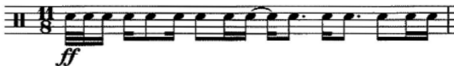
Slika 13. Á. Másson: "Prím"; 1. takt

gledati kao zapisanu u dvotaktu 4/4 i 3/8. Npr. prvi takt kao 3/8 plus 4/4 te iznad grupe zamišljene kao 3/8 stavio luk. Taj princip može se primijeniti na ostatak skladbe kako bi se uvelike olakšao proces čitanja i izvedbe. Razmjestaj grupe od 3/8 može varirati od takta do takta, ali luk zapisan iznad grupe u potpunosti mijenja vizualnu sliku ( vidi sliku 13, 14, 15 ).