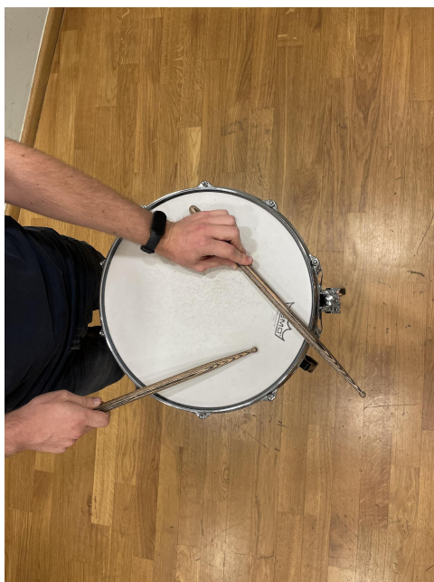
Slika 24. Latino klik i udarac po koži.

U slovu F se prvi puta javlja roll sa jednom rukom u situaciji dosad već poznatoj, a to je da imamo prateću i solo dionicu. Roll jednom rukom je ovog puta u pratećoj dionici te se zbog problematike izvođenja mora svirati jako tiho a isto vrijedi i za drugi dio gdje se ponavlja ova situacija. Dio koji bi mogao zadati probleme je 139. takt u kojem se moraju uzeti dvije palice u