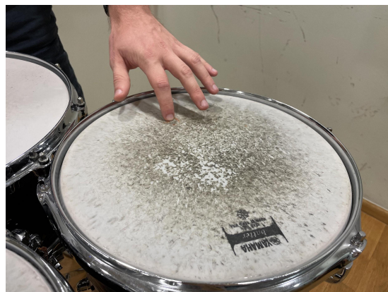
Slika 20. Sredina toma.