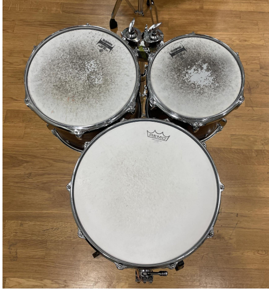
Slika 18. Postava instrumenata

U pitanju muzikalnosti, najbitnije je osjećaj 3/4 mjere, a zatim dinamike koje su ovdje uglavnom tihe. Nadalje, od slova A do D većinom se sastoji od glasa koji drži ostinato i solo dionice. To bi već trebalo biti poznato od skladbe Kim . Uz to, najbitnije je poštivati zadane dinamike svake dionice. Posebno treba paziti na metlicu koju se mora uzeti u lijevu ruku u trećem taktu slova A. Od tada pa nadalje treba pronaći ravnotežu u dinamici između metlice i drvene palice za mali bubanj. U slovu B koriste se obje metlice te se moraju razumjeti različite boje zvukova jer je jedna metlica na malom bubnju, a druga na tomu. Od slova C pa do reprize početka drugog stavka, zadani materijal se svira prstima. Mora se čuti razlika između tri boje, a to su centar toma, rub i rimshot ( vidi slika 19, 20, 21 ).