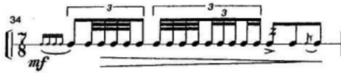
Slika 16. N. Martynciow: "Impressions for snare drum and two tom - toms "; 34. takt.