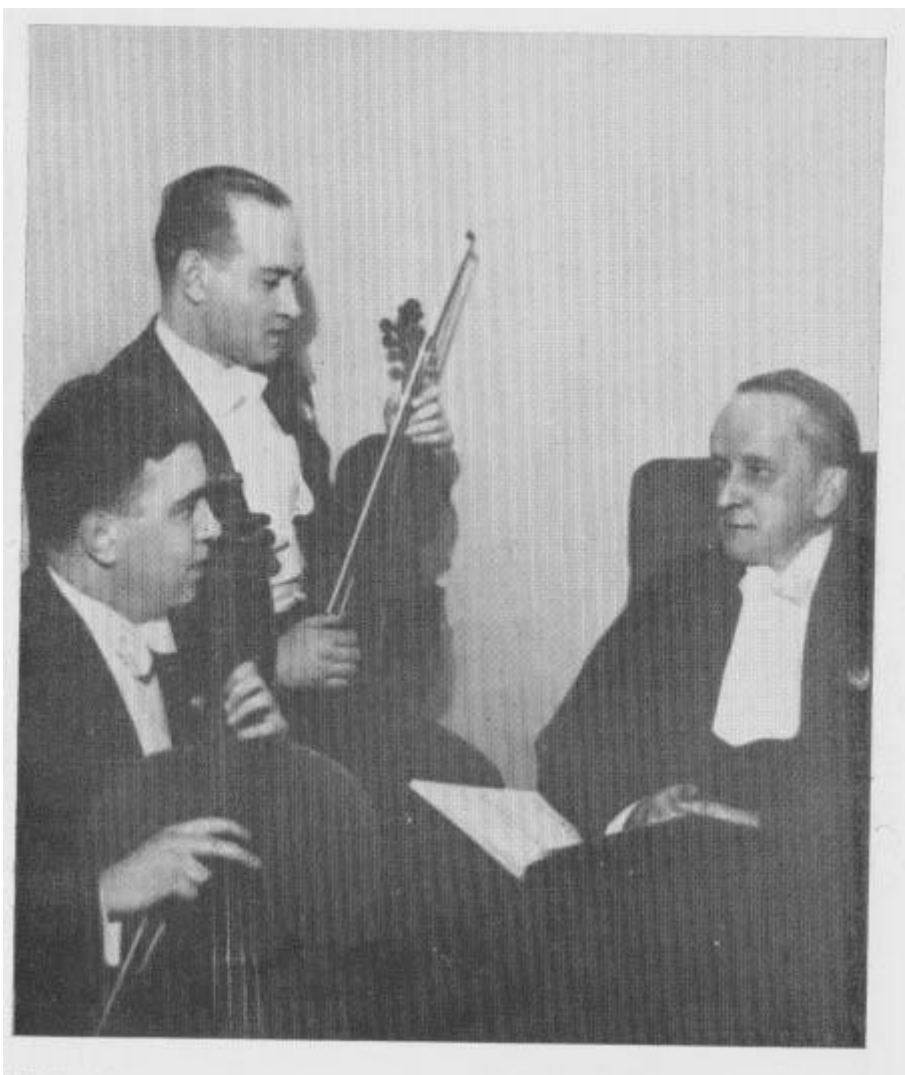
S. N. Knuševitcki , D. F. Oistrach i K. N. Igumnov nakon izvedbe Klavirskog trija Čajkovskog 1939.g.