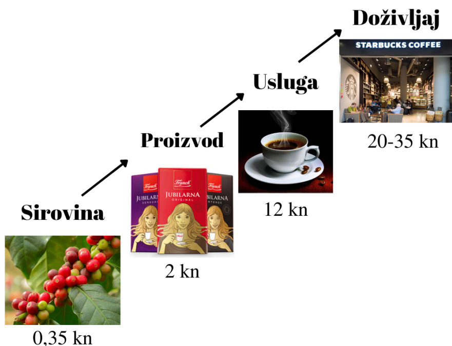
Slika 2. Razvoj ekonomije na primjeru kave