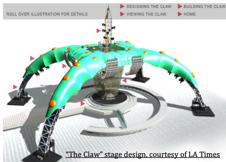
Slika 4. Dizajn ideja 360° pozornice na turneji (Daniel Dicker, 2011)

„Dizajn pozornice je rezultirao povećanjem kapaciteta za 15% -20%. Također, pozornica omogućuje jedinstvenu raspodjelu ulaznica, "10.000 stvarno jeftinih ulaznica" smještenih dalje od pozornice moglo je cjenovno progresivno rasti približavanjem publike bendu“ (Daniel Dicker, 2011).