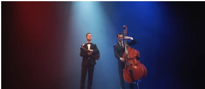
Slika 6: Isječak iz spota Lijepa Naša

Još dva spota veoma su teatralna i svečana, a to su oni povezani uz pjesme koje upućuju na domoljublje. U verziji dua, hrvatska himna Lijepa naša , 52 kao i obrada pjesme Hrvatskog Band Aida, Moja domovina , 53 usko su vezane uz osjećaj nacionalne pripadnosti, kao što suptilno prikazuje i slika ispod.