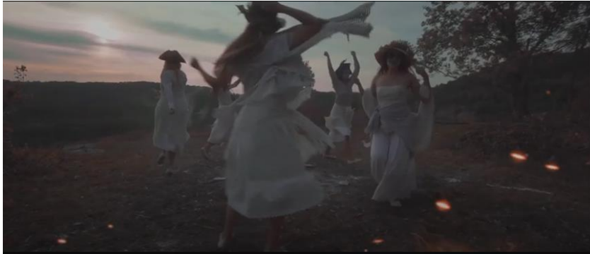
Slika 3: Isječak iz spota skladbe Klek's Witches (Youtube).

Dočaravanju legende pomogao je i spot pjesme, 46 za kojeg je zaslužan multimedijalni umjetnik Zdenko Bašić. Spot donosi ples žena u krugu, u kostimima i s rekvizitima koji upućuju na „vještičarenje“.