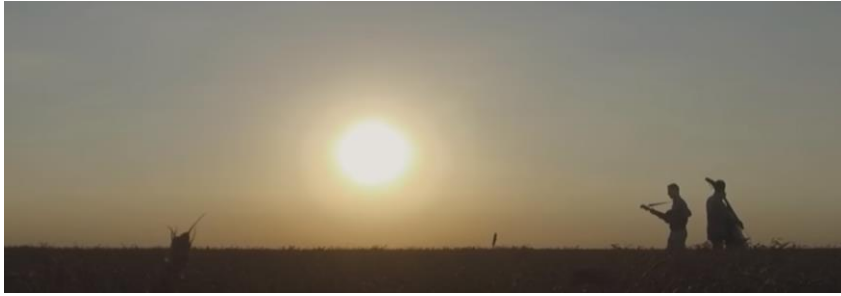
Slike 4 i 5: Isječci iz spotova Balkanika i Mista Dance

Još dva spota veoma su teatralna i svečana, a to su oni povezani uz pjesme koje upućuju na domoljublje. U verziji dua, hrvatska himna Lijepa naša , 52 kao i obrada pjesme Hrvatskog Band Aida, Moja domovina , 53 usko su vezane uz osjećaj nacionalne pripadnosti, kao što suptilno prikazuje i slika ispod.