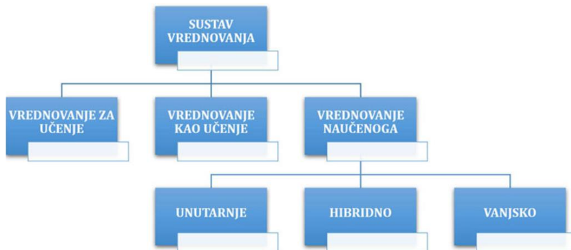
Slika 1: Pristupi vrednovanju prema Okviru za vrednovanje (IZZI, 2019)

„Vrednovanje bi i u hrvatskim glazbenim školama trebalo bolje usustaviti te ujednačiti njegovo provođenje, a nastavne planove i programe na kojima se temelji – modernizirati“ (Brđanović, 2017a: 359). Unaprijed dogovoreni kriteriji i pravila stvaraju manje stresa pri samom ocjenjivačkom postupku.