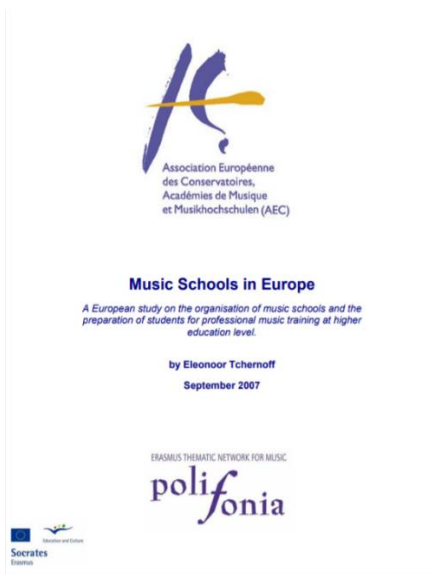
Slika 3: Glazbene škole u Europi (eng. Music Schools in Europe ) (Polifonia, 2007)