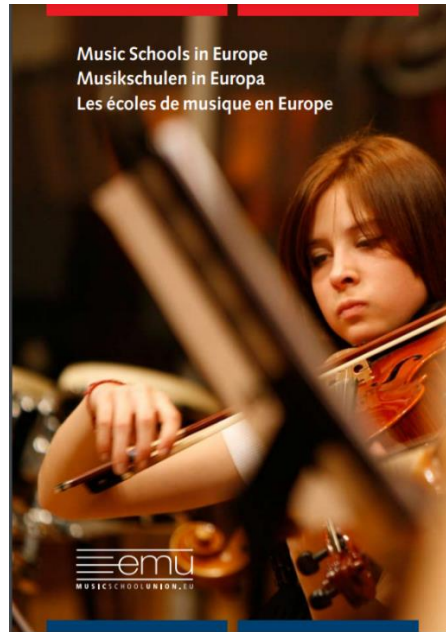
Slika 4: Glazbene škole u Europi (eng. Music Schools in Europe) (EMU, 2010)

Opisom će biti obuhvaćeni: (1) kvalifikacijski ispiti; (2) predškolski glazbeni odgoj te istaknute metode i programi; (3) programi za nadarene učenike; (4) solfeggio i teorija glazbe; (5) kurikulum. Obrazložene su gotovo sve metode i programi kako bi se pružio što bolji uvid u sustave glazbenog obrazovanja u navedenim državama.