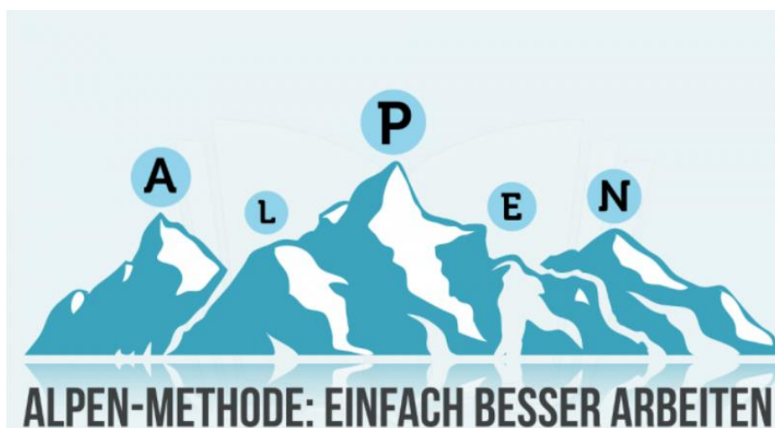
Slika 2. Prikaz Alpske metode (Mai, J. (2021). ALPEN-Methode: Definition, Tipps, Vor- und Nachteile, < https://karrierebibel.de/alpen-methode/ >. Pristupljeno 28. srpnja 2021.)

Alpska metoda daje vrlo jasnu strukturu i omogućuje obavljanje zadataka prema prioritetima te što veću učinkovitost. Prednost je ove metode jasno viđenje strukture dana raspisane na papiru, za čije je zapisivanje potrebno samo nekoliko minuta na dan, a iz nje se jasno vidi i vlastita produktivnost, što povećava motivaciju za daljnje napredovanje prema cilju.