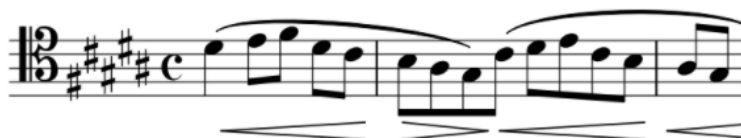
4.2. b) Prijedlog plana dinamike u t. 6-7 drugog stavka Brahmsove 2. simfonije

Kombinacija svih navedenih problema može se lako vidjeti u taktovima 5-10. Ovaj dio izvatka počinje naglim descrescendom s vrhunca početne fraze te je bitno namjestiti gudalo da se ton drastično smekša i namjesti u poziciju za narednu frazu koja počinje u pianu s naizgled nikakvim očitim uputama. Grafički zapis može biti zbunjujuć, no potrebno je pratiti luk kako bi razvili tijek fraze. Moguće je shvatiti sredinu zapisane fraze kao vrhunac nakon čega slijedi decrecendo :