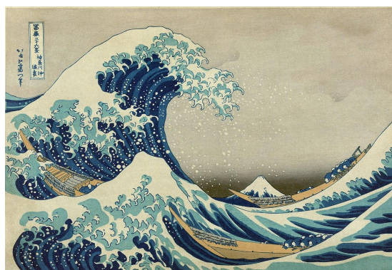
4.4. a) Lijevo prikaz prvog izdanja La Mer , desno crtež japanskog umjetnika Hokusaija

Vizualna umjetnost i slikovitost je veoma bitna, od samog načina na koji skladatelj opisuje svoju kompoziciju “trois esquisses symphoniques” [tri simfonijske skice]. Debussy se također smatra glavnim predstavnikom impresionizma u glazbi i “...naziv «nacr, skica» treba, međutim shvatiti u duhu impresionističke poetike, koja djelo dosta prožima. Ako u Debussyja išta odgovara poetici impresionizma, onda je to More .” 10 Ovaj ekstenzivni uvod bitan je ne samo zbog poznavanja povijesti umjetnosti i djela koje se izvodi, već kako bi pristup orkestralnom izvatku bio drukčiji od pristupa njemačkim kompozitorima i tradiciji koja je dosad pretežito predstavljena. To i jedan od razloga