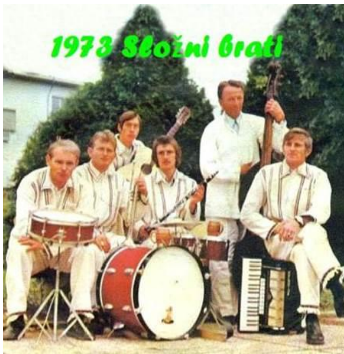
Slika 2. Prikaz tipičnog instrumentarija zagorskog sastava druge polovice XX. stoljeća; Sastav „Složni brati“, 1973. 7

dogadjanja poput otvaranja novog rudnika, češki su rudari nastupali u sastavima tradicijskih „limenih glazbi“. 6 Preuzimanje instrumenata poput trube, klarineta i baritona od navedenih orkestara te njihovo kombiniranje s tada popularnim, domaćim tamburaškim zvukom rezultiralo je stvaranjem novog, specifičnog glazbenog izričaja. Zagorci bi često i sami izrađivali navedene instrumente, a rjeđe bi ih kupovali od čeških rudara. S vremenom je svoje mjesto u takvim sastavima pronašla i harmonika, koja i danas predstavlja jedan od simbola zagorske zabavne glazbe. Takav tip „kombiniranog“ sastava u narodu se nazivao „jazz“ (sve do 70-ih godina), a predstavljao je najčešće peteročlani ansambl trube, klarineta, harmonike, gitare i basa. Odmakom od tamburica i dodavanjem električnih instrumenata i bubnjeva, krajem XX. stoljeća, taj se zvuk transformirao u glazbeno „zabavniji“ oblik. No, s obzirom da je žanr u svojim počecima nadilazio nacionalne teritorijalne granice, postavlja se pitanje može li se takva glazba nazivati isključivo zagorskom? Iako se u suvremenom kontekstu zagorskoj glazbi često pripisuje „slovenski prizvuk“, činjenica je kako je prvi festival takvog tipa glazbe pokrenut upravo na području Zagorja („Igrajte nam mužikaši“, 1968.), dok je u Sloveniji do iste inicijative došlo tek godinu danas kasnije („Festival narodnozabavne glasbe Ptuj“, 1969.).