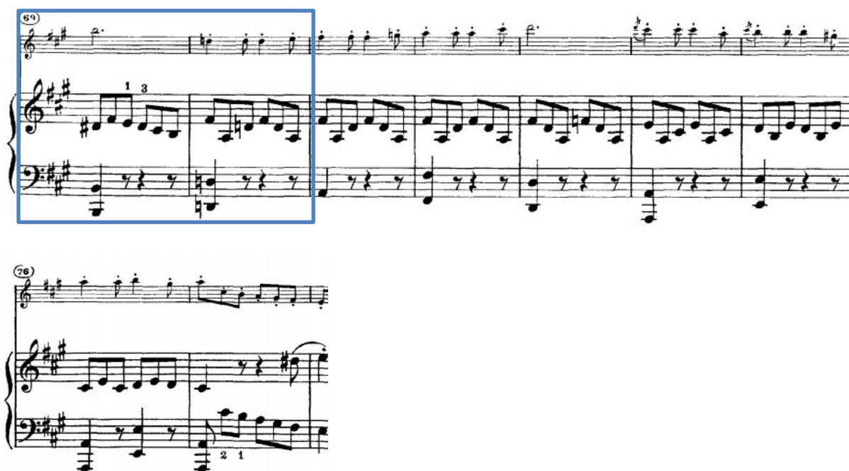
Slika I. 4.1.a. Izvadak iz Kreutzer sonate op. 47, br. 9.

Nakon izlaganja teme u dionici violine (62. takt – 69. takt), slijedi kromatska tercna veza kojom se ostvaruje drugi nastup druge teme, ponovno u dionici violine, no ovoga puta počinje u D-duru. Ista situacija se primjenjuje i na dionicu klavira. Također, budući da nije potvrđen početni niti ciljni tonalitet, zbog brzog i naglog nastupa druge teme može se reći da je riječ i o svojevrsnom tonalitetnom skoku.