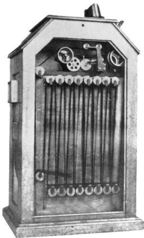
Slika I. 3.4.a. Kinetoskop 63

očevidno, nakon spoznaje, učiniti još tri pothvata: stvoriti podlogu (filmsku vrpču) koja će moći primiti niz brzih snimaka jednu za drugom, takav, ondašnjim jezikom, fotografski aparat (filmsku kameru) koji će biti pogodan za snimanje takvom vrpcom i specijalnu napravu (projektor) koja će rezultat snimanja prenijeti gledatelju. 62 Kasnije će filmsku vrpču George Eastman, inače osnivač tvrtke Eastman Kodak i pionir popularne fotografije i filma, zamijeniti elastičnom celuloidnom vrpcom. Potom je William Kennedy Laurie Dickson na poticaj Thomasa Edisona (tvorca fonografa) stvorio kinetoskop, prvo kino , odnosno uređaj za prikazivanje filmova.