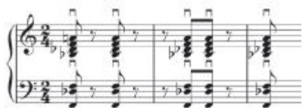
Slika 3.3.3.c. Psiho – „Hitchcockov akord“ kao četverozvuk 41