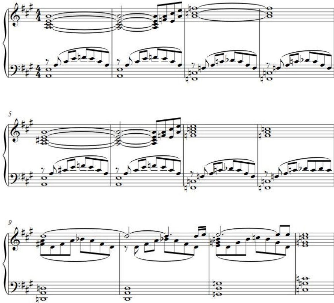
Slika 4.1.1.a. Notni prikaz glazbe iz scene Many Meetings [ Mnogi susreti ]

Za prvi primjer proučit ćemo ulomak Many Meetings [ Mnogi susreti ] iz trilogije The Lord of the Rings: The Fellowship of the Ring [ Gospodar Prstenova: Prstenova družina ], za koji je glazbu skladao Howard Shore.