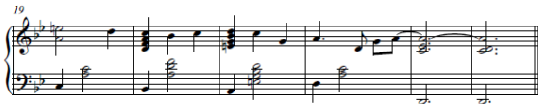
4.2.2.a. Notni prikaz glazbe iz scene Opening scene [ Scena otvorenja ]