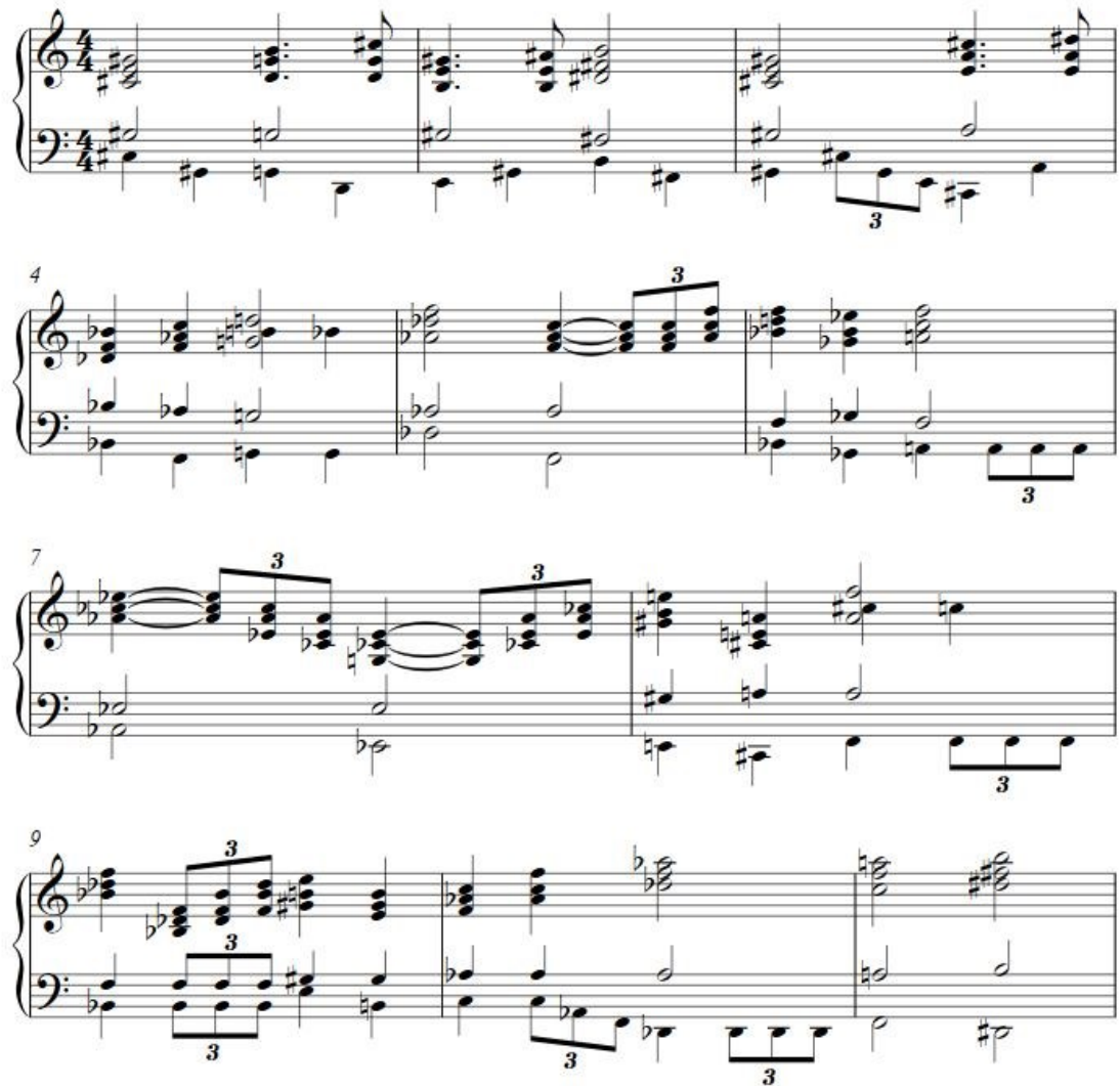
Slika 4.1.4.a. Notni prikaz glazbe iz početnog ulomka Main Title [Glavni Naslov]

Zadnji primjer koji ćemo analizirati u ovome poglavlju je početni ulomak Main Title [Glavni Naslov] iz filma Spider-Man (2002), za koji je glazbu napisao Danny Elfman.