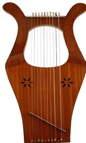
Slika 1. Primjer kinnora (harfe) na kakvom je kralj David svirao.

Prvi zapisi vezani uz židovsku glazbu javljaju se u Starom Zavjetu u nekoliko navrata, obzirom da je glazba zauzimala veoma važnu ulogu u životu, kulturi i religiji tadašnjih židova. Već na samom početku knjige, u dvadeset i prvom retku četvrtog poglavlja knjige Postanka spominje se Jubal, praotac svih koji sviraju liru i svirale. Naknadno, Leviti se spominju kao jedini židovi kojima je dozvoljeno svirati u Jeruzalemskom Hramu. Njihova glazba ne samo da je podebljala vjersku simboliku žrtvenih službi, već je imala moć činiti čuda. Stari židovi vjerovali su da njihova glazba može liječiti, voditi u ekstaze, predviđati budućnost itd... U šesnaestom poglavlju prve knjige o Samuelu većinski se spominje vjerovanje kako će Davidovo 1 sviranje na harfi otjerati zloduhe svaki put kad zasvira.