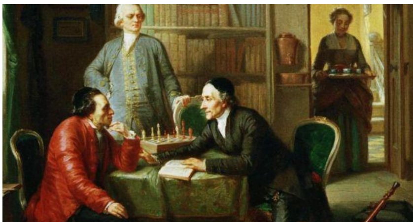
Slika 2. Moritz Daniel Oppenheim: Lavater and Lessing visit Moses Mendelssohn