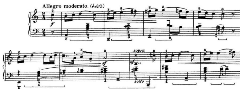
Slika 6. Béla Bartók: Rumunjski plesovi