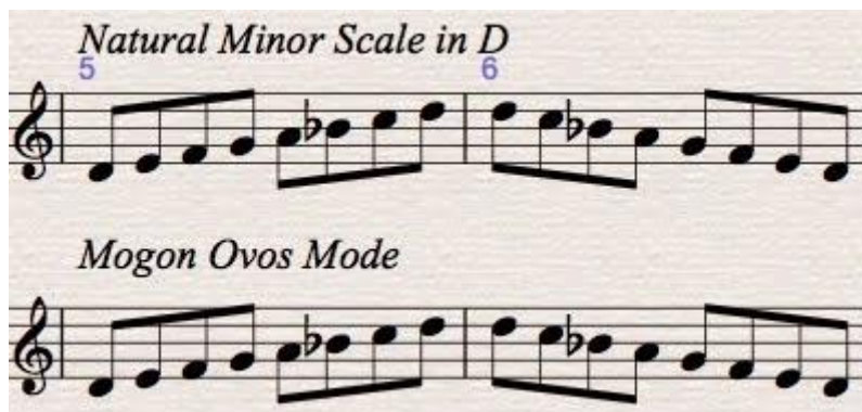
Slika 3.2. notni primjer Mogon Ovos modusa

Mogon Ovos modus je po stupnjevanju identičan prirodnom molu, ali se promatra kao modus zbog toga što je u sinagogama pjevan prije pojave dura i mola u Europi. U sinagogama je u ovom modusu kantor pjevao na jednom tonu veći dio teksta, a za naglašavanje riječi prelazio bi u paralelni dur.