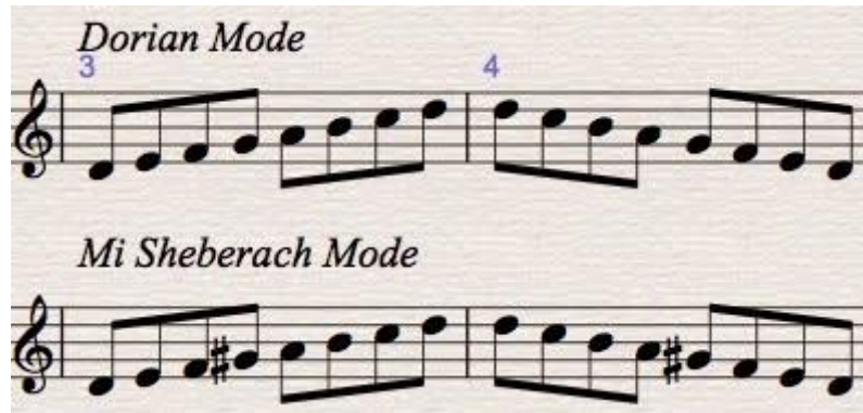
Slika 3.1. notni primjer Mi Sheberach modusa

te se nerijetko naziva i drugim imenima poput „ukrajinski dorski modus“ i „rumunjska molska ljestvica“ zbog velike zastupljenosti u tamošnjem folkloru.