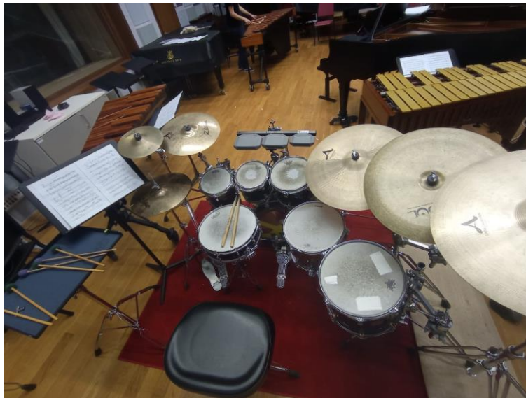
Slika 10: Postavka seta bubnjeva za 1. i 3. stavak Koncerta za udaraljke i klavir Jurice Hrenića

zvukova kojima rukuje što podrazumijeva veliku spremnost, uvježbanost i spretnost brzog prebacivanja s jednog instrumenta na drugi. Osim što smatram da je djelo zaista zanimljivo te veoma atraktivno za slušatelje, također podliježe mnogim pedagoškim manirama na koja izvođač mora obratiti veliku pažnju ne bi li ovo djelo izveo što bolje i točnije. Također, osim što sam prvi čitao notni tekst i s razumijevanjem dolazio do brojnih zaključaka koje sam pod svako poglavlje zasebnog stavka navodio, imao sam važnu ulogu osmisliti kako će izgledati set bubnjeva s obzirom na estetiku, primjenu i praktičnost samog. Način na koji sam postavio set bubnjeva nije obvezan za primjenu istog te svaki drugi izvođač ima potpunu slobodu postaviti ga kako mu najbolje odgovara. Postavljajući set bubnjeva kako bi sama izvedba bila što bolja i točnija, nisam želio previše mijenjati izgled klasičnog seta bubnjeva te sam ga gotovo nesvjesno postavio onako kako bih ga postavio i za Koncert za orkestar i udaraljke Andréa Joliveta, što me je i potaklo na analizu i usporedbu ovih dvaju djela.