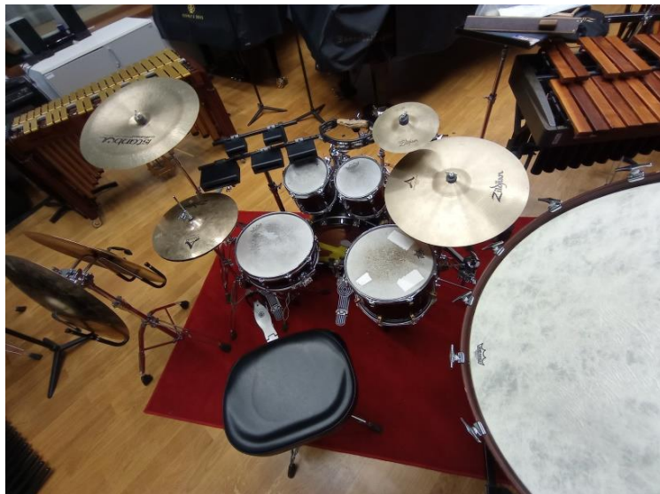
Slika 8: Postavka 4. stavka Koncerta za udaraljke i orkestar A. Joliveta

Grandiozan i veoma silovit početak ponovno klavirske dionice najavljuje veliko finale ove kompozicije. Skladatelj je u ovom stavku koristio set bubnjeva s dodanim udaraljka koje su zapravo učestale u korpusu udaraljki kod orkestralnih skladbi. U setu bubnjeva koristio je bas bubanj koji se svira pedalom, mali bubanj, tri tom-toma , Crash , China , Splash , Hi-Hat činele, činele a-due , grand cassu , tamburin, tri temple blocka i jedan wood block .