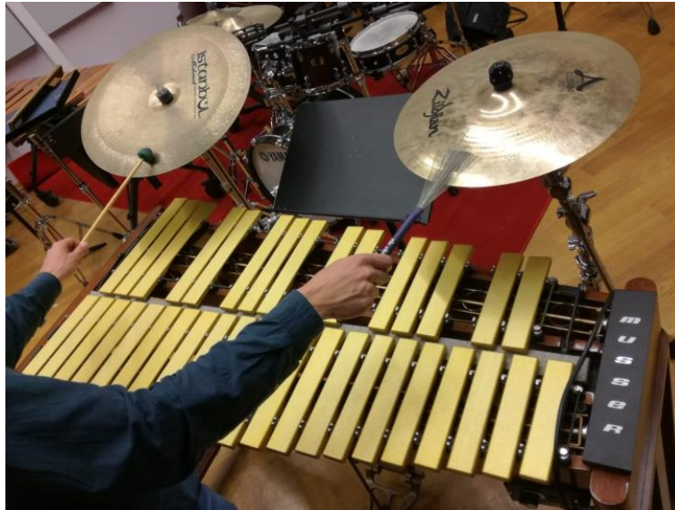
Slika 2: Način na koji se sviraju činele na početku 2. stavka Koncerta za udaraljke i orkestar A. Joliveta

jer klavir ne nastupa na prvu dobu. U ovom stavku A. Jolivet koristi vibrafon, jednu Crash činelu koja se izvodi s metlicom u desnoj ruci te je postavljamo na desnoj strani, odmah do stalka za note, ispred vibrafona, te China činelu koja se izvodi lijevom rukom u kojoj je vibrafonska palica srednje tvrdoće postavljena odmah do stalka za note, ispred vibrafona, s lijeve strane.