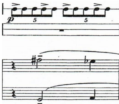
Slika 9: Problematika sviranja nepravilnog ritamskog obrasca vertikalno s dionicom klavira u 4. stavku Koncerta za udaraljke i orkestar A. Joliveta

Furiozan početak, s iznošenjem teme u klaviru nakon osmingske pauze, može biti veoma problematičan ukoliko izvođač ne poznaje dovoljno prateću dionicu klavira. Kao pomoć, u dionici svojih nota ispisao sam ritam dionice klavira koji mi je uvelike pomogao točno i precizno iznijeti nastup na tom-tomovima . Za razliku od ostalih stavaka, u ovom stavku dionice klavira i udaraljki konačno pronalaze „zajednički jezik“ te umjesto konstantnog nadopunjavanja, često skladno prolaze zadnjim stavkom. Gotovo cijeli stavak pisan je u dvopolovinskoj mjeri, osim u početku kad se ona isprepliće s tropolovinskom, stoga i nije toliko teško i zahtjevno biti precizan i točan. S obzirom da skladbe pisane za set bubnjeva u tadašnje vrijeme nisu bile učestale te gotovo da i nisu postojale, notacija za set bubnjeva raspodijeljena je u nekoliko crtovlja, ovisno o broju instrumenata koji u određenom trenutku nastupaju. Takav način zapisivanja seta bubnjeva u današnje vrijeme gotovo da i ne postoji, jer kad bismo izvodili kompleksnije skladbe, takav način zapisivanja uopće ne bi bio praktičan i jednostavan za čitanje, pa tako i za snalaženje. Posebno ću naglasiti problematiku u trećem taktu u broju 68, gdje na malom bubnju solist izvodi kvintole, a u klavirskoj dionici je nakon četvrtinske pauze nastup polovinki te na zadnjoj dobi četvrtinka, a situaciju sličnu toj nalazimo i nekoliko taktova kasnije.