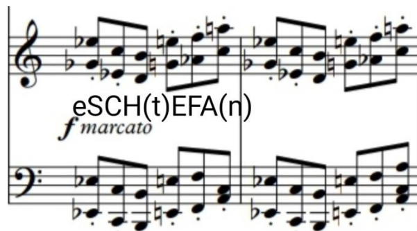
Slika 11: Kodirani način pisanja glavne teme 1. stavka u dionici klavira Koncerta za udaraljke i klavir Jurice Hrenića otkriva ime izvođača radi kojeg je djelo nastalo

Prvi je stavak sonatnog oblika te sadrži dvije teme različitog karaktera koje kontrastiraju jedna drugoj po sadržaju i instrumentariju. Kako i naziv stavka govori – Dialog , nastao je iz razgovora motivskog rada između klavira i udaraljki. Instrumentarij koji skladatelj koristi u ovom stavku su klavir kao pratnja te set bubnjeva u kojem je pet tomova, jedan mali bubanj, veliki bubanj s pedalom, tri temple blocka 2 te dvije Crash 3 činele, jedan Hi-hat 4 , jedna China 5 činela, Ride 6 činela i Splash 7 činela. Zbog epidemiološke situacije u kojoj je djelo nastajalo, tomovi su u ovom stavku zapravo zamijenili timpane te se i sama izvedba tretira tako da tomovi zvuče kao timpani. U stavku prevladavaju tercna i sekstna harmonija od koje je i u konačnici nastala prva tema koja traje od početka stavka do 25. takta. Nakon iznošenja prve teme u klaviru javljaju se tomovi koji zapravo opisuju liniju timpana s kratkim prekidima na malom bubnju te činelama. Karakter prve teme je strogo orkestralno te je set bubnjeva prikazan tako da je realizirana skladateljeva ideja.