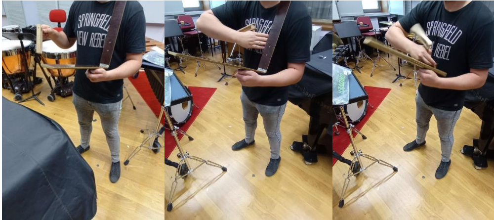
Slike 4, 5 i 6: Način na koji se svira početak 3. stavka na biču i čegrtaljki

Nakon iznošenja kratkog uvoda u dionici klavira, dolazimo do nastupa ksilofona koji u određenim trenucima klavir prekida četvrtinskim udarcima ne bi li melodijsku liniju učinio što složenijom i također dao lažan privid prve dobe. Vježbajući dio od broja 33 pa sve do broja 36, često nisam koristio ksilofon već mali bubanj, jer je zadatak ovog dijela stavka razumjeti točne ritamske vrijednosti, budući da u tom dijelu u dionici ksilofona nema razvijene melodijske linije.