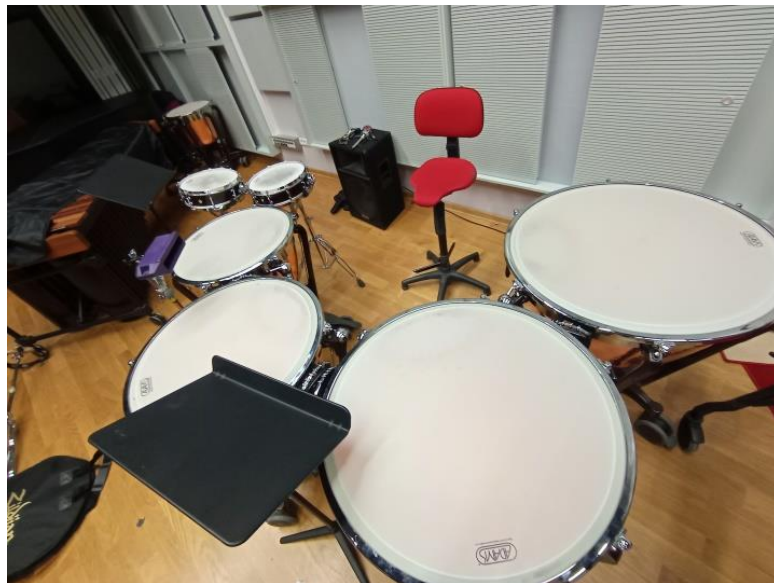
Slika 1: Postavka 1. stavka Koncerta za udaraljke i orkestar A. Joliveta

Vježbajući ovaj stavak najviše sam vremena potrošio na točnost izvođenja zajedno s klavirom, te sam obraćao pažnju na mnoštvo naglih promjena dinamika koje su prisutne u ovom stavku. Osim pripreme točnog notnog teksta, precizno sam uvježbavao pojedine trenutke poput stavljanja denfera na timpane, uključivanja i isključivanja mrežica na malim bubnjevima, a iznova sam pokušavao raditi i na što većoj pedantnosti izvedbe.