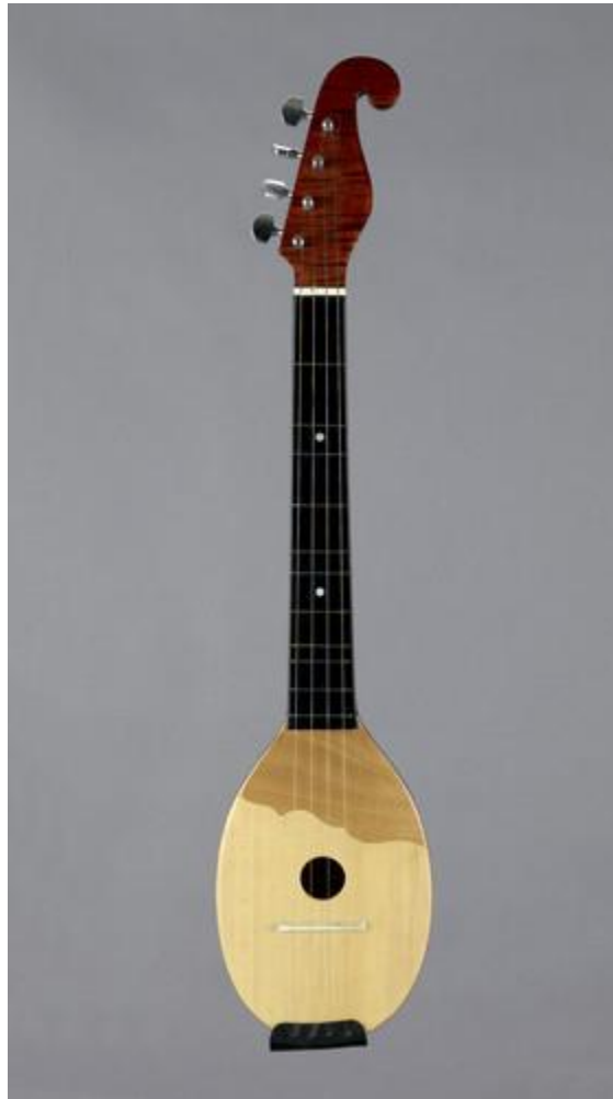
Slika 10. Tambura Samica

Samica se najčešće može čuti na pojedinim smotrama i festivalima.“ Prihvaćena je kao solističko narodno glazbalo koje se upotrebljava u folklornim ansamblima“ 66