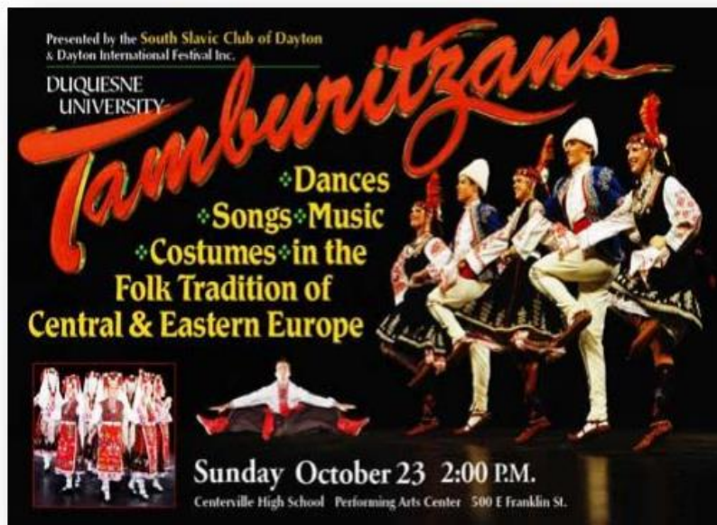
Slika 5. Tamburitza news