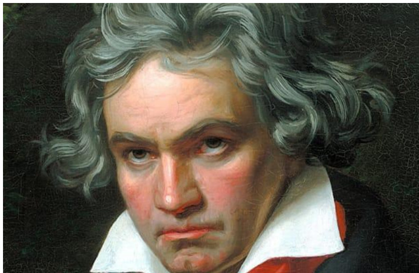
Slika 2. Ludwig van Beethoven (Izvor: Ludwig van Beethoven )

Prva opera po imenu “Dafne” izvedena je 1594. u Firenci i nakon toga se ubrzano razvijala i širila na ostala područja. Barok je razdoblje u kojem u glazbi dolazi do velikih novina. Javljaju se brojna imena u svijetu glazbe od kojih su možda najvažniji Bach i Händel. Klasična instrumentalna muzika na svom je vrhuncu bila kod bečkih velikana s prijelaza iz osamnaesto u devetnaesto stoljeće: Beethovena, Mozarta i Haydna. 15