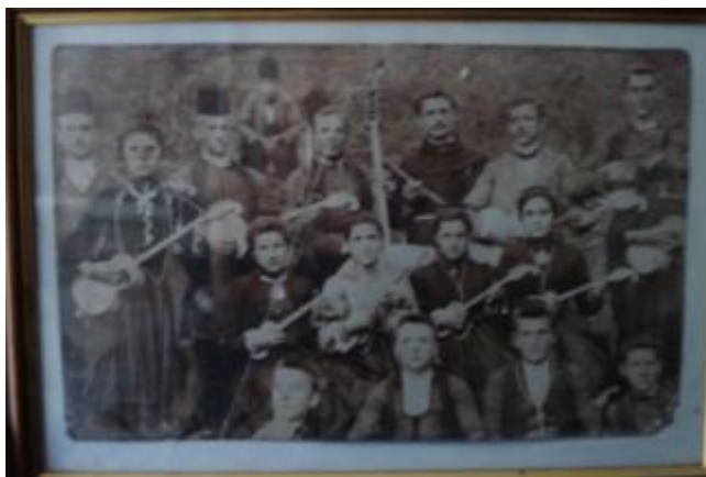
Slika 6. Mješoviti tamburaški orkestar iz Kreševa, 1908., BiH

Prema Leopoldu, “tamburaški orkestar je skupina tamburaša koji zajedno sviraju na tamburama različitih veličina i oblika”. 55 Uobičajeno je da svirači za vrijeme izvođenja glazbe sjede, a pred sobom imaju stalke s notama. Tamburaškim orkestrom ravna ravnatelj orkestra, a orkestar svira po notama i bez improvizacije. Ako je orkestar sastavljen od većeg broja glazbenika, na pojedinim dionicama svira više muzičara.