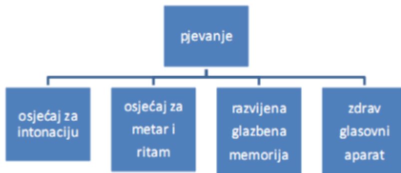
Slika 1. Uvjeti lijepog pjevanja