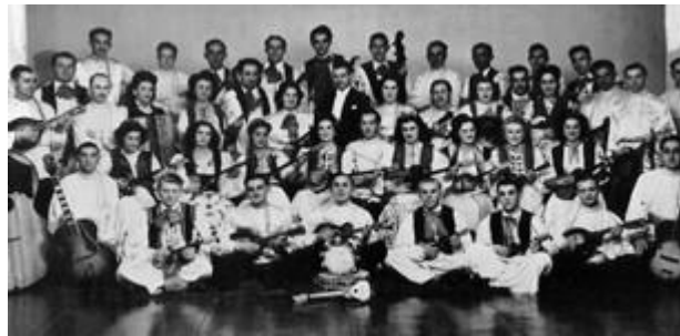
Slika 7. Hrvatski tamburaši iz Johannesburga, Južna Afrika, 1940

Kroz povijesni razvoj glazbe na području Hrvatske, vidljivo je da su Hrvati uvijek bili posvećeni očuvanju svog folkloru. “Na području glazbe prvi Hrvat koji je započeo studij hrvatske narodne glazbe bio je Franjo Ksaver Kuhač. Kuhač je 1870-ih studirao klavir kod virtuoza Franza Liszt u Weimaru, a zatim nastavio studij narodne glazbe objavljujući mnoge knjige o hrvatskom folkloru”. 57