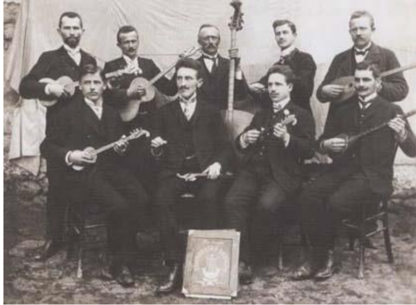
Slika 4. Tamburaški zbor "Hrvatska lira"

Sve veće zanimanje za tamburaše za posljedicu je imalo objavljivanje i širenje novina o instrumentu. “U Hrvatskoj je postojao i časopis "Tamburica", a u Sloveniji je prije Prvog svjetskog rata objavljen list pod nazivom "Slavonska lira". Savez tamburaša Čehoslovačke imao je svoje novine. Hrvati u Sjedinjenim Državama prvi su put objavili novine 1937. godine pod nazivom "Tamburaške vijesti". Iste godine osnovan je tamburaški savez u Osijeku. Godine 1941. osnovan je Tamburaški orkestar Hrvatske radiotelevizije kao profesionalni ansambl zagrebačke radio postaje. Orkestrom već 36 godina upravlja šef dirigent, profesor Siniša Leopold”. 54