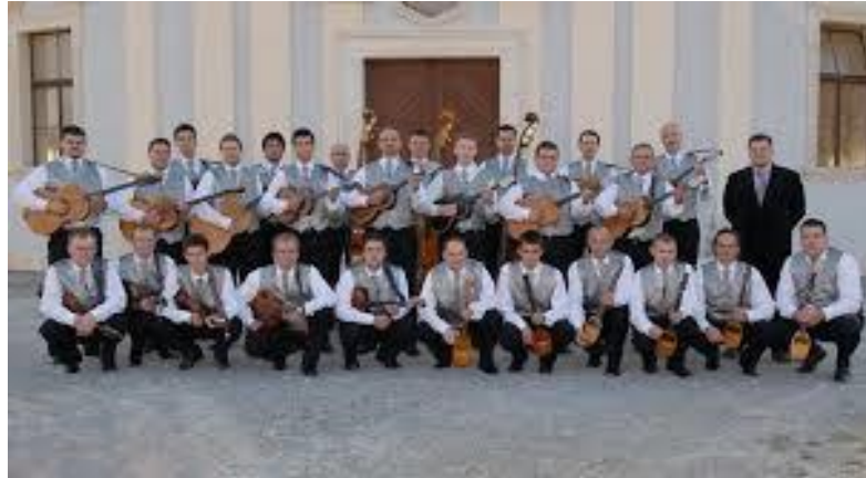
Slika 8. Veliki tamburaški sastav

Svaki svirač ima stalno mjesto u orkestru. U malom (školskom) orkestru svirači mogu sjediti u dva reda, a u velikom su orkestru dionice obično razmještene u tri reda. Ako je partitura složenija, dionice se mogu podijeliti na divize (npr. čelović prvi, drugi; e-brač prvi, drugi; čelo prvi, drugi; berde prve, druge itd.).