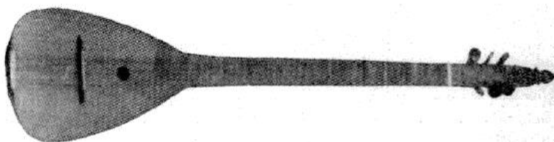
Slika 9. Tambura Paje Kolarića iz 1847. Godine

U katalogu Stjepušin ne navodi zašto je prozvao pojedinu vrstu tamburica tim imenima premda je očito da je želio istaknuti kome su namijenjene. Tako su kućarske i seljačke namijenjene seljačkim tamburaškim (školskim) zborovima, pučke — mlađim zborovima, narodne — malogradskim i obrtnim zborovima, građanske — gradskim i društvenim zborovima. Nakon toga slijede skuplje tamburice finije izrade pa je i oznaka kome su namijenjene drukčija: dvoranske su namijenjene boljim zborovima, velegradske, onima koji žele imati potpuno izvrsne i lijepe tambure, svjetske, onima koji žele imati "uresne" tambure i biserne, onima koji žele imati "izvanredno fino izrađene i biserom urešene tambure". "Razlozi odabira imena se nadalje nalaze u podacima tko ih je izradio (primjerice, svjetske su izradili "prvi i najbolji radnici" dok su sisačke izradili "stariji i vješti radnici"), iz kojeg su materijala i koja im je cijena (npr. najjeftinije su kućarske dok su biserne za polovicu skuplje od svjetskih)." 62