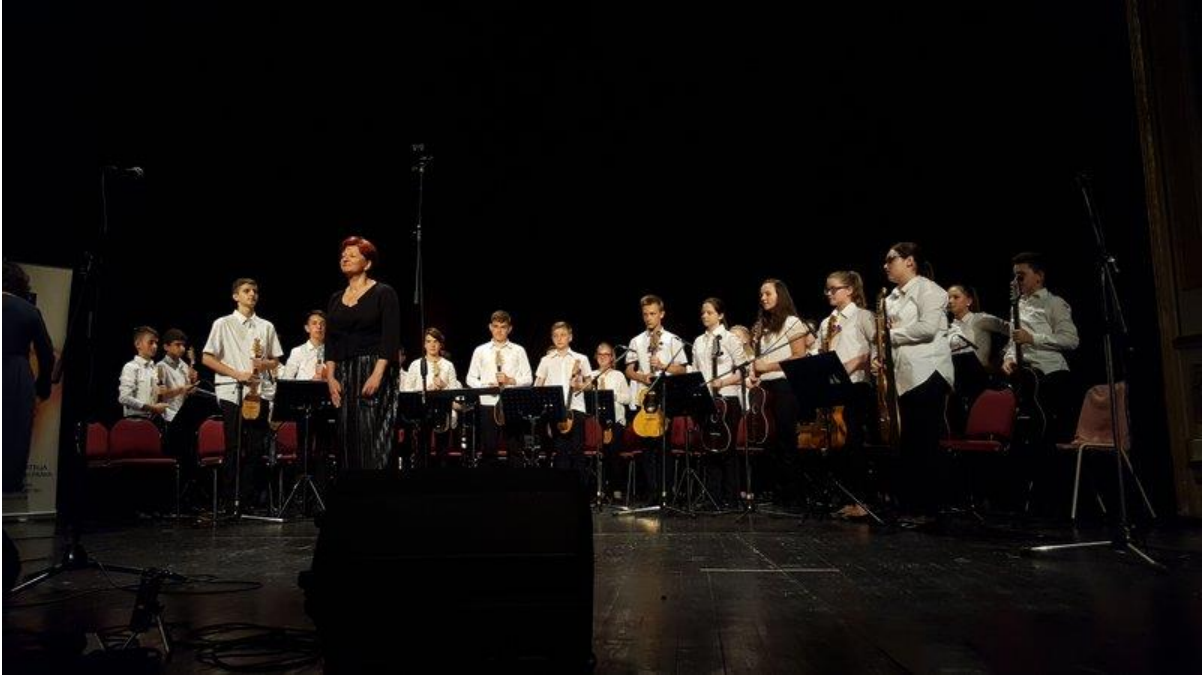
Slika 12. Međunarodni festival tamburaške glazbe u Osijeku