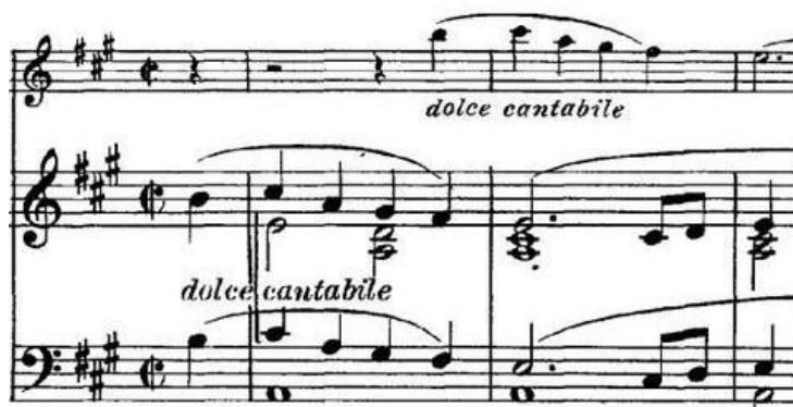
Notni primjer 16: Glavna tema četvrtog stavka

U središnjim epizodama se javljaju obje teme iz trećeg stavka i motivi glavne teme prvog stavka. Rondo završava glavnom temom u accelerandu i dugim violinskim trilerom.