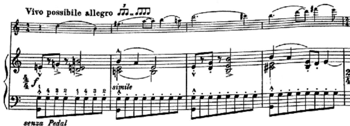
Notni primjer 25:

Ekstatično raspoloženje odjednom prekine „Vivo possibile allegro“, kad violina donese novu, laganiju melodiju.