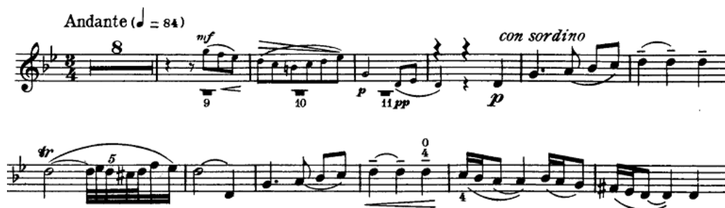
Notni primjer 10: Glavna tema „Canzonette“

Stavak koji je Čajkovski naknadno nadodao. Skladba koju je isprva napisao kao drugi stavak mu je izgledala preduga i kompozicijski odveć zamršena, pa se tako nije uklapala u kompozitorov koncept. 7 Drugi stavak - „Canzonetta“ 8 je jednostavan, introvertiran stavak u g-molu simetrične trodijelne forme A-B-A. Započne s koralnim uvodom puhača, koji priprave nastup solista sa pjevnom, melankoličnom melodijom.