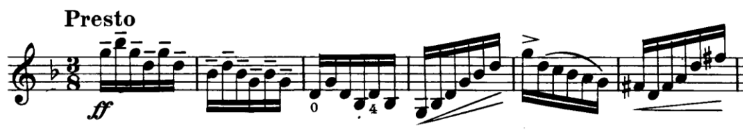
Notni primjer 4: Presto, takt 1 - 6