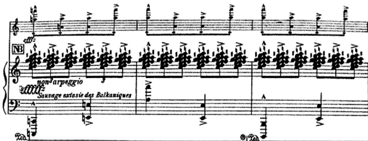
Notni primjer 24: Clustri u Savage Balcaniques

Ekstatično raspoloženje odjednom prekine „Vivo possibile allegro“, kad violina donese novu, laganiju melodiju.