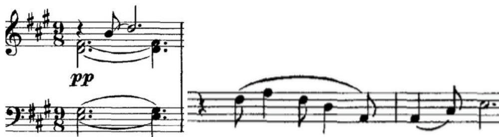
Prvi motiv – klavir