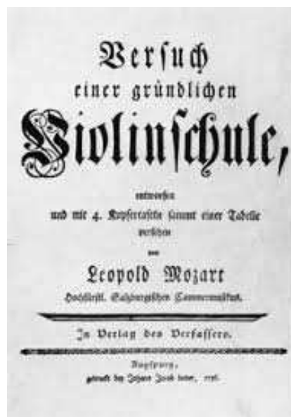
Naslovnica – „Violinska škola“ „Versuch einer gründlichen Violinschule“ Leopolda Mozarta (Augsburg 1756.)