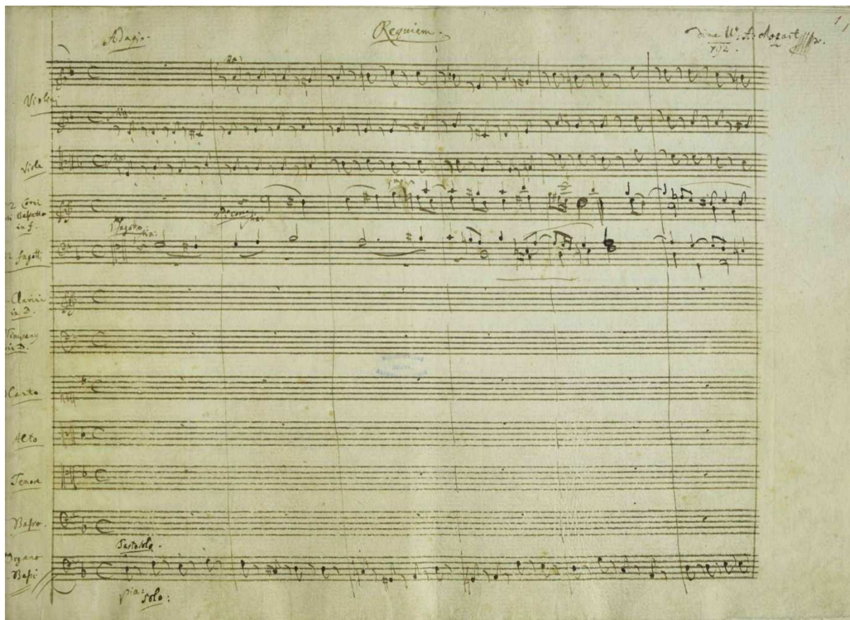
Wolfgang Amadeus Mozart – Requiem u d-molu (K. 626); autograf – početak prvog stavka

Od 20. studenog, uz liječničku brigu Thomasa Franza Closseta i Matthiasa von Sallabe, Mozart je prikovan za svoj bolesnički krevet. Nakon dvotjedne bolesti uzrokovane uremijom usljed kronične bolesti bubrega i rada na nedovršenom Requiemu u d-molu (K. 626), Wolfgang Amadè Mozart, (oblik imena kojim se skladatelj najčešće potpisivao) umro je 5. prosinca 1791. godine u 00.45. sati u svom stanu u Rauhensteingasse nr. 4, u Beču. 6. prosinca Mozartovo je tijelo blagoslovljeno ispred Crucifix Kapelle Sv. Stjepana. Prema izvješćima bečkih kroničara, dan Mozartova pokopa suprotno legendi o snježnoj mećavi bio je tmuran i miran uz blage nalete vjetera, s temperaturom od 3-4 celzijusova stupnja. Uz posljednji pozdrav nekolicе glazbenika i kolega među kojima su bili Süßmayer, Sailer i baron van Swieten, pokrovitelj i prijatelj koji je organizirao Mozartov ispraćaj, sanduk sa skladateljevim tijelom ispraćen je na posljednji put, u zajedničku grobnicu izvan gradskih zidina, na groblje St. Marx, sukladno odredbama Josepha II. o ukopima običnog građanstva.