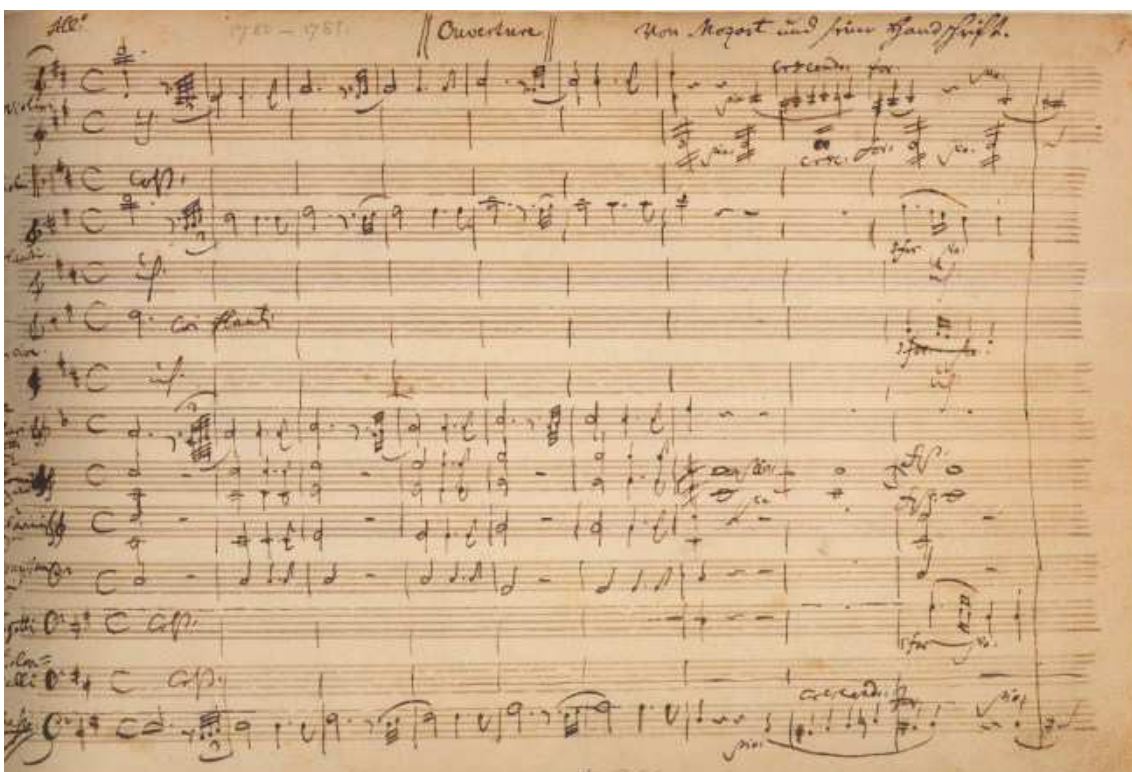
Wolfgang Amadeus Mozart – Autograf prve stranice uvertire za operu Idomeneo (München 1781.)

U Salzburgu 1779. i 1780. godine nastaju Mozartova velika djela, a među njima i singspiel Zaide (K. 344), koji je ostao u formi fragmenta. Od crkvenih skladbi Krunidbena i Solemnis misa, obje u C-duru (K. 317 i 337), Vespeare solennes de Confessore (K. 339) te od instrumentalnih velika Sinfonia Concertante za violinu i violu u Es-duru (K. 364), Posthorn serenada u D-duru (K. 320), te salzburške simfonije u B-duru (K. 318) i C-duru (K. 338). U jesen 1780. godine, Mozart dobiva narudžbu iz Münchena za veliku operu seriu Idomeneo, rè di Creta (K. 366), nakon čega se također nada namještenju na bavarskom dvoru Karla Theodora, izbornog kneza Bavarske. 29. siječnja 1781. godine Idomeneo je praizveden u Münchenu s velikim uspjehom. Idomeneo predstavlja prekretnicu u Mozartovu stvaralaštvu i smatra se prvim opernim remek-djelom. Za vrijeme boravka u Münchenu, Mozart dobiva naredbu da se priključi suiti salzburškog nadbiskupa koji je u posjetu Beču.