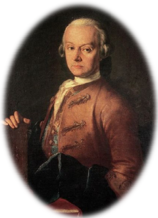
Leopold Mozart (1719. – 1787.) Otac Wolfganga Amadensa Mozarta

Dva putovanja u Prag za Mozarta predstavljaju trenutke najvećeg trijumfa u njegovoj zreloj karijeri. Po povratku u Beč, 23. veljače, Mozart u Kärntnertor Theateru sudjeluje na oproštajnom koncertu sopranistice Anne Seline Storace, prve Susanne , uoči njezinog odlaska u Englesku. Za tu prigodu piše koncertnu ariju za sopran, klavir i orkestar Ch'io mi scordi di te?... Non temer, amato bene (K. 505). Prema libretu Lorenza Da Pontea, Mozart započinje rad na Don Giovanniu , te paralelno završava serenadu za gudače u G-duru, Eine kleine Nachtmusik (K. 525) i Ein musikalischer Spaß (K. 522). Nastaju remek-djela komorne glazbe – gudački kvinteti u C-duru (K. 515) i g-molu (K. 516), rondo za klavir u a-molu (K. 511), klavirska sonata četveroručno u C-duru (K. 521) i posljednja violinska sonata u A-duru (K. 526). Mladi Ludwig van Beethoven dolazi u Beč kako bi s Mozartom učio kompoziciju, no zbog bolesti majke primoran je vratiti se u Bonn. Nije dokumentirano da je do susreta uopće došlo. 28. svibnja u Salzburgu umire Leopold Mozart.