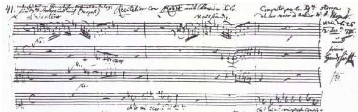
Wolfgang Amadeus Mozart – Dio slike prve stranice s ispisom dionica I., i II. violine, viole i sopranske dionice nesačuvanog autografa Koncertne Scene s Recitativom i Rondòm „Ch'io mi scordi di te?“ – „Non temer, amato bene“ K. 505; Taktovi 1-5.

Vokalno tehnički element u ovoj Sceni brižno je izbalansiran. Glazba sadrži kolorature na strukturalno bitnim glazbenim punktovima, ali Mozart koloraturu izbjegava dajući sceni lirski ugođaj, diktiran od strane teksta ali i ponešto vokalno ograničenih koloratunih mogućnosti Nancy Storace. U ariji je zastupljen srednji i visoki registar, te je potrebno da zrak bude lagan i prozračan. Kao i za ostale Mozartove arije, vrijedi pravilo da samo uz dobru tehničku podlogu djelo može muzički biti prezentirano u svom punom sjaju.