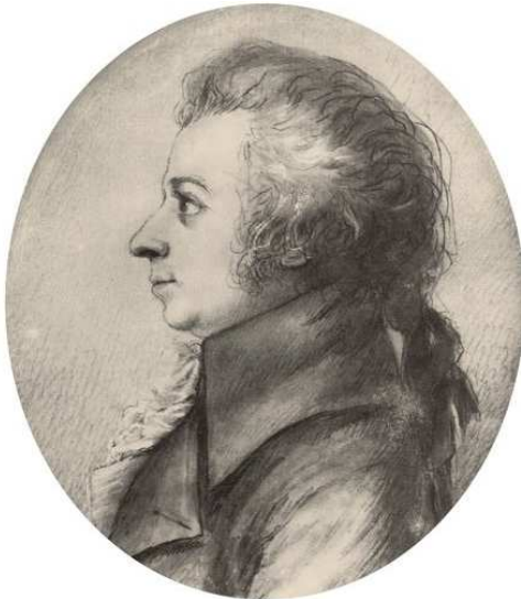
Mozartov portret u olovci iz 1789. godine slikarice Dore Stock