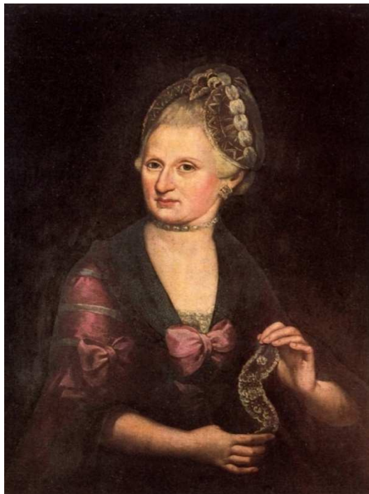
Anna Maria Walburga Mozart (1720. – 1778.) Majka Wolfganga Amadeusa Mozarta

U ljeto 1777. godine, Wolfgang i Leopold dobivaju otpust iz salzburške službe nakon njihove peticije u kojoj traže dopust za putovanje. Na kraju, Mozartova majka, Anna Maria Walburga Mozart (1720–1778) odlazi na put sa sinom u nadi da će on naći namještenje na nekom od europskih dvorova. Nakon kraćih boravaka u Münchenu i Augsburgu, majka i sin ostaju do ožujka 1778. u Mannheimu, gdje Wolfgang upoznaje obitelj Weber i zaljubljuje se u šesnaestogodišnju Aloysiu Weber za koju piše sopransku ariju Alcandro lo confesso (K. 294). U Mannheimu također nastaju kvarteti za flautu (K. 285, 285a), violinske sonate (K. 296, 301-303) te koncert za flautu u G-duru (K. 285c). Koncem ožujka, Mozart s majkom stiže u Pariz. Tu upoznaje ravnatelja kulturnog festivala Le Concert Spirituel , Josepha Legrosa koji naručuje Parišku simfoniju u D-duru (K. 297), a francuski koreograf i režiser Noverre ballet, Les petits reins (K. 299b). Iz tog perioda ostali su nam koncert za flautu i harfu u C-duru (K. 299), violinska sonata u e-molu (K. 304) i klavirska sonata u a-molu (K. 310).