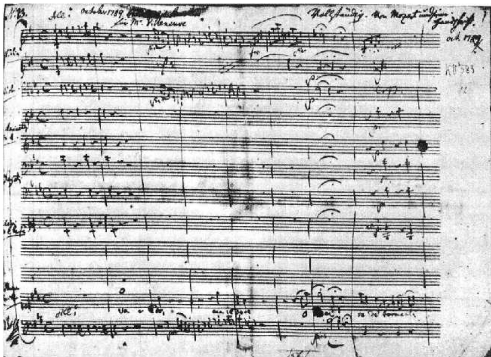
Faksimil. 8: "Vado, ma dove? oh Dei!" KV 583 = No. 44: prva stranica autografa, u posjedu Državne knjižnice, Berlin, Prusko kulturno blago – glazbeni odjel. Cf. stranica 115, taktovi 1–8.

Stječe se dojam da je Mozart gajio simpatije prema mladoj primadoni Villeneuve, ako ne u osobnom onda sigurno u umjetničkom smislu, gdje znamo da je imao visoko mišljenje o njoj, kao pjevačici i glumici. Naspram Villeneuve, Adriannu Ferrarese del Bene, svoju prvu Fiordiligi smatrao je lošom glumicom, a njezine glavne pjevačke adute – snažne visoke i niske tonove, maksimalno je forsirao u djelima pisanim za nju. U tom smislu, s posebnom pažnjom treba promatrati tri koncertne arije napisane za njegovu prvu Dorabellu, Louise Villeneuve.