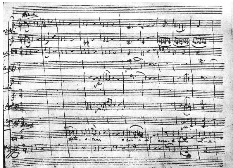
Faksimil 3 i 4: „Bella mia fiamma, addio“ – „Resta, oh cara“ K. 528 = No. 38: prva i treća stranica autografa u posjedu Državne knjižnice, Berlin. Prusko kulturno blago – glazbeni odjel. Cf. stranice 37 i 40, taktovi 1-11 i 1-10