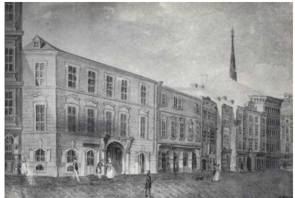
1791. godine Mozart je živio na prvom katu kuće koja nosi adresu Haus Stadt 933; (Raubensteinigasse 10). Ovdje je napisana Čarobna frula i nedovršeni Requiem. U ranim jutarnjim satima, 5. prosinca 1791. godine na ovoj lokaciji Wolfgang Amadeus Mozart je umro.