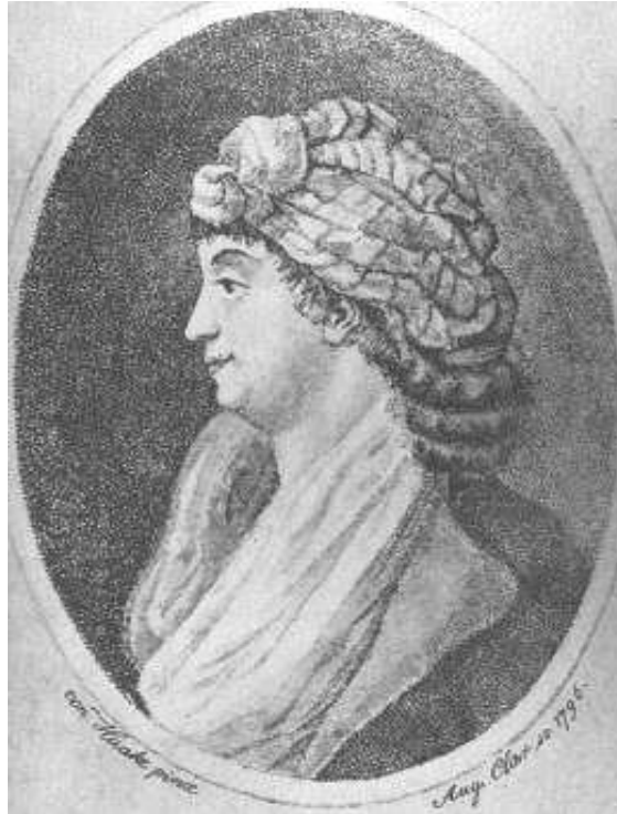
Josepha Duscek (1765. – 1817.), 1796. godine Autor Johann Friedrich August Clar