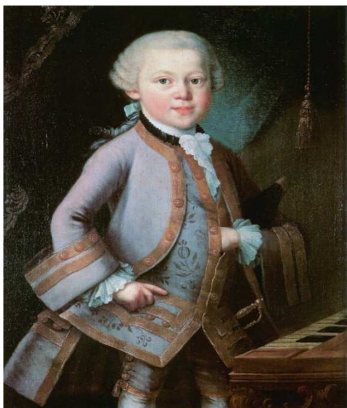
Sedmogodišnji Wolfgang Mozart, djelo nepoznatog slikara (mogući autor Pietro Antonio Lorenzoni), naslikano 1763. godine prema narudžbi Leopolda Mozarta

Mozartovo prvo putovanje u kojem se predstavio svojim kompozicijama, improvizacijama te kao mali virtuoz na klaviru i violini, bilo je u München 1762. godine. S tog putovanja ne postoje nikakvi zapisi od Leopolda Mozarta koji je sve Wolfgangove uspjehe ovjekovječio u svojim pismima, tako da neki ugledni mozartolozi dovode u pitanje to putovanje. 1763. godine Leopold je imenovan zamjenikom kapelmajstora, čime je stekao povlaštenu položaj u službi nadbiskupa. Taj položaj omogućio mu je česta izbijanja s dvora kako bi talent svoje djece predstavio diljem Europe, ali čime je i pronio slavu salzburškog dvora.