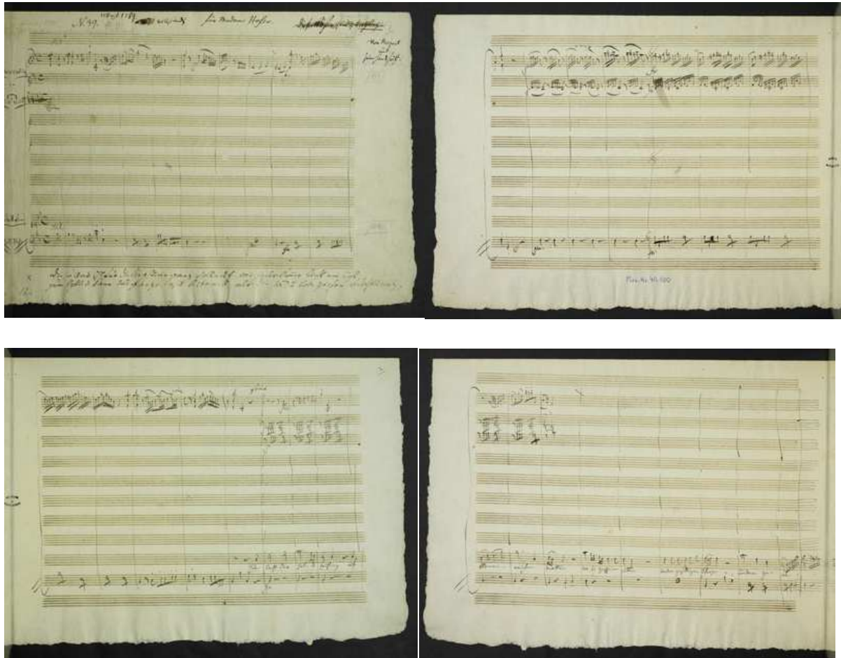
Wolfgang Amadeus Mozart: Autograf fragmenta Koncertne arije „Schon lacht der holde Frühling“, K. 580 s prikazom neispisanih dionica orkestra. Stranice 1-4 u posjedu Austrijske nacionalne knjižnice.

bismo naišli. Na kraju sam došla do saznanja da arija i nije toliko teška kad ju se pjeva na ispravan način, te sam ju imala priliku izvesti na produkciji studenata Muzičke akademije u Hrvatskom glazbenom zavodu u Zagrebu.