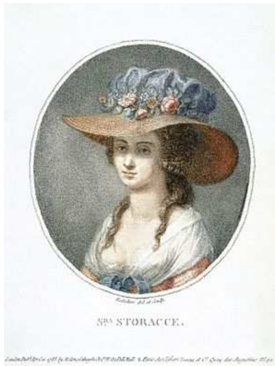
Anna Selina Nancy Storace (1765. – 1817.), cca 1788. godine Portret autora Pietra Battelinija

bolje, ili Mozartovom riječnikom rečeno odgovarala „poput dobro skrojenog kaputa“. S druge strane, uspjeh opere kao najmasovnijeg medija i najveće kulturološko–društvene atrakcije tog vremena, pronosio je slavu skladatelja cijelim tadašnjim Svetim Rimskim Carstvom, kako se tijekom 18. stoljeća zvao konglomerat europske zajednice država. Ukoliko je izvedba pjevača ili pjevačice bila izvrsna i publika ju primila s odobravanjem i oduševljenjem, skladateljima je uspjeh bio zagarantiran. Mozartove bečke godine, osim spomenute Aloysie Lange, obilježile su sopranistice Caterina Cavalieri (1755. – 1801.), Nancy Storace (1765. – 1817.), Adriana Ferrarese Del Bene (oko 1760. – nakon 1804.), Luisa Laschi-Mombelli (1763. – oko 1790.) i Louise Villeneuve (1771. – 1799.), za koje je Mozart pisao svoje operne i koncertne arije, a koje su imale istinski i zasluženi status diva bečkih teataru. Mozartova uobičajna praksa bila je prvo zapisati vokalnu dionicu i dionicu orkestralnog basa (takozvanu particelli skicu partiture), potom takav zapis proći temeljito s pjevačem kojem je arija bila namijenjena i na kraju zapisati preostalu instrumentaciju. Skladatelj je u tom smislu imao također i ulogu vokalnog učitelja pri pomoći pjevačima vezano za interpretaciju djela.