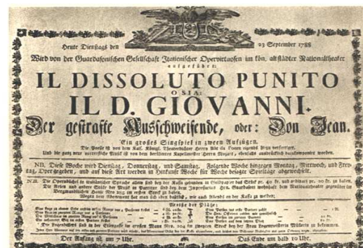
Originalni plakati i najava za Bečku premijeru Don Giovanni , u bečkom Burgtheatru, 1788. godine

29. listopada Mozart u Nostitz teatru u Pragu s čembala ravna praizvedbom opere buffa (u Mozartovom katalogu drama giocoso) Don Giovanni (K. 527). Opera postiže pravi trijumf, iako je zbog niza okolnosti premijera bila odgađana puna dva tjedna. Po povratku u Beč Joseph II. imenuje Mozarta titulom Kammernmusicus (carskim komornim kompozitorom) s godišnjom plaćom od 800 florina.