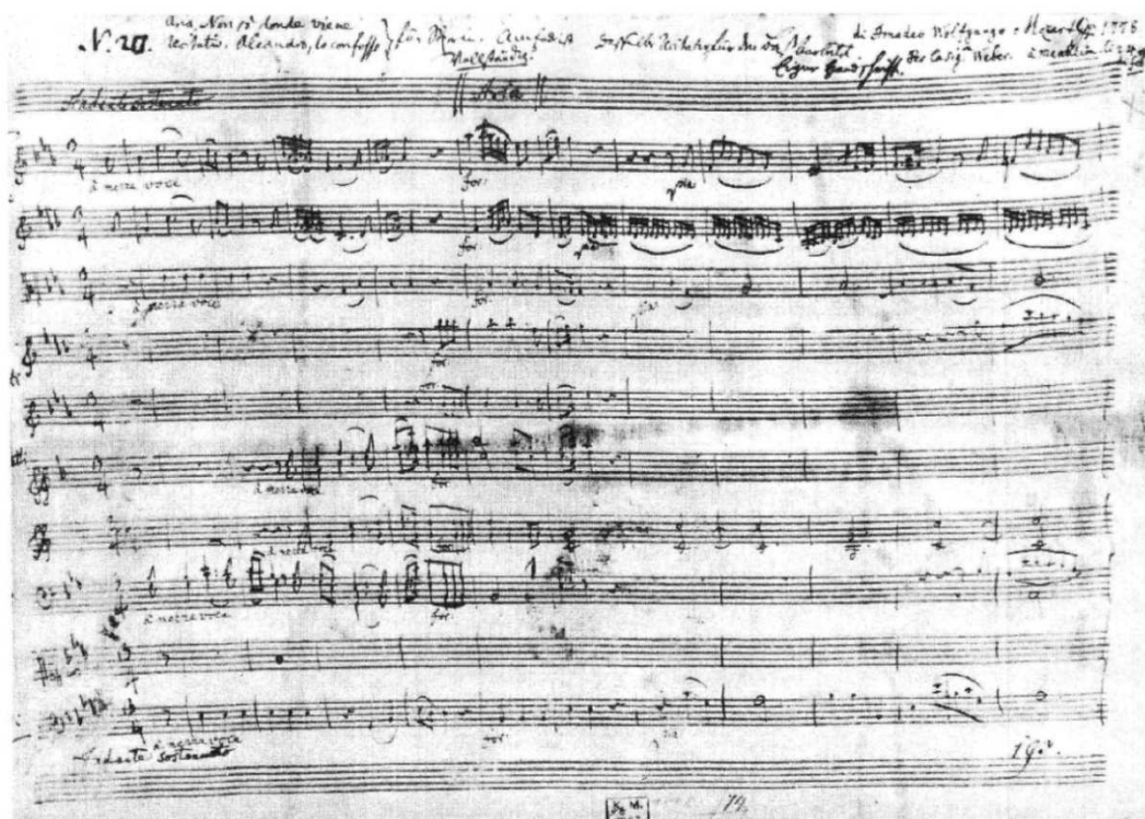
Faksimil 4: „Alcandro, lo confesso“ – „Non sò d'onde viene“ K. 295 = No. 19: prva stranica autografa u posjedu Kestner muzeja, Hannover. Cf stranice 43-44, taktovi 1-11.

„To je andante sostenuto (kojem prethodi kratak recitativ), potom slijedi drugi dio – Nel seno destarmi i nakon toga ponovno sostenuto . Kad sam ju završio, rekao sam g-đjici Weber, "Atmosfera spoznaj sama, pjevaj ju u skladu s onim što osjećaš, nakon toga ću te poslušati i ljubazno ti reći čime sam zadovoljan, a čime nisam."