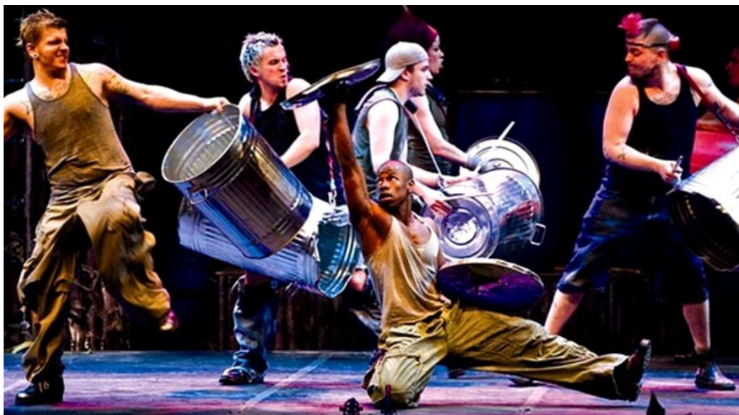
Slika 1: ansambl STOMP