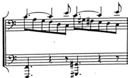
Pr. 1.4 Le balcon iz Cinq poèmes de Charles Baudelaire

4) Zvukovno podebljanje tona ili melodija akorada - jedan od velikih Debussyjevih noviteta bilo je vođenje melodijske linije podebljane akordima koji su se nizali u paralelizmima. Klavirski preludij Potonula katedrala jedan je od najboljih primjera toga.