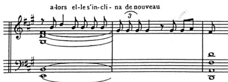
Pr. 1.3 Iz kantate La Damoiselle élue

3) Cjelostepena ljestvica i neklasični ljestvični sustavi. Događaj koji je imao odlučujući utjecaj na Debussyjevu glazbu bila je Svjetska izložba u Parizu 1889. gdje se susreo s indonezijskim (Java i Bali) gamelan orkestrom. Gamelan je izvodio glazbu koja nije bila u temperiranom tonskom sustavu. [11] Debussy je shvatio da ako ljestvica odstupa od tradicionalne podijele na dur i mol, rezultat će nužno biti drugačiji i u glazbenom smislu. Oslanjanje na cjelostepenu ljestvicu, pentatoniku, starocrkvene moduse i sintetske ljestvice koje je sam izmislio postali su jedna od najvažnijih karakteristika Debussyjevog zvuka.