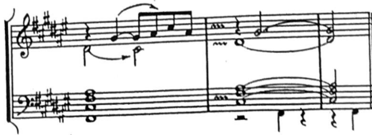
Pr. 1.1 Pelléas et Mélisande , kraj I. čina

1) Dodani tonovi (sekunde) u klasične akorde - Debussy ih je koristio kao dodanu disonancu, appoggiatura ili prohodni ton, bez rješenja. Ovo možemo pronaći već u njegovim najranijim djelima i oni su možda najbitnija karakteristika njegovog harmonijskog vokabulara koji prožima glazbeni jezik u operi Pelléas et Mélisande , skladbi Estampes za klavir ali i u dvije knjige Preludija za klavir. Ponašaju se poput neakordičkih tonova, bez pripreme ili rješenja, ali i bez naročitog akcenta ili isticanja. Debussy ih tretira jednostavno kao dio akorda koji mu daje boju i specifično zvučanje. Dodani tonovi su poput akustičke rezonance temeljnog tona na kojem je građen akord. Ovo nije naročita novina, dodani tonovi su dio harmonijskog vokabulara još od doba Rameaua (dodana seksta - sixte ajoutée) i obilato su ih koristili skladatelji romantizma poput Chopina i Wagnera. Međutim, kod Debussyja ovi dodani tonovi nisu disonantni "uljezi" u akordu, već sami temelj njegovog harmonijskog vokabulara. Najčešće je bila riječ o dodanom intervalu sekste ili none.