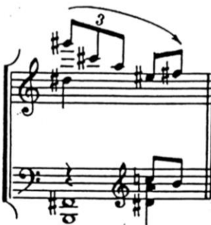
Pr. 1.2 Le balcon iz Cinq poèmes de Charles Baudelaire