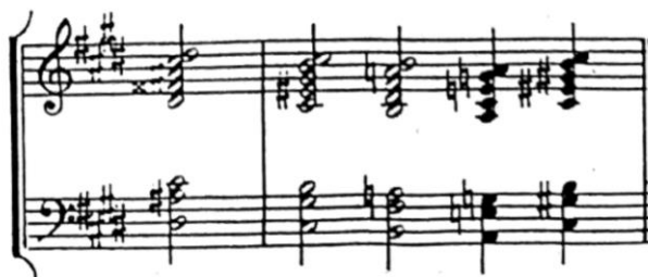
Pr. 1.5 Potonula katedrala iz prve knjige Preludija za klavir [1] [SEP]

4) Zvukovno podebljanje tona ili melodija akorada - jedan od velikih Debussyjevih noviteta bilo je vođenje melodijske linije podebljane akordima koji su se nizali u paralelizmima. Klavirski preludij Potonula katedrala jedan je od najboljih primjera toga.