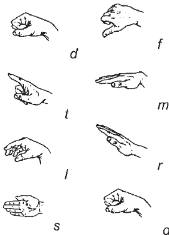
SLIKA 3.2 ZNAKOVI FONOMIMIKE, (HOULAHAN, 2008, 118)

„Zagovornici fonomimike naglašavaju povezivanje zvuka i pokreta, muzikalno ocrtavanje melodijske linije, razvoj auditivnih sposobnosti, mnemotehničku podršku“ (Kazić, 2013, 143). „Hegy i također smatra da su znakovi rukom nužni na svakom satu kod vježbanja intervalskih odnosa dok asocijacije između notne grafike i imena tonova ne postanu automatizirane“ (Kazić, 2013, 143).