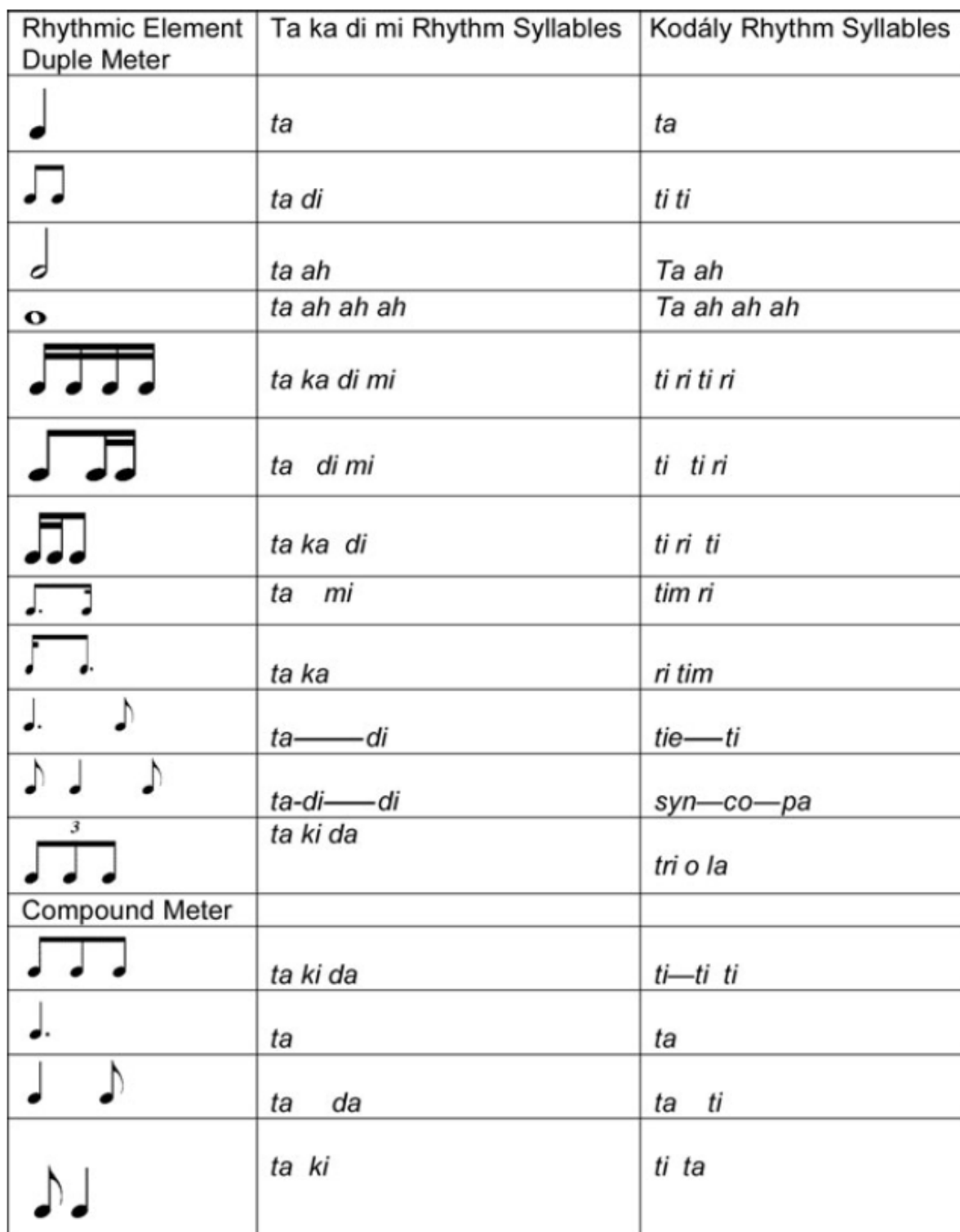
SLIKA 3.4 RAZLIČITI SISTEMI RITAMSKIH SLOGOVA, . (HOULAHAN, 2008,119)