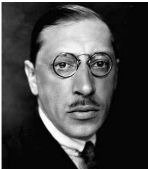
Slika 8 - Igor Stravinski

Balet Žar ptica poznat je po velikoj orkestraciji i zanimljivom uvodu. Koristi narodne motive, ruski folklor. Sadržaj preuzima iz ruske mitologije, točnije poznate priče o žar-ptici i čarobnjaku Koščeju Besmrtnom kojega carević Ivan uz pomoć žar-ptice na koncu pobjeđuje i time skida čaroliju s nesretnoga kraljevstva. Dobro, ljubav i svjetlo, kao što je poznato, pobjeđuju zlo i tamu. Legenda o ptici koja živi nekoliko stotina godina javlja se u mnogim kulturama, primjerice u Egiptu i Kini. Drevni Grci i Rimljani, kao i druge kulture diljem svijeta, vjerovali su u postojanje žar-ptice. Smatrali su da će se nakon smrti ponovno roditi iz vlastitog pepela. Ova čarobna ptica u raznim mitologijama ima i razne nazive. U ranom kršćanstvu bila je simbol uskrsnuća.