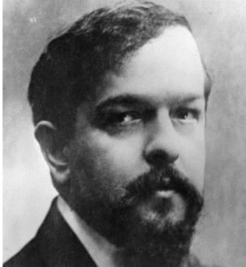
Slika 6. Achille-Claude Debussy

Djelo se može nazvati i skladbom za flautu i orkestar. Razlog tomu je to što flauta iznosi temu na početku bez pratnje orkestra. Sljedeća tri nastupa teme također iznosi flauta, uz pratnju orkestra ili u jednoj varijanti u dijalogu s drugom flautom. Svaki nastup teme varijacija je motiva na osnovni oblik. Orkestralni solo tražen je na svim audicijama za mjesto prve solo flaute iz više razloga. U nastavku će se objasniti građa notnog teksta te problematika orkestralnog isječka.