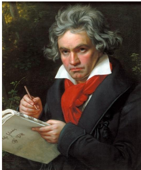
Slika 1 - Ludwig van Beethoven

Ludwig van Beethoven ( 1770.g. – 1827.g.) rođen je u Bonnu u Njemačkoj. Po uzoru na "čudo od djeteta", W. A. Mozarta, otac je malog Ludwiga vrlo rano počeo podučavati violinu i glasovir. S trinaest godina započinje učiti violu i čembalo u dvorskom orkestru. Osim sviranja bavi se i komponiranjem različitih djela. Kako bi stekao nova znanja, odlazi u Beč koji je u to vrijeme bio europsko glazbeno središte. Osim što je imao status pijanista virtuoz, Beethoven je prvi veliki glazbenik u povijesti europske glazbe koji je imao status slobodnog umjetnika. Skladao je djela po narudžbi koja su bila jako dobro plaćena, a od 1808. godine primao je slobodnu, ali neredovitu potporu trojice bečkih aristokrata. Od rane mladosti Beethoven je postupno gubio sluh i ta ga je nesreća pratila do kraja života. Skladao je značajna djela čak i u najtežoj fazi svog života – potpunoj gluhoći. Ostavio je neizbrisiv trag u kasnijem razvoju klasične glazbe.