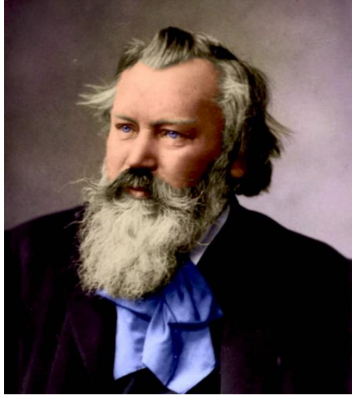
Slika 4 - Johannes Brahms

Napisao je četiri simfonije. Kako je već navedeno bio je perfekcionista te je na svojoj prvoj simfoniji radio čak dvadeset dvije godine. Brahms je svoje simfonije skladao u klasičnom obliku, unoseći u njih osobnost svojega izrazitog romantičnog glazbenog lirizma. Posljednja Brahmsova simfonija ima posebno upečatljiv klasični stil. Vidljiv je veliki utjecaj Bacha te, posebno, Beethovena.