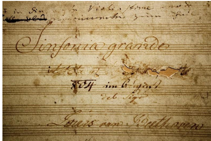
Slika 2 - Naslovna stranica 3. simfonije, Eroica