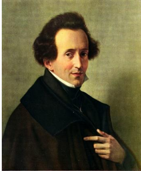
Slika 3 - Felix Mendelssohn-Bartholdy

U Mendelssohnovim djelima nadopunjuju se dvije njegove ljubavi. Prva je ljubav ona prema putovanjima, a druga prema kazalištu. Mendelssohnovo glazbeno-dramsko djelo San ljetne noći inspirirano je Shakespeareovom istoimenom dramom i prepuno je efektnih dramatskih napetosti kakve je samo Mendelssohn znao postići. Prvotno je napisao samo Uvertiru , a šesnaest godina kasnije, na zahtjev pruskog kralja, i cijelo djelo. Koristio je motive iz uvertire i napisao djelo od četrnaest stavaka.