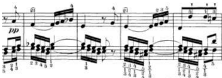
Slika 16: Problematika paralelnih terca u lijevoj ruci

U provedbi uočavamo i problematiku sviranja terci u dvohvatima. Ta se nalazi na trećem nastupu teme kao kontrapunkt u basu i tenoru