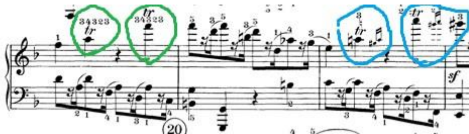
Slika 10: Prikaz trilera iz prvog djela

Drugo mjesto nalazi se u triu stavka u 76. taktu. Tamo se nalazi samo jedan triler ali on nije u funkciji ukrasa nego je duži (traje tri takta).