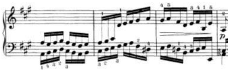
Slika 13: Niz šesnaestinki koje se kreću istovremeno u dva glasa

Predložio bih da se vježba na dva načina: prvi način je vježbanje u sporom tempu u kojem se osigurava čistoća tonova i uvježbava amplituda pokreta. Drugi način je takozvano „nijemo“ vježbanje u kojem je funkcija usmjerena na pokret. Nakon što je prvi ton odsviran, ruka najvećom brzinom skače i zaustavi se nad drugom notom (u ovom slučaju oktavom).