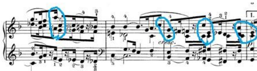
Slika 8: Skokovi unutar punktiranih nota

U ovom stavku prevladava motiv punktirane note. Punktirane note kao jedna melodijska linija ne predstavlja velike tehničke probleme, no u ovom stavku nalazimo dvohvate i akorde koji se kreću u nizu punktiranih nota. Zašto je to problem? Zato što su na nekoliko mjesta zapisani nezgodni skokovi iz šesnaestinke prethodnog para punktiranih nota na osminku sljedećeg para punktiranih nota.