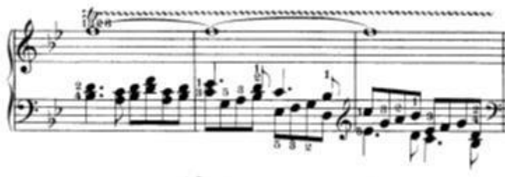
Slika 11: Prikaz dužeg trilera iz drugog djela odnosno "triu"

Drugo mjesto nalazi se u triu stavka u 76. taktu. Tamo se nalazi samo jedan triler ali on nije u funkciji ukrasa nego je duži (traje tri takta).