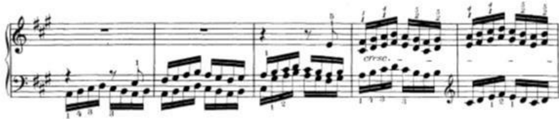
Slika 14: Niz šesnaestinki koje započinju u jednom glasu, zatim se dodaje drugi glas i na kraju još treći glas. U troglasju desna ruka svira paralelno kvarte kao gornji i srednji glas

Najveća tehnička problematika cijelog stavka po mom mišljenju je u prije spomenutim paralelnim sekstakordima. Ovdje nalazimo najveću problematiku jer desna ruka mora odsvirati niz paralelnih kvarti u legatu .