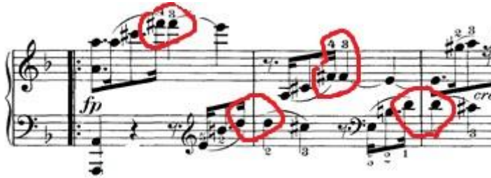
Slika 9: Prikaz repeticija

Kao što sam bio spomenuo, u većini stavka prevladava motiv punktiranih nota. U nekoliko navrata zadnja nota prethodne punktirane note se ponavlja na sljedeću prvu notu.