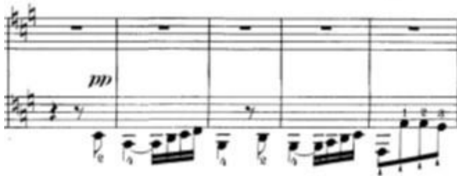
Slika 7: Tema fuge odnosno provedbe četvrtog stavka

Prvih 9 taktova služe kao uvod u fugu. Unutar tog uvoda smiruje se sva razigranost iz ekspozicije i dolazi do modulacije u a-mol - tonalitet u kojoj se odvija četveroglasna fuga. Fuga započinje temom u basu u a-molu (dux, t.123-130).