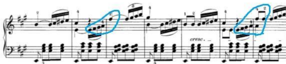
Slika 15: Početak završnog djela u ekspoziciji. Slična problematika sa skokovima kao u prvoj temi četvrtog stavka

Sljedeća problematika pojavljuje se u završnom djelu i u ekspoziciji i u reprizi. Problem je u skokovima na novu poziciju iz jedne šesnaestinke na sljedeću u naznačenim mjestima.