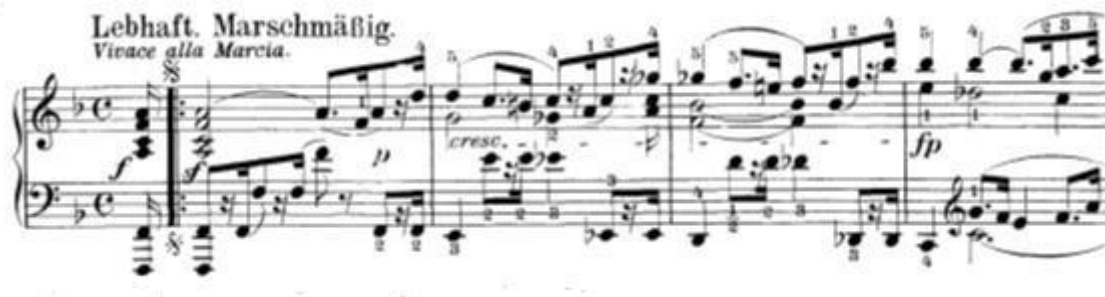
Slika 2: Početak drugog stavka

Prvi dio odnosno A dio (t.1-54) je u dvodijelnom obliku (a b). Prvi dio (a, t.1-11) čini tema koja traje 8 taktova. Nakon 8. takta dolazi do ponavljanja. Prvi puta tema koja započinje u F-duru modulira u C-dur dok se drugi puta tema nakon 8.takta proširuje i kroz to vanjsko proširenje vraća u F-dur tonalitet.