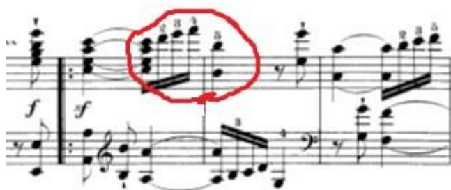
Slika 12: Početak prve teme četvrtog stavka.

Predložio bih da se vježba na dva načina: prvi način je vježbanje u sporom tempu u kojem se osigurava čistoća tonova i uvježbava amplituda pokreta. Drugi način je takozvano „nijemo“ vježbanje u kojem je funkcija usmjerena na pokret. Nakon što je prvi ton odsviran, ruka najvećom brzinom skače i zaustavi se nad drugom notom (u ovom slučaju oktavom).