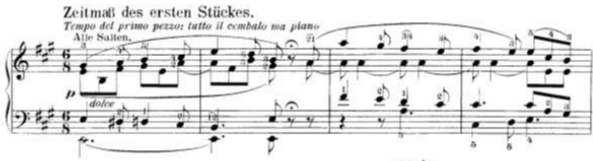
Slika 5: Ponovni nastup prve teme prvog stavka nakon kadence u trećem stavku

Nakon kadence u trećem stavku Beethoven iznenaduje pojavom prve teme prvog stavka (t.21-24). Ovo je bilo vrlo značajno za Beethovenovo kasnije stvaralaštvo. Uzmimo za primjer njegovu devetu simfoniju: na početku četvrtog stavka simfonije dolazi do reminiscencije motiva/fraza iz prethodnih stavaka.