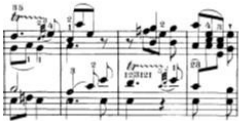
Slika 18: Dvoglasje unutar lijeve i unutar desne ruke u kombinaciji sa trilerima

U codi nalazimo dvije problematike. Prva problematika se nalazi u prvoj polovici code i to je sviranje dva glasa jednom rukom ali uz to su i dodani trileri. Dakle, u 332., 334. i 336. taktu jedna ruka mora u isto vrijeme svirati triler i drugi glas.