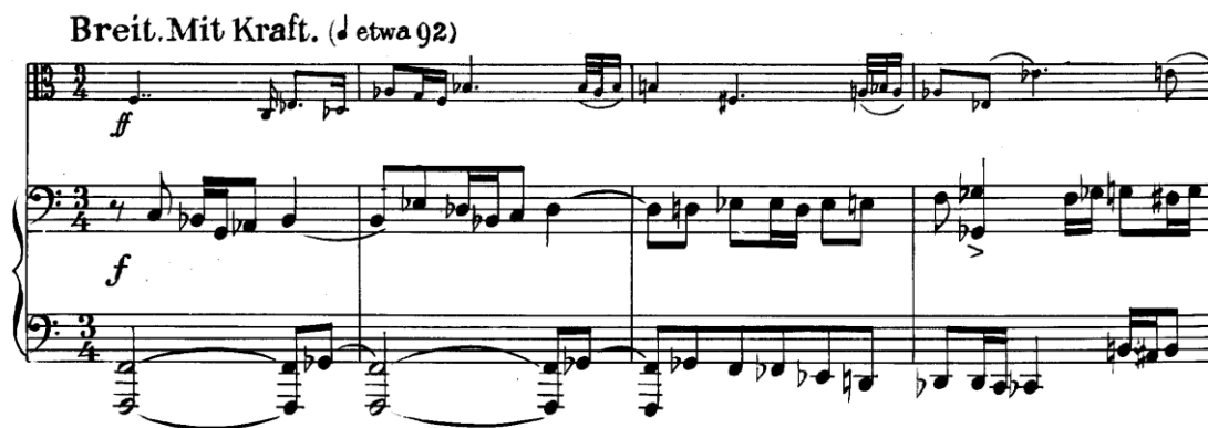
Slika 3.18. Početak I. stavka, izjava I. subjekta

Stavak započinje izjavom koju iznosi viola (I. subjekt). U taktu 16, klavir (II. subjekt) oponaša izjavu I. subjekta s početka stavka.