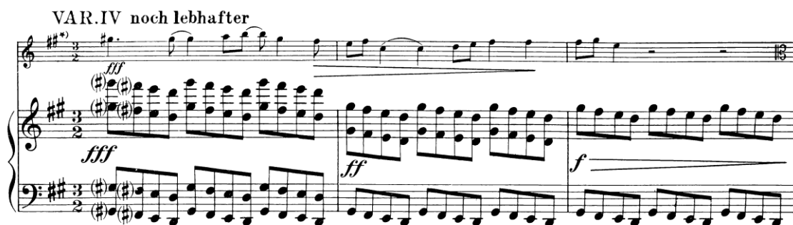
Slika 3.7. IV. varijacija

Četvrta varijacija doseže vrhunac, uz ostinato pratnju koja pruža oslonac neobičnoj ritmičkoj postavci teme. Hindemith koristi manje upotrebljavane tonalitete (Gis i Fis - dur) kao i cjelotonski niz. Viola svira pasaže i fraze u polustepenima, dok klavir inzistira na figuri G# -F# - E - D. Nad figurom u klaviru viola gradi vrhunac u cis - molu, što će ujedno biti i prva nota trećeg stavka.