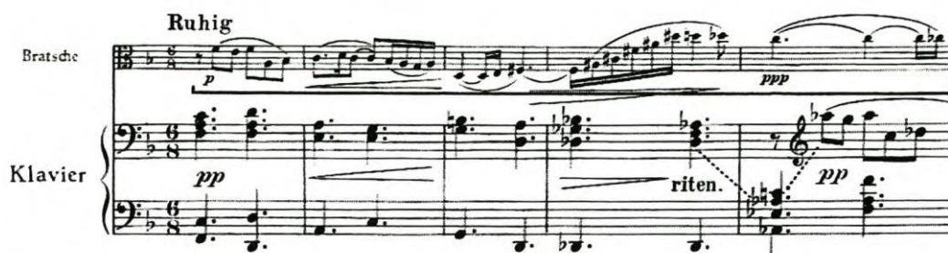
Slika 3.1. Početak I. stavka, nastup teme u dionici viole

Prvi stavak ima oznake tempa Ruhig – Sehr Breit – Im Zeitmaß – Breit 12 . Najkraći je stavak, najslobodniji u korištenju harmonija i u formi. U svega 41-nom taktu skladba mijenja otprilike 10 različitih tonaliteta. Stavak počinje glavnom temom u F - duru koju donosi viola uz prigušenu pratnju klavira.