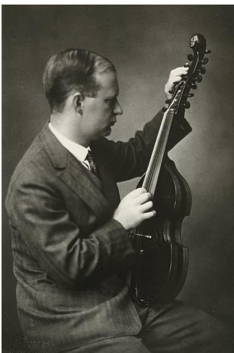
Slika 2.6. Hindemith s violom d'amore

Tijekom turneje u Španjolskoj 1921. godine Hindemith je napustio Rebner kvartet. Sastavio je novi kvartet s Liccom Amarom, koncertmajstorom Mannheimskog orkestra (prva violina), Walterom Casparom (druga violina), i bratom Rudolfom Hindemithom (violončelo). Taj je kvartet postao središtem Hindemithovog glazbenog djelovanja tijekom 1920-tih, a postao je poznat pod nazivom Amar kvartet . Repertoar im se uglavnom sastojao od suvremene glazbe, uključujući djela Bartoka, Stravinskog, Schoenberg, Weberna, naravno, Hindemithova djela, kao i djela mnogih drugih suvremenih autora. Hindemith sada postaje poznatiji upravo kao violist. S otkrićem viole d'amore, Hindemith počinje proučavati i izvoditi ranu glazbu.