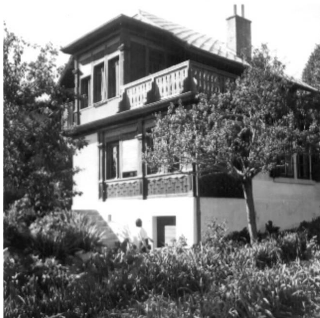
Slika 2.11. Kuća u Bluchu u koju se odselio par Hindemith, „Chalet de Preux“ (1938.)

U svibnju 1938. godine, dok je u Njemačkoj vladala zabrana izvođenja, u Zürichu je slavljena svjetska premijera opere Mathisa der Maler . Dva mjeseca kasnije održana je premijera baleta Nobilissima visione u Londonu. U rujnu iste godine Hindemith je emigrirao u Švicarsku, naseljavajući se u Bluche, selo u dolini Rhône u blizini Siona.