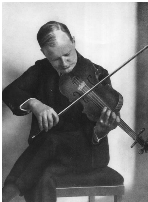
Slika 2.4. Hindemith svira violu

Unatoč promjeni instrumenta, Hindemith je sada počeo misliti na sebe prvenstveno kao na skladatelja.