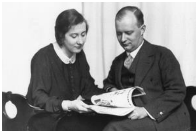
Slika 2.7. Paul i Gertrud Hindemith (1924.)