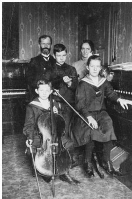
Slika 2.3. Frankfurtski dječji trio oko 1910. godine