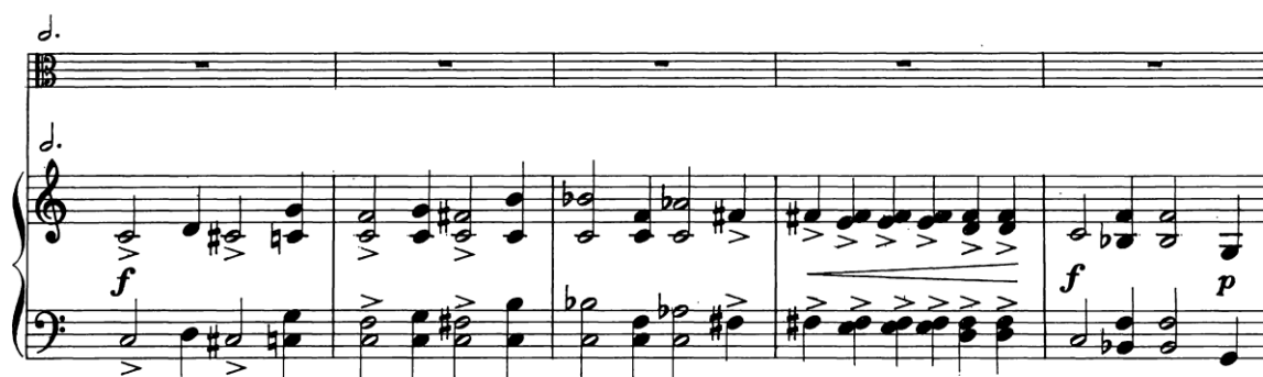
Slika 3.12. Početak I. stavka

Za razliku od virtualnog kontinuiteta prve sonata gdje glazba neprekinuto teče iz jednog stavka u drugi, stavci ove sonate vrlo su kontrastirani i definirani. Klavir igra neuobičajeno istaknutu ulogu, otvarajući prvi stavak prilično dugačkim uvodom.