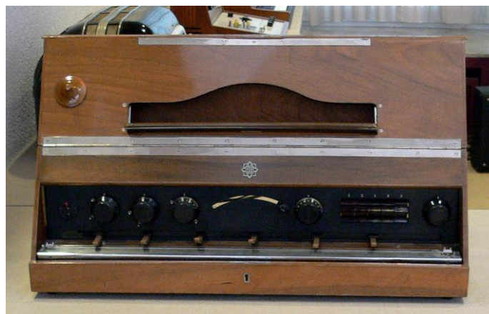
Slika 2.9. Telefunken Volkstrautonium, 1933 (Telefunken Trautonium Ela T 42 (1933–35)) verzija koju je Telefunken proizvodio od 1931. godine, proizvedeno je 200 komada