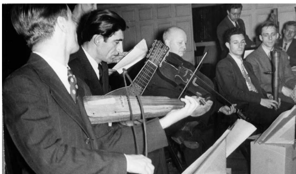
Slika 2.12. Ansambl Collegium Musicum

Usporedno s nastavom o povijesti teorije glazbe, Hindemith je osnovao ansambl Collegium Musicum . Trudio se da izvedbe budu što više povijesno autentične te je zbog toga postao pionikom povijesne izvođačke prakse u SAD-u. Dvanaest koncerata koje je imao s ovim ansamblom (do 1953.) bili su toliko uspješni da su se neki koncerti morali i ponoviti, npr. u New Yorku. Na probama ansambla, Hindemith je svirao violinu, violu, violu d'amore i fagot. Njegova klasa kompozicije na Yaleu smatrana je najboljom u SAD-u, u to vrijeme.