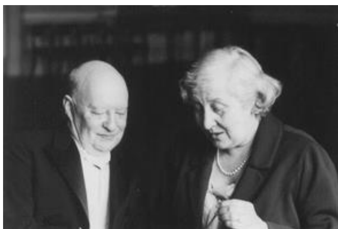
Slika 2.8. Paul i Gertrud Hindemith (1963.)

1924. godine vjenčao se s pjevačicom, glumicom i violončesticom Gertrudom Rottenberg, kćeri Ludwiga Rottenberga. Gertrud je nastupala sa Hindemithom na kućnim glazbenim događanjima za koje je Hindemith napisao mnoge kratke komade.