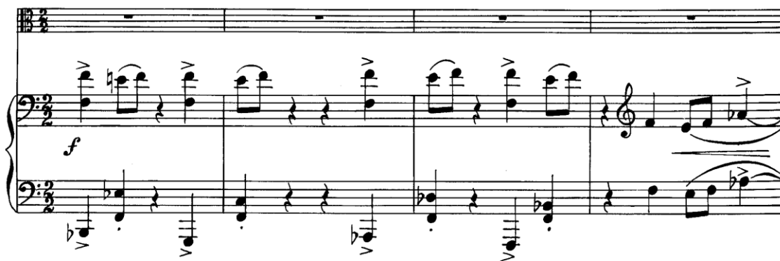
Slika 3.23. Početak II. stavka