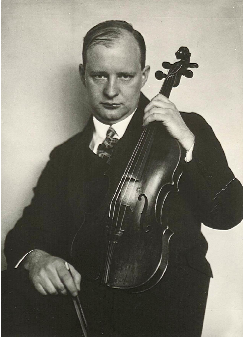
Slika 2.1. Paul Hindemith (1895. - 1963.)