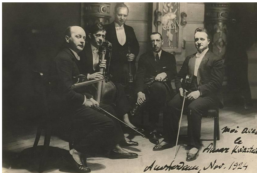
Slika 2.5. Amar kvartet s Igorom Stravinskim (1924.)

Neue Sachlichkeit bio je dominantni umjetnički trend dvadesetih godina prošlog stoljeća. Pojam se prvotno odnosio na likovnu umjetnost, gdje se željelo da i sociološko-politički i umjetnički trendovi istovremeno naglase demokratizaciju svih područja života. U glazbi je to značilo da stil pojedinog djela mora ovisiti o odabranoj funkciji i karakteru. U skladu s tim, Hindemithova instrumentalna glazba tog razdoblja je pomalo eklektična, počevši od širokog raspona stilova. U tom razdoblju nastaje Sonata za violu i klavir , op. 25, br. 4 (1922.), Sonata za Violu solo , op. 25, br. 1 (1922.) i Sonata za Violu solo , op. 31, br. 4 (1923.).