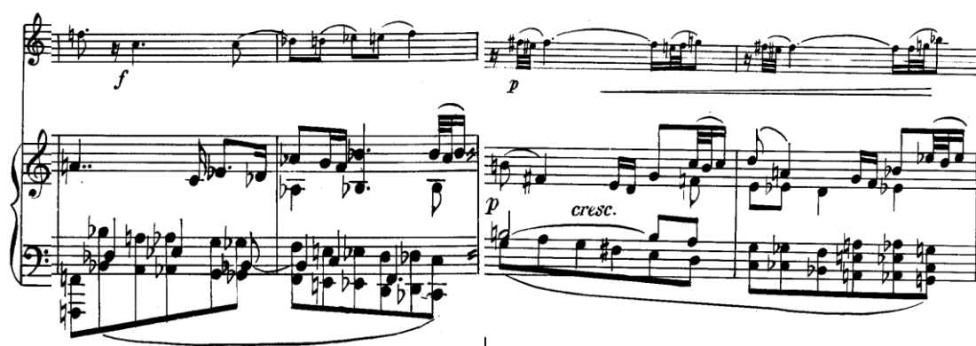
Slika 3.19. II. subjekt oponaša izjavu I. subjekta s početka stavka