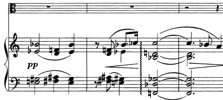
Slika 3.14. Motiv 1 na samom početku II. stavka u dionici klavira

Motiv 1 ponavlja se 5 puta. Tri puta donosi ga klavir, a još dva puta zajedno s violom.