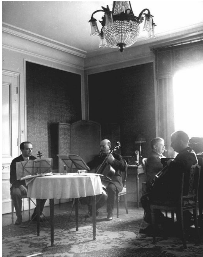
Slika 2.10. Bronislaw Huberman, Pablo Casals, Artur Schnabel, Paul Hindemith (1933.)

Hindemithova glazba krajem dvadesetih godina služila je izrazito raznolikim funkcijama. Napisao je najjednostavnija moguća djela za djecu i amatere kako bi svirao i producirao glazbu za javne koncerte koji su općenito bili manje komplicirani i opsežniji u harmonijskom i tonskom jeziku. Takvu vrstu najbolje predstavlja serija Konzertmusiken op.48, 49 i 50 (1929. - 30.).