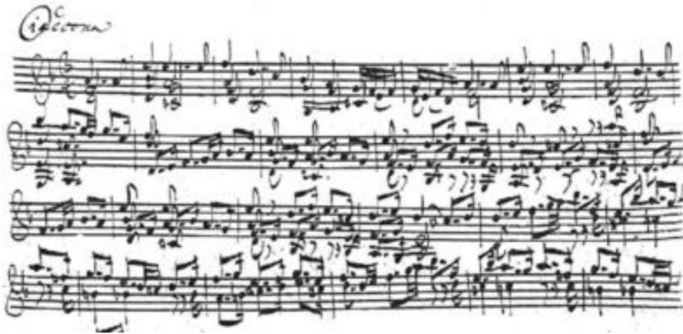
1.a Chaconne, Bachov rukopis

Chaconne , tal. ciaccona , dolazi od plesa poznatog u Španjolskoj 1600-ih godina. Popularan je bio među ženama i parovima, popraćen na kastanjetama. Bachova Chaconna kao posljednji stavak druge partite u d-molu, traje gotovo jednako kao prva četiri stavka, te se smatra jednom od zahtjevnijih skladbi za solo violinu.