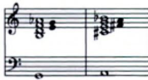
5.7. Duke Ellington: Lightnin' – notni primjer