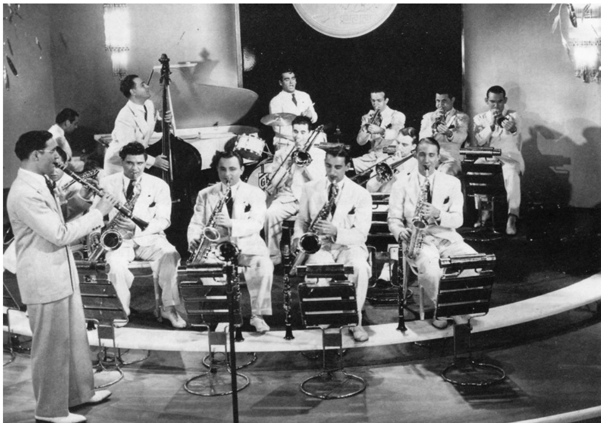
3.1. Benny Goodman i njegov orkestar