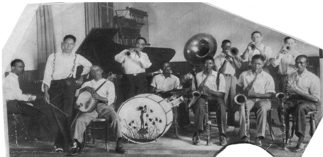
2.2. Jelly Roll Morton's red hot peppers