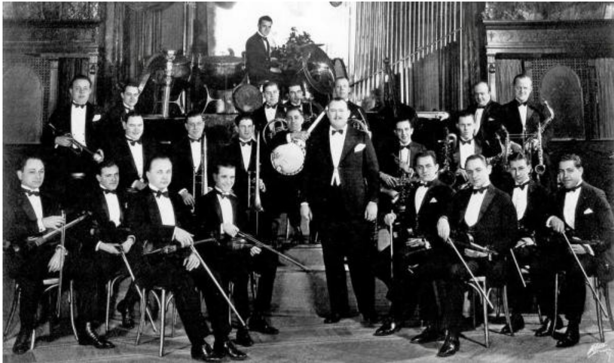
2.4. Paul Whiteman i njegov orkestar

sekciju sastavljenu od oboe, klarineta, sopranino saksofona, dva sopran saksofona, dva alt saksofona, tenor saksofona, bariton saksofona te limenu puhačku sekciju koju su činile dvije trube, dva francuska roga, dva trombona i tuba. Od ostalih instrumenata partitura je uključivala jedan tenor banjo, kontrabas, set bubnjeva, timpane, ksilofon, violine i klavir (na praizvedbi ga je svirao sam Gershwin). Grofé je napravio još jednu orkestraciju djela 1926. godine te orkestraciju za simfonijski orkestar 1942. godine. Unatoč velikom komercijalnom uspjehu njegovog orkestra, sredinom tridesetih godina Whitemanov „simfonijski“ jazz stil gubi na popularnosti uslijed pojave „swing“ pokreta i novih tendencija u jazz glazbi.