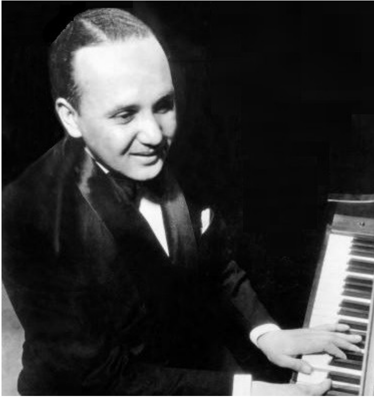
2.5. Fletcher Henderson