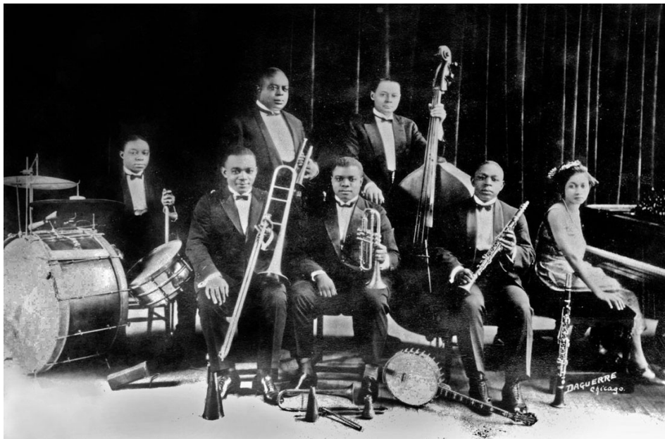
2.1. King Oliver's Creole jazz band