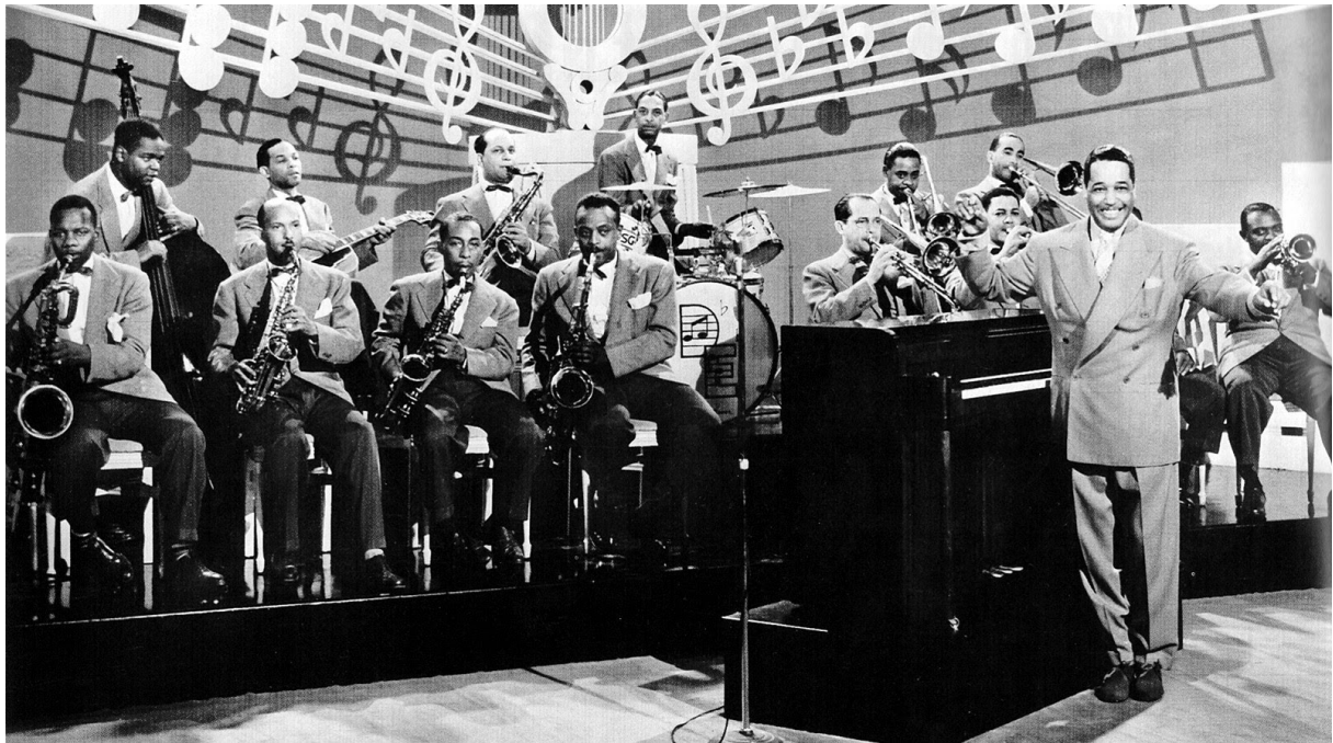
3.2. Duke Ellington i njegov orkestar