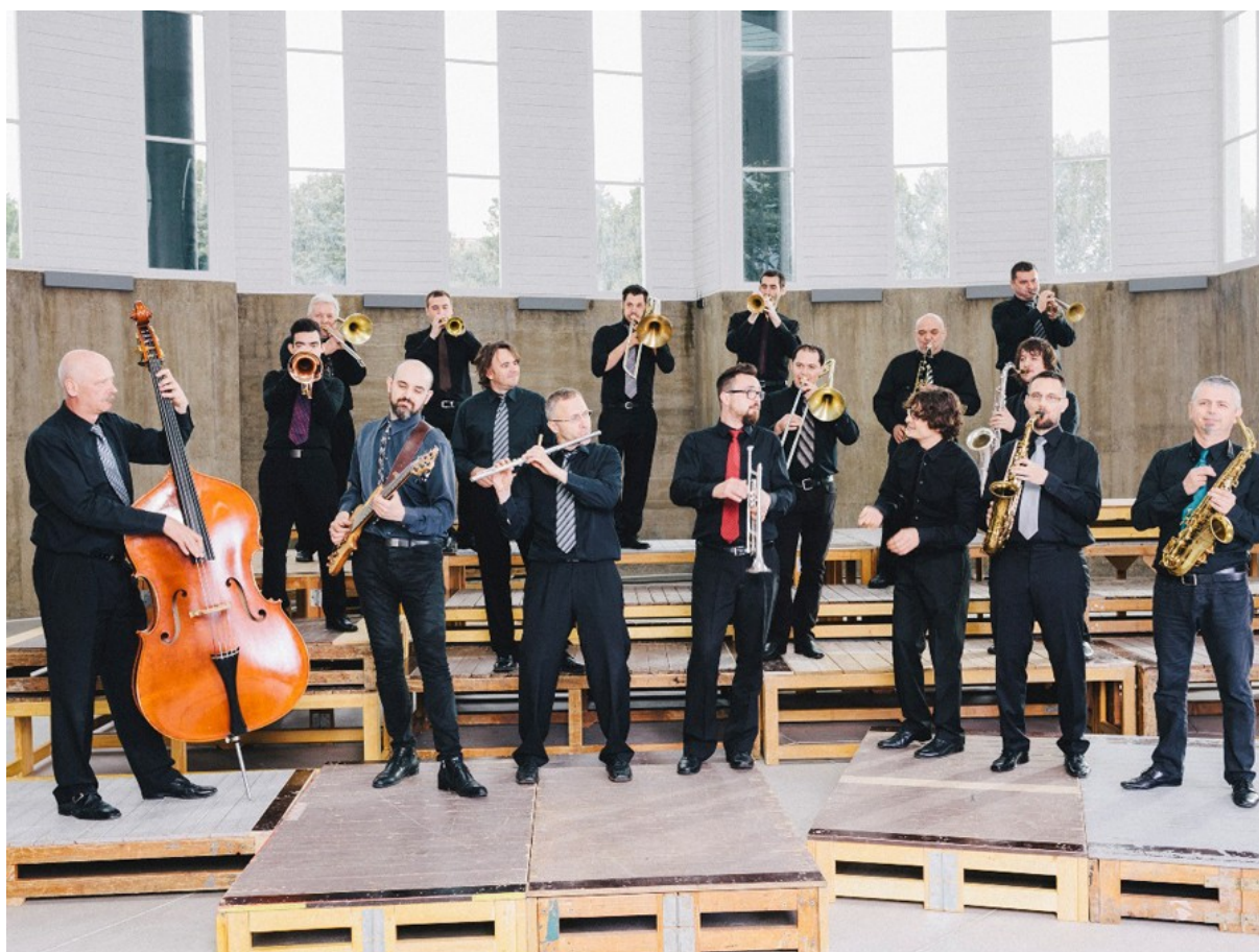
4.1. Jazz orkestar Hrvatske Radio-televizije