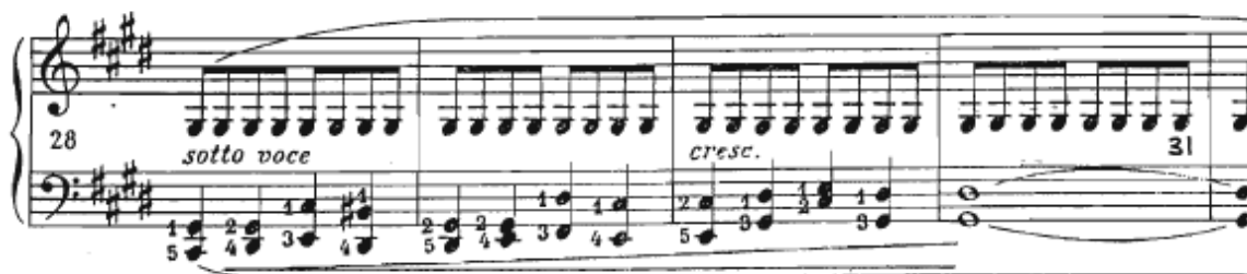
Slika 12 Preludij br. 15, taktovi 28-31

Preludij je napisan u stilu nokturna, a forma mu je A B A. Početak je označen oznakom legato , stoga zvuk treba biti neprekidan, topao i mekan. Uporaba pedala treba biti bogata kako bi doprinijela bogatstvu boje zvuka. Melodija, pratnja te repetirajući ton as zahtijevaju posebnu vrstu artikulacije. Repetirajući ton as treba svirati iz blizine tipke te mijenjati prst na svakoj odsviranoj noti. Melodija treba zvučati bogato, svirana pomalo ispruženim prstima iz cijele ruke koja pritom treba biti maksimalno opuštena. Pratnja zahtijeva kontrolu zvuka te se svira također ispruženim prstima uz pokrete ruke s lijeva na desno. Rubato se može koristiti, međutim predlažem njegovu upotrebu samo na nekoliko mjesta (taktovi 1 i 5). B dio stvara mračnu atmosferu. Ostinatni ton se sada nalazi u liniji desne ruke, dok lijeva ruka izvodi melodiju u dvohvatima. Vrhunac se počinje pripremati od samoga početka B dijela - od takta 28 pa sve do samog vrhunca u trajanju od tri takta koji dolazi u 40. taktu (Slika 12).