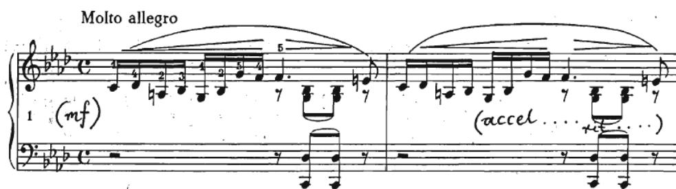
Slika 15 Preludij br. 18, taktovi 1-2

Što se tiče izvođenja, Chopin je izvođaču dao slobodu, no treba biti oprezan s rubatima u početnom motivu kako ne bi svaki put zvučalo jednako i usiljeno (Slika 15).