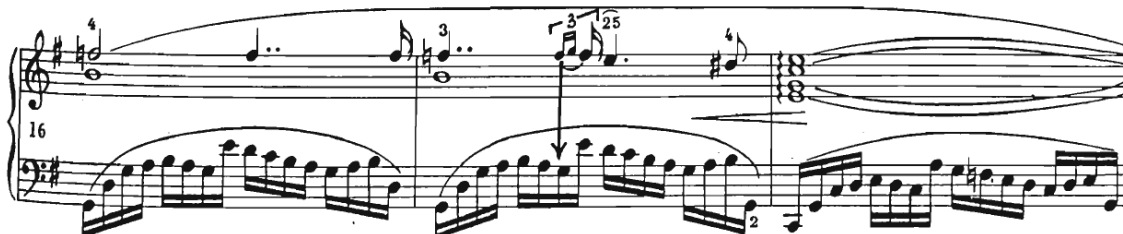
Slika 4 Preludij br. 3, taktovi 16-18

Što se tiče pedala, Chopin nam nije ostavio nikakve oznake te izbor prepušta izvođaču. Na primjer, Ivo Pogorelić ovaj preludij svira skoro bez pedala, Marta Argerich s puno pedala, dok Sokolov gotovo uvijek svira pedal do polovice takta te ga onda pusti. Posebnu pozornost treba pridati šesnaestinkama koje se preko takta nadovezuju na duge note jer se lako može dogoditi da izvođač izađe iz ritma i time izgubi puls (Slika 4).