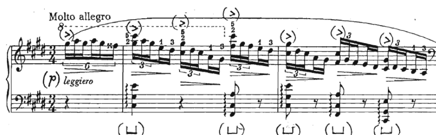
Slika 8 Preludij br. 10, taktovi 1-2

Preludij je sastavljen od pomalo improvizatorske, pijanističke figure koja se spušta čak za tri i pol oktave. Spomenuta figura je zapravo šesnaestinska triola povezana sa dvije šesnaestinke koja je vrlo zahtjevna kada se svira u brzom tempu, a pogotovo poštujući oznaku leggiero (Slika 8).