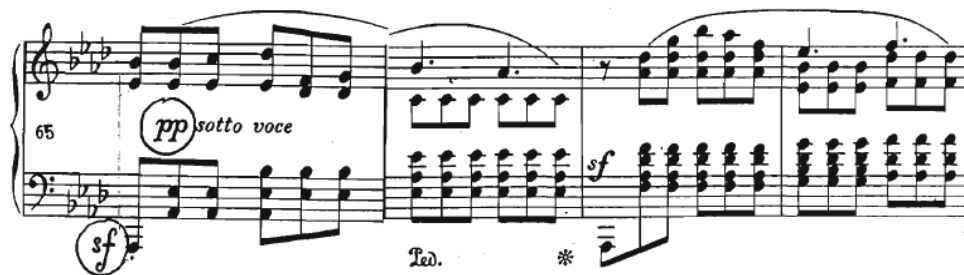
Slika 13 Preludij br. 17, taktovi 65-68