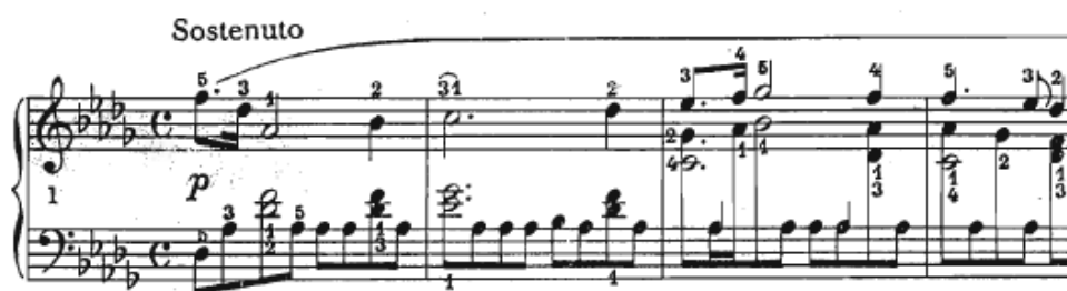
Slika 11 Preludij br. 15, taktovi 1-4

Ovaj preludij se, prema George Sand, također naziva Raindrop . (u prijevodu: kap kiše). Navedene kapi kiše mogu se zamisliti prilikom sviranja linije lijeve ruke – ton as (enharmonijski gis), koji se kroz cijeli preludij prožima u osminkama (Slika 11).