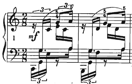
Slika 1 Preludij br. 1, taktovi 1-2

Bilo namjerno ili ne, ovaj preludij aludira na prvi preludij u C–duru iz Dobro ugođenog glasovira J. S. Bacha. Oba preludija su u C–duru i sadrže harmonijske progresije skladane kao rastavljeni akordi sa pokretnim šesnaestinkama. Unutar Chopinovih rastavljenih akorada, nailazimo na četiri različita glasa. Gornji glas ima melodiju u sekundama koju tenor ponavlja u dvostruko sporijoj notaciji. Bas i alt sadrže šesnaestinske triole u dijalogu, pri čemu se bas uvijek kreće uzlazno, dok se alt kreće i uzlazno i silazno (Slika 1).