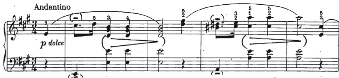
Slika 7 Preludij br. 7, taktovi 1-4

Karakter je jednostavan i pomalo sladunjav te je savršena pauza između dva dramatična preludija (h – mol i fis – mol). Sastoji se od melodije u desnoj ruci koja uvijek „skače“ na disonancu nakon koje slijedi rješenje (Slika 7).