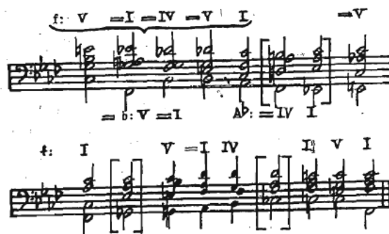
Slika 14 Preludij br. 18, harmonijska analiza

Jak i dinamički osamnaesti preludij sadrži dijalog između brzih pasaža te teških akorada. Ovdje Chopin opet upotrebljava unisono konstrukciju koja je već viđena u četrnaestom preludiju. Harmonijska osnova je f – mol sa uklonima u h–mol, c–mol i As–dur (Slika 14).