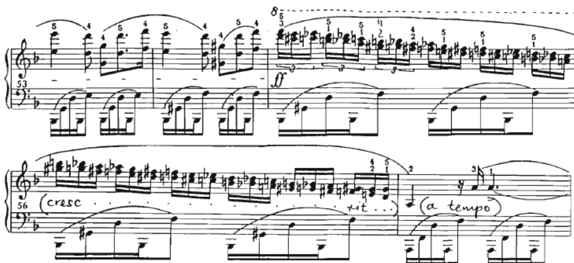
Slika 19 Preludij br. 24, taktovi 53-57

Melodija bi uvijek trebala biti odsvirana dinamički jače od pratnje koristeći težinu cijele ruke. Ponekad tonovi mogu biti odsvirani i palcem. Od tehničkih poteškoća nailazimo na tipične „Chopinove“ brze pasaže koje trebaju djelovati kao ukras te biti odsvirane poput glissanda , a to znači apsolutna artikulacija ispruženim prstima po površini tipaka. Druga tehnička poteškoća su kromatske dvostruke terce u taktu 54 koje traju dva takta te se trebaju vježbati po grupama od 3 i od 6 nota (Slika 19). Preludij završava s tri akcentuirane polovinke koje trebaju biti snažno odsvirane.