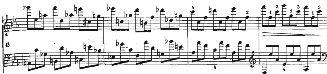
Slika 16 Preludij br. 19, taktovi 43-46

Devetnaesti preludij je trodijelnog oblika s codom od 49. do 71. takta. Tehnički zahtjevan kao etida, sastoji se od rastavljenih akorada u triolama u obje ruke, dok je melodija prisutna u prvim notama triola u desnoj ruci. U zadnjih sedam taktova nailazimo na hemiolu s kromatskom melodijom.