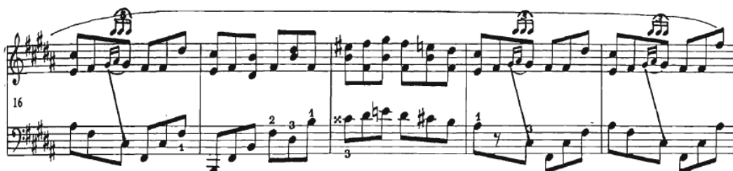
Slika 9 Preludij br. 11, taktovi 16-20

Kroz preludij je prisutno konstantno kretanje u osminkama. Budući da je tempo označen kao vivace , a Chopin zahtijeva legato izvođenje, potrebno je svirati prstima što bliže tipkama, dok zglob treba biti opušten. U taktovima 19 i 20, ukras u desnoj ruci (dvije šesnaestinke i osminka), može se svirati kao šesnaestinka triola (Slika 9).