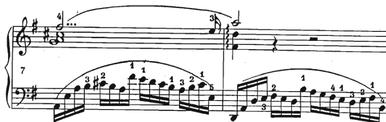
Slika 3 Preludij br. 3, taktovi 7-8

Lijeva ruka bi trebala biti jako lagana, svirana piano i čisto, stvarajući efekt prozračnosti i lepršavosti. Kako bi se dobio taj efekt, zglob treba biti jako nisko, a prsti visoko, artikulirajući svaku notu. Energična desna ruka treba se svirati čisto i iz prstiju (Slika 3).