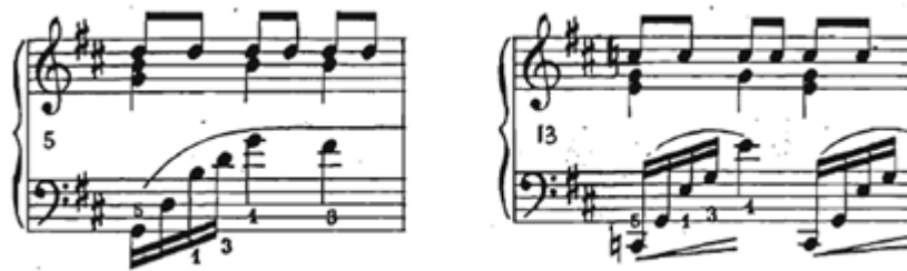
Slika 6 Preludij br. 6, taktovi 5 i 13

Pedal se mijenja na svaku dobu, a može se koristiti i polupedal kada se javlja motiv od četiri šesnaestinke u lijevoj ruci.