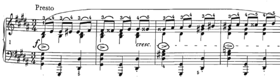
Slika 10 Preludij br. 12 taktovi 1-4

Čvrstog i strastvenog karaktera, ovaj preludij u tročetvrtinskoj mjeri, prikazuje skakajuću bas dionicu s najčešće akcentiranim prvim akordom te liniju desne ruke građenu od motiva koji se kreće uzlazno u malim koracima. Brzi tempo i konstantno kretanje dviju nota pod lukom čine ovaj preludij jednim od tehnički najzahtjevnijih (Slika 10).