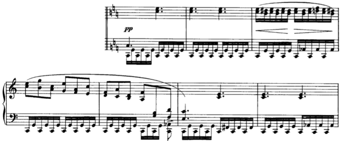
Slika 3.2.d, taktovi 59-65

dinamiku i u tonalitet C-dura. Tremolo je i dalje figura koja je ovdje u lijevoj ruci, dok su u desnoj ruci terce. Terce često mogu biti zahtjevne za sviranje, pogotovo ako se želi postići izjednačenost. Bilo bi dobro u lijevoj ruci naglasiti tonove koji su nositelji nove harmonije. Ovaj dio završava modulacijom u C-dur.