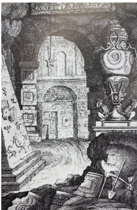
Slika 6: prva naslovna strana libreta iz 1791.