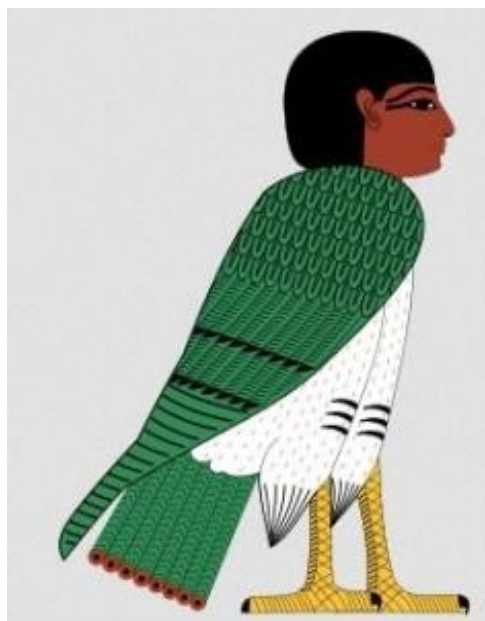
Slika 5: staroegipatsko stvorenje Ba

Papageno: masonski simboli i principi često su povezani s vrijednostima starog Egipta. Papageno podsjeća na staroegipatsko stvorenje „Ba“ koje je imalo čovječju glavu i ptičje tijelo.