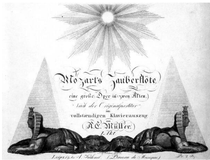
Slika 7: naslovna strana Čarobne frule iz 1815.