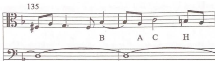
Slika 3: Psalam 4

Pedalni ton u trajanju od četiri takta simbolizira čvrsti temelj koji nam daje naš Otac da bi živjeli u sigurnosti i miru. Iznad pedalnog tona u tenoru vidimo motiv Bachovog imena BACH. Kada uz to povežemo i riječi posljednjeg stiha, zaključujemo da Bach smije sigurno stanovati u Božijoj zaštiti. Posljednje note ovog stavka upućuju na psalam : „Zahvaljujem ti, Jahve, iz svega srca jer si čuo riječi mojih usta.“ 4