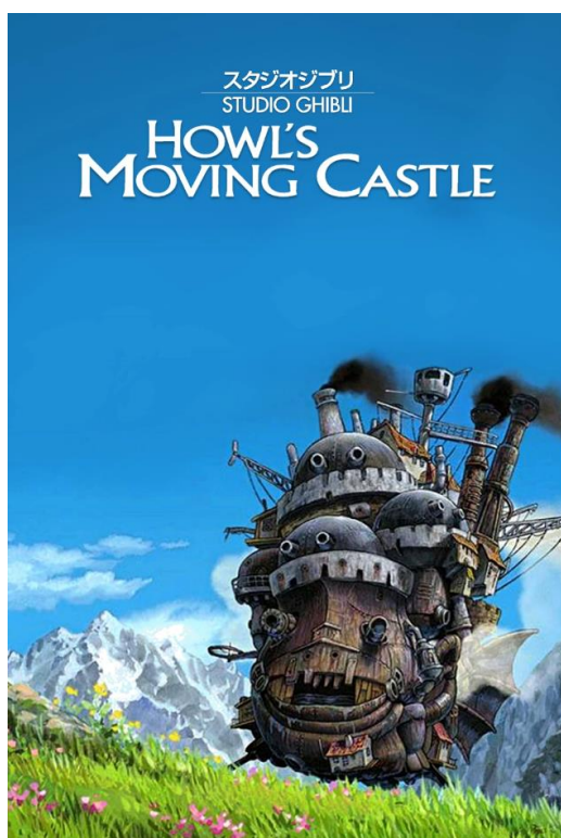
Slika 7: plakat za film 'Howl's Moving Castle'

Ovaj film ističe se zbog glavne glazbene teme koju možemo slušati kroz cijeli film u obliku različitih varijacija. Tijekom filma Sophie i Howl prolaze kroz drastične transformacije, promjena starosti, izgleda i raspoloženja. Te transformacije objašnjavaju Hisaishijevu predanost ovom obliku teme i varijacija. Vrijedno je istaknuti vještinu s kojom skladatelj varira instrumentaciju i ritam te kako prilagođava temu svim različitim situacijama prikazanim u filmu. Dakle, temu možemo slušati u trenucima melankolije, tuge, romantike, spokoja, čak i u trenucima junaštva i hrabrosti, a tema se može čuti kako se izvodi na klaviru solo, samo na gudačkim instrumentima ili u cijelom orkestru.