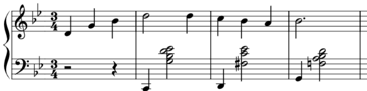
Notni zapis 1: Melodija Merry-Go-Round of Life u g-molu. Transkripcija i redukcija Dalia Cossetto, 2024.

Merry-Go-Round of Life tema je s varijacijama koja se prostiže kroz cijeli film. Napisana je u \frac{3}{4} mjeri. Ta mjera se stereotipično koristi u glazbi kada se treba dobiti dojam o pokretu, letu ili plesu. To ju čini idealnom za ovaj film, gdje je jedan od glavnih elemenata pokretni dvorac. Nadalje, pomaže nam kako bi scenu smjestili u europski kontekst, zbog toga tema također liči bečkom valceru. Tonalitet teme kreće se između g-mola i njegovog paralelnog tonaliteta B-dura, što stvara dojam višeznačnosti uobičajen u Hisaishijevoj glazbi. Iako su stupnjevi korišteni velikom većinom osnovni - I., IV. i V., dodatna napetost i nestabilnost u tonalitetu dobiva se čestim dodavanjem septima, nona i sekunda koje se tretiraju slobodno. Takvo tretiranje akorada možemo naći i u jazzu. Glavni melodijski motiv temelji se na uzlaznom rastavljenom akordu te njegovom silaznom postepenom rješavanju i smirivanju. Ovu ćemo gestu prvo čuti u g-molu (notni zapis 1), a zatim u paralelnom B-duru (notni zapis 2).