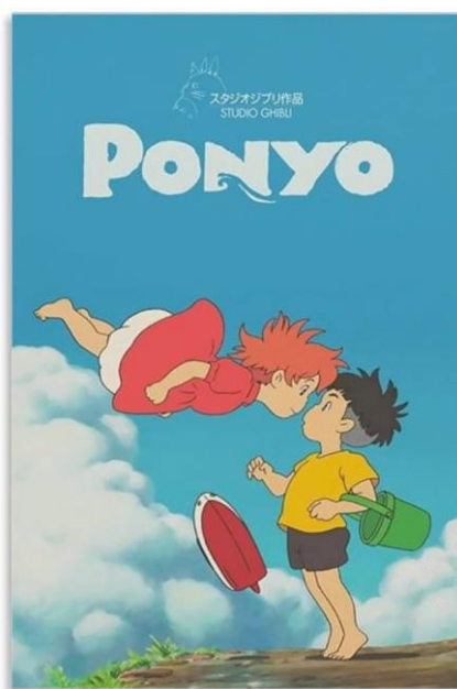
Slika 8: Plakat za film 'Ponyo'

Za ovaj film, temeljen na Maloj sireni Hansa Christiana Andersena, Miyazaki cilja na djecu kao idealnu publiku, s prijateljskim zapletom i djecom kao protagonistima. Prisutnost glazbe je gotovo stalna i vidi se velika koordinacija kompozicije i aranžmana u odnosu na sliku. U ovom filmu postaje očito da Hisaishi počinje biti specifičniji sa svojim temama, povezujući ih izravnije s određenim likovima, približavajući se Wagnerovom lajtmotivu. Ovo neće biti jedina referenca na njemačkog skladatelja, jer nalazimo u glazbi fragmente identične Jahanju Valkira , potpuno namjerno, kada vidimo Ponyo (nekada Brunhilda) kako jaše valove da se sastane sa Sosukeom. Kao i u Pokretnom dvorcu , i u ovom filmu imamo ženskog protagonista koji prolazi kroz veliku transformaciju, iako je ovaj put ona fundamentalno fizička. Također ćemo moći čuti glavni melodijski motiv Ponyo izveden na različite načine, s varijacijama u tonalitetu i ritmu.