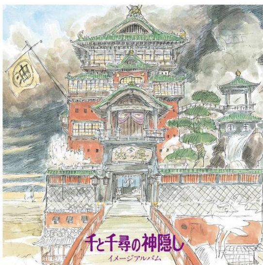
Slika 3: Slikovni album za film 'Spirited Away'

Hisaishi smatra da filmska glazba mora izražavati emocije i inteligenciju koja se može obogatiti muzičkim 'sentimentalizmom': „Bez inteligencije nema iskrenih emocija, i obrnuto. Sentiment je neizostavan element istine i iskrenosti [...] Ja sam sentimentalni humanist koji voli prevoditi osjećaje.“ Međutim, svjestan je da animacija iziskuje posebnu vrstu glazbene preciznosti. Tvrdi da animirani filmovi obično imaju više rezova u istom nizu od neanimiranih filmova i to izaziva u skladatelju da piše kraća i manje razvijena djela. Bez obzira na to, Hisaishi