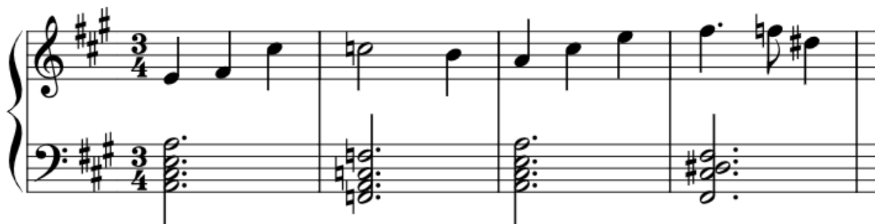
Notni zapis 3: inicijalne pasaže u Deep Sea Pastures . Transkripcija i redukcija Dalia Cossetto, 2024.

Početak ćemo s analizom prve teme koju čujemo na početku filma, i koji je povezan s mističnom snagom oceana. Govorimo o temi koja se zove Deep Sea Pastures . To je tema u \frac{3}{4} mjeri, koja ovdje služi kao usporedba za cikličko kretanje plime i valova, naglašeno sa crescendom u svakom taktu. Nadalje, tema ima vrlo bogatu orkestraciju za zbor i orkestar, što pridodaje dojamu veličanstvenosti orkestra. Vrijedi spomenuti harmonijsku progresiju na početku teme, čija je svrha pobuditi efekt iznenađenja, ali i lepršavosti. Izmjena durkog kvintakorda na tonu 'a' i durskog kvintakorda na tonu 'f' destabilizira osjećaj A-dura, što uz dodatno korištenje malog smanjenog kvintsekstakorda na tonu 'fis' probudi u osobi osjećaje van ovoga svijeta.