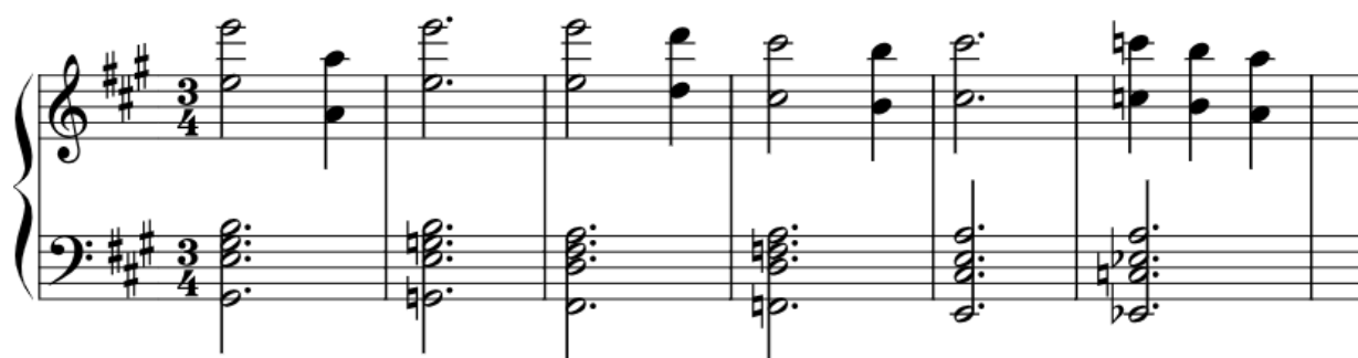
Notni zapis 4: silazni kromatski pomak u basu. Transkripcija i redukcija Dalia Cossetto, 2024.

Pojava dvaju naizgled nepovezanih durskih akorda ključ je tog iznenađujućeg i sjajnog osjećaja koji slušanje izaziva, ali Hisaishi također uvodi tamniju i tajanstveniju komponentu korištenjem smanjenog akorda (mali smanjeni kvintsektakord na tonu 'fis'). Ovi čimbenici pomažu u stvaranju nerealne atmosfere, izvan našeg dosega. Također primjećujemo da, kao i u Merry-Go-Round of Life , skladatelj pribjegava melodijskoj gesti temeljenoj na uzlaznom pitanju i silaznom odgovoru. Drugi dio teme karakterizira pojava V. i IV. stupnja uz njihove odgovarajuće modalne zamjene u molske sektakorde, svi s udvostručenom tercom u basu, stvarajući još jedan od poznatih silaznih pokreta u basu, ovaj put u kromatskom pomaku, nastavljajući tako s kvartsektakordom I. stupnja, nakon čega slijedi smanjeni akord na udaljenosti od pola tona.