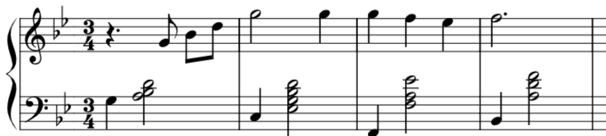
Notni zapis 2: Melodija Merry-Go-Round of Life u B-duru. Transkripcija i redukcija Dalia Cossetto, 2024.