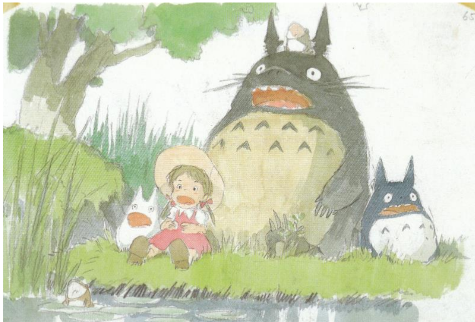
Slika 5: Konceptualni rad za film 'My Neighbour Totoro'