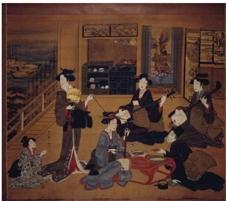
Slika 6: Viseći svitak Utagawe Kunihise (1801.-1818.) prikazuje skupinu gejša i mladog slugu kako sviraju shamisen (tržalački instrument) i kokyū (gudački instrument)