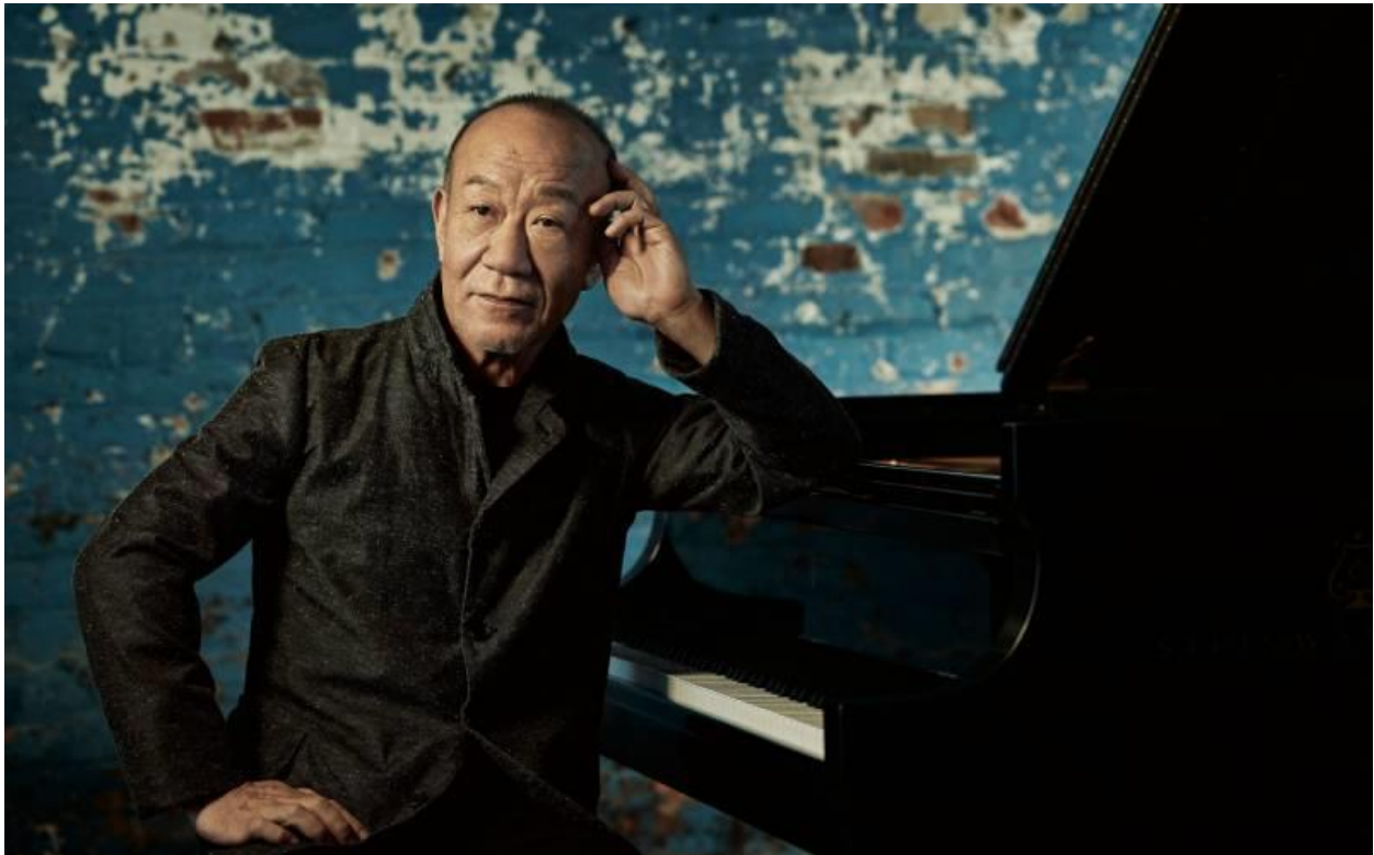
Slika 1: Joe Hisaishi

Mamoru Fujisawa, poznatiji kao Joe Hisaishi, japanski je skladatelj, filmski redatelj, dirigent i pijanist. Rođen je 1950. godine u gradu Nakano u Japanu te svoje glazbeno obrazovanje započinje u Školi violine Suzuki Shinichi sa 4 godine. Upisao je Muzičku akademiju Kunitachi 1969. godine, gdje je diplomirao kompoziciju. Svoj prvi album „MKWAJU“ izdao je 1981. godine, a godinu dana nakon izdaje svoj drugi album, „Information“. Rastom svoje slave, Hisaishi je stvorio pseudonim inspiriran američkim glazbenikom i skladateljem Quincyjem Jonesom: "Quincy", koji se na japanskom izgovara „Kuīnshī“ i piše se istim kanjijem (jedan od japanskih pisama) kao i „Hisaishi“; a „Joe“ dolazi od „Jones“.