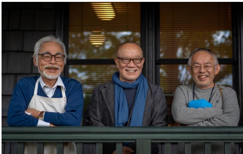
Slika 2: Studio Ghiblijev legendarni trio: Hayao Miyazaki, Joe Hisaishi i Toshio Suzuki

O odnosu između Hisaishija i Miyazakiya, Hisaishi govori: „Mislim da je tajna dugotrajnog profesionalnog odnosa u tome da ne postoji privatni. Hayao i ja ne izlazimo zajedno jesti ili piti. Mi smo strogo profesionalni.“ O vlastitom pristupu u skladanju, skromno i uz dražesan osmijeh dodaje: „Ja sam jako jednostavan skladatelj. Samo želim skladati stvari koje mogu lako svirati kod kuće na klaviru.“ 1