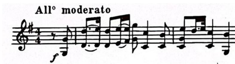
Slika 3. Uvodni stavak Suite za violinu i klavir (1925.) Igora Stravinskog, taktovi 1-2