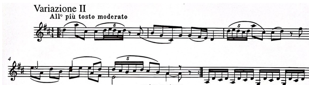
Slika 15. Druga varijacija "Gavotte" Suite za violinu i klavir (1925.) Igora Stravinskog, taktovi 1-6