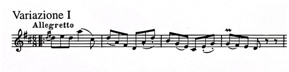
Slika 13 Prva varijacija stavka "Gavotte con due Variazioni" Suite za violinu i klavir (1925.) Igora Stravinskog, taktovi