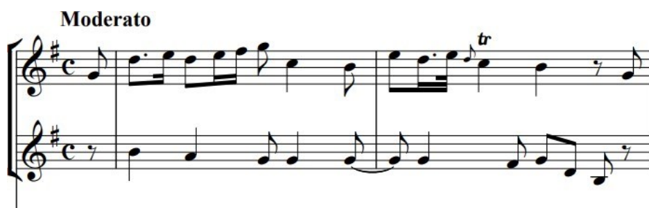
Slika 2. Uvodni dio 1. stavka 1. "Trio Sonate" Domenica Galla u G-duru, taktovi 1-2

Stravinski se poigrava s trajanjem fraza pa zbog toga prvi stavak suite ima nekoliko taktova više od Gallove sonate.