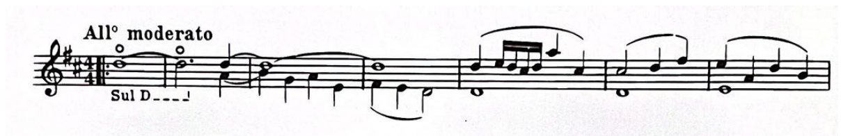
Slika 11. Početak "Gavotte con due Variazioni" Suite za violinu i klavir (1925.) Igora Stravinskog, taktovi 1-7