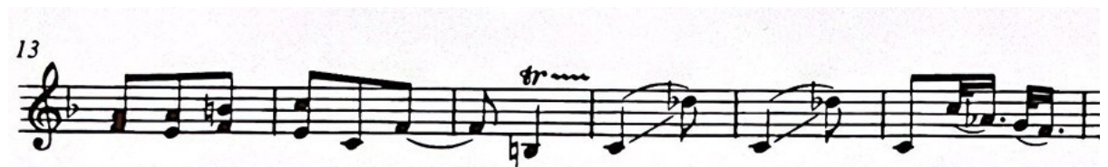
Slika 18. Motiv "glissanda" u 16. i 17. taktu „Minuetta“ iz Suite za violinu i klavir (1925.) Igora Stravinskog

Kako bi spojio Minuetto i Finale , Stravinski dodaje trio (u baletu vokalni) koji nije kao takav postojao u notnim materijalima prema kojima je skladao ( Slika 19 ), a u violinskoj suiti poklapa se s materijalom od 50. do 61. takta. Taj djelić završava na dominantnoj funkciji C-dura što omogućava dobar spoj s Finalem koje započinje u C-duru. 39