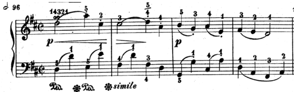
Slika 10. Prvi stavak "Gavotte" u D-duru Carla Monze, taktovi 1-4

Iako zadržava isti tonalitet D-dura, metričku oznaku i tempo, Stravinski dodaje ukrase i ornamentacije koje osvježavaju cijeli stavak i unose dozu maštovitosti. Također u violinskoj dionici koristi pregršt flaggioleta kojima stvara posebnu boju tona.