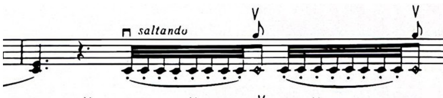
Slika 6. "Saltando" tehnika u kombinaciji s "flaggioletima" iz stavka "Serenata" Suite za violinu i klavir (1925.) Igora Stravinskog, takt 23