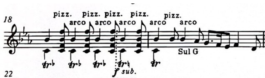
Slika 7. Izmjena "triler" i kvartnih "pizzicato" akorada iz stavka „Serenata“ Suite za violinu i klavir (1925.) Igora Stravinskog, taktovi 18-19