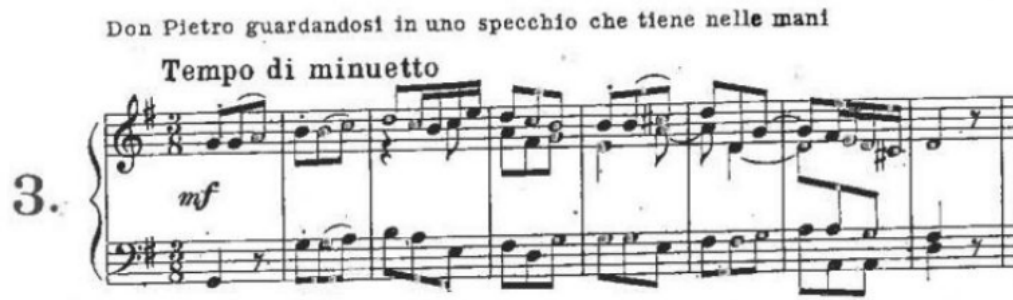
Slika 16. Prvi čin, druga scena Pergolesijeve opere "Lo frate 'nnamorato", taktovi 1-8