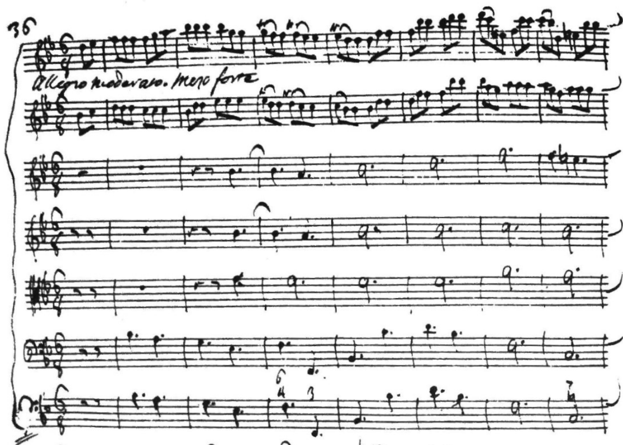
Slika 8. Uvodni dio 4. stavka 6. koncerta iz zbirke "Concerti armonici" Wilhelma von Wassenaera, taktovi 1-7