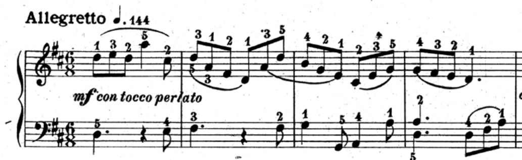
Slika 12. Početak druge varijacije "Gavotte" u D-duru Carla Monze, taktovi 1-4