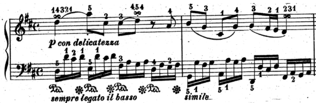
Slika 14. Četvrta varijacija "Gavotte" u D-duru Carla Monze, taktovi 1-2