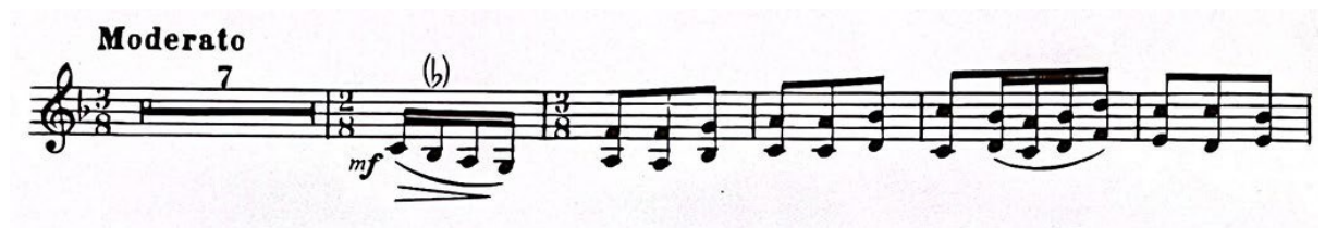
Slika 17. Početak "Minuetta" Suite za violinu i klavir (1925.) Igora Stravinskog