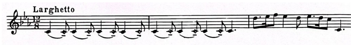
Slika 5. Uvodni dio stavka „Serenata“ Suite za violinu i klavir (1925.), taktovi 1-3